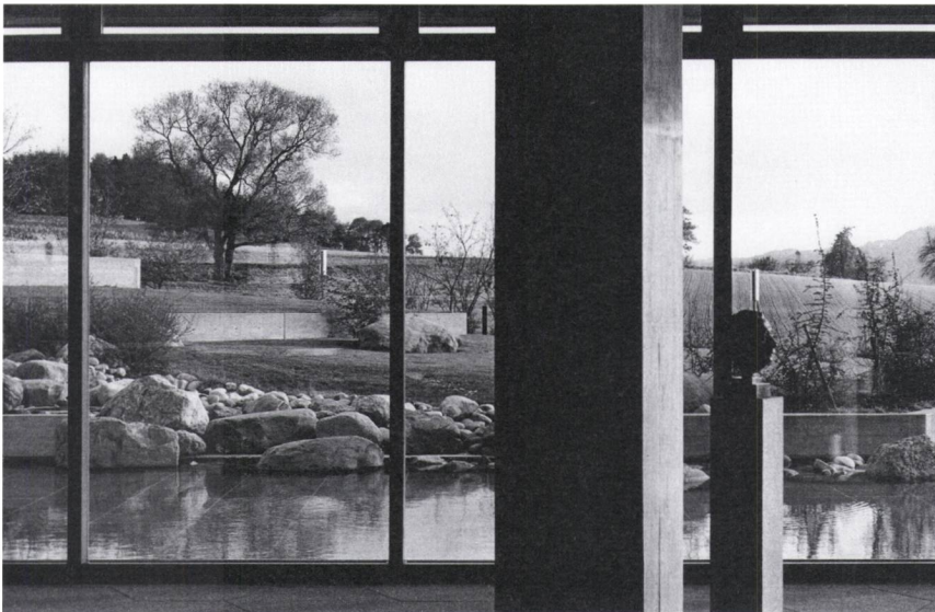
Abb. 5: Innen & Aussen, Form & Streuung: Blick auf den «Einsteinquell» um 1974.

Anderorts wurden mit dem spannungsvollen Platzieren von Findlingen und Steinschüttungen Inspirationen aus Japan weiter verarbeitet. Dies war auf dem Campus beispielsweise im Bereich des sogenannten Einsteinquells der Fall, dessen Wasser vom Inneren des Hörsaalgebäudes nach aussen abfloss, wo es sich kaskadenartig in ein darunter liegendes Becken ergoss. Die architektonische Beckenfassung und die Sichtbetonmauern inszenierten als geometrisierte Höhenlinien die Topografie, während ihre architektonische Strenge durch eine Steinschüttung und spannungsvoll gesetzte Findlinge aufgelockert wurde. Auch der Reiz einer gegenseitigen Durchdringung von Innen- und Aussenraum wurde an dieser Stelle einmal mehr vor Augen geführt (Abb. 5).