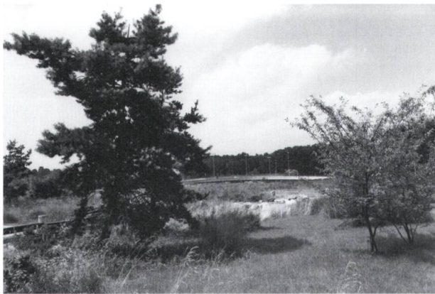
Abb. 8: Natur auf Technik: Das Trockenbiotop auf dem Dach der Tiefgarage des Lehrgebäudes, 1980.

Damit vergleichbar war auch Neukoms landschaftliche Einbindung des Verkehrsknotens an der Einsteinbrücke im Westen des Gebäudekomplexes HIL/HIF. 18 Während die überdimensionierten Verkehrsbauten wie eine Bestätigung des Buchs Bauen als Umweltzerstörung wirkten, schien Neukoms Entwurf von 1974 vielmehr eine Versöhnung mit der Natur anzustreben. So begleiteten male- rische, lockere Baumgruppen aus Kiefern und Lärchen sowie Findlinge die Verkehrswege. Inmitten des Verkehrsknotens und auf dem Dach einer Tiefgarage – gut erkennbar von den oberen Geschossen des Lehrgebäudes – entwarf Neukom ein kunstvoll gestaltetes Trockenbiotop (Abb. 8). Zentrales Motiv war hier ein mäandrierender, ausgetrockneter Bachlauf, dessen Kiesflächen von Konife- ren, Gräsern, Wildstauden (beispielsweise Königskerzen) sowie einer «verwilderten Blumenwiese» begleitet