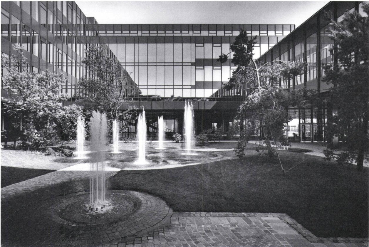
Abb. 7: Kunstnatur mit Wasservulkanen: Der Gartenhof des Lehrgebäudes HIL 1980.

schien. Darüber hinaus beherrschten Berichte über Umweltkatastrophen wie Giftmüllskandale und Atomunfälle zunehmend die Medien. Auch die Zerstörung der Umwelt durch die Planer der Moderne wurde kritisiert. Das 1973 in Zürich erschienene Buch Bauen als Umweltzerstörung. Alarmbilder einer Un-Architektur der Gegenwart porträtierte in plakativem Schwarzweiss eine Planungskultur, die auf Mensch und Natur keinerlei Rücksicht zu nehmen schien. Die vielgesichtige, sogenannte «Naturgartenbewegung», die sich in den folgenden Jahren formierte, forderte, dass Freiraumgestaltung die Gestaltungskräfte der Natur walten lassen und Lebensraum für Flora und Fauna schaffen sollte. 17