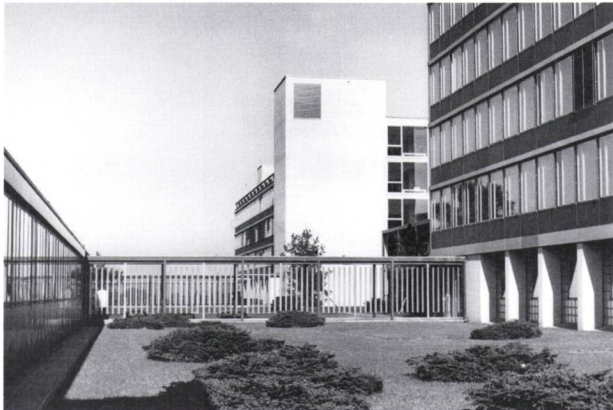
Abb. 4: Reduzierte Interpretation eines japanischen Steingartens: Der Innenhof am Gebäude der Festkörperphysik Mitte der 1970er-Jahre.

die Arbeiten an dem Projekt ETH Höggerberg aufnahm, standen ihm die Reiseeindrücke also noch lebhaft vor Augen. Sichtbar wurde die künstlerische Verarbeitung der fernöstlichen Vorbilder beispielsweise in der gehäuften Anpflanzung «japanisch» anmutender Wald- und Schwarzkiefern, die Neukom bewusst als krumm gewachsene und verkrüppelte Exemplare pflanzen liess, um die malerische Wirkung der Anlage zu steigern. Dass Neukom zu jener Zeit anscheinend frühzeitig sämtliche krumm gewachsene Kiefern der Baumschulen im Zürcher Umkreis reserviert hatte, bevor seine Berufskollegen vorsprechen