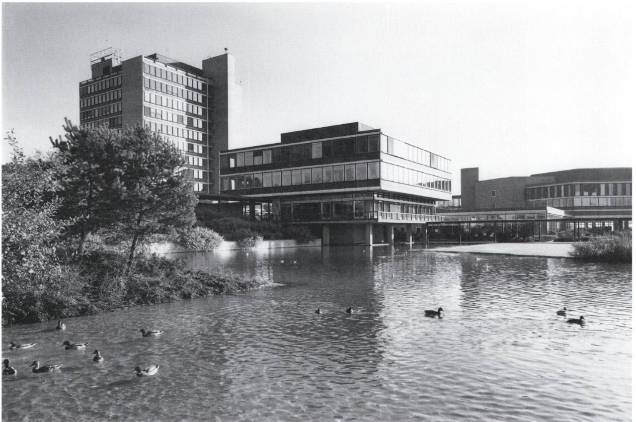
Abb. 3: Abstrahierte Naturlandschaft: Der Park am Feuerlöschteich Mitte der 1970er-Jahre mit Blick auf das Zentralgebäude und das Praktikumshochhaus.

der Geometrie der Gebäude heraus entwickelten, dann jedoch oftmals in abgeknickter Form Höhenlinien nachbildeten. Demgegenüber stand eine Bepflanzung, die den Eindruck einer domestizierten Wildnis vermittelte. Mit Kiefern, niedrigen immergrünen Sträuchern und hohen Gräsern evozierte sie den Eindruck eines kargen, aber malerischen Naturstandorts, etwa jenes eines Hochmoors in den Bergen. Niedere Weidenarten und Zwergbirken besiedelten den Gewässerrand sowie die davon aufsteigende Terrassenanlage und griffen das Motiv einer natürlichen Ufervegetation auf. Bäume wurden überwiegend zu Gruppen einer Art zusammengefasst, um ein «ruhiges» Bild zu gewährleisten. Pittoreske Pflanzungen von mehrstämmigen Scheinbuchen und Parrotien setzten im Herbst kräftige Farbakzente.