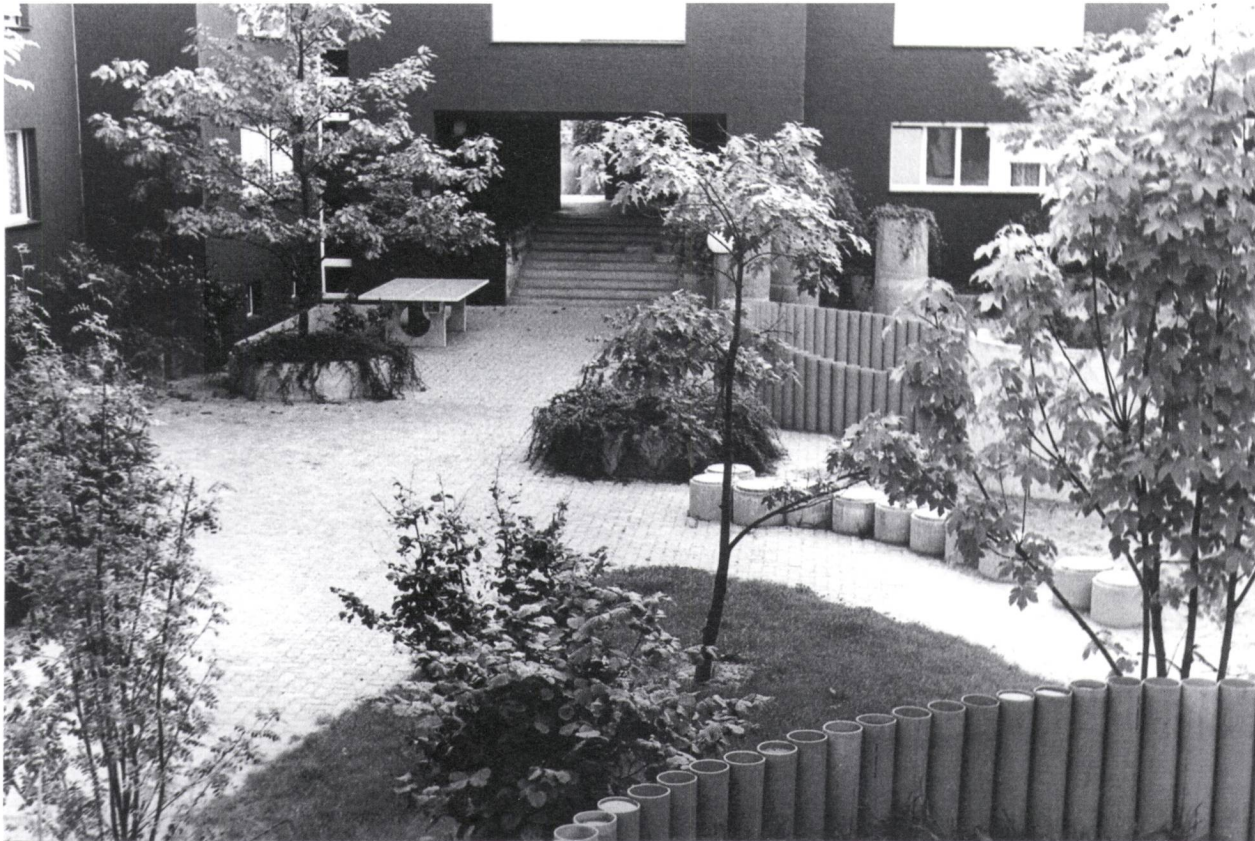
Abb. 5: Nahe den Hauseingängen wurden Tischtennistische, Sandspielbereiche und Betonzylinder für Strauch- und Baumpflanzungen platziert. Die Verkleidung der Wohnblöcke mit der Wärmeschutzdämmung erfolgte zwischen 2007 und 2008. Foto: vermutlich Dieter Kienast, um 1975.

und die Siedlung gegen Lärm und Staub abschirmen. Auf der anderen Seite der Gebäude sind entlang der Balkone in Ziegelrot Privatbereiche gekennzeichnet, in denen Kienast «Gartensitzplätze mit Schutz gegen die öffentliche Fläche» vorsah. Ein brauner Filzstrich markiert einen Erdwall als Abschluss der privaten Bereiche, der zugleich «Lärm- und Sichtschutz» ist.