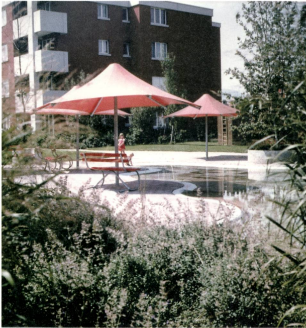
Abb. 6: Wasserbecken für Kleinkinder mit grossen Sonnenschirmen, Foto: vermutlich Dieter Kienast, um 1975.

wickelt hatte. Einzelne Komponenten wie das Wegnetz, die Erdhügel, die Bäume und die Eingangs- und Rasenflächen wurden in denselben Farben und im selben Stil auf die Umgebung Huebwiesen übertragen. Wie im bisherigen Entwurfsprozess sind die Farben einzelner Flächen bestimmten Nutzungen zugeordnet: Analog zu Blatt 1 steht Gelb für «Flächen für alle Altersstufen» und Lila für Bereiche, die für das Spiel von Kindern und Jugendlichen reserviert sind. Kienast plante auch hier eine ausgedehnte Rasenspielfläche und Privatgärten an den Rückseiten der Wohnblocks, allerdings ohne schützende Erdwälle. Die Bebauung Huebwiesen wird wie der Siedlungsteil Lindenstrasse zur Strasse mit Alleen oder Grünzonen abgeschlossen.