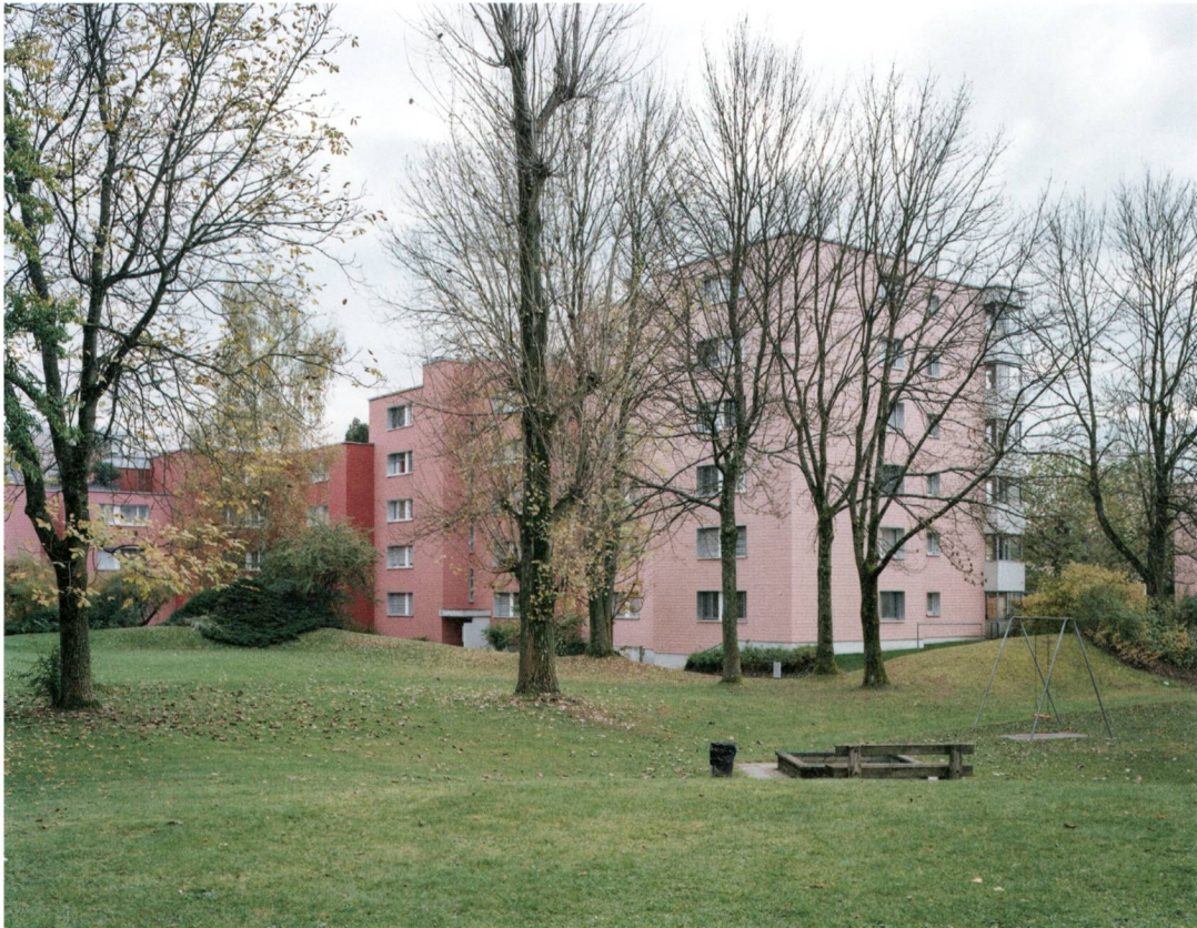
Abb. 8: Durch die sanft hügelige Topografie entsteht ansatzweise eine differenzierte Landschaft zwischen den sich wiederholenden Wohnblöcken. Darin eingebettet sind immer wieder Spielgeräte und Sitzplätze.

mit kurzen Verbindungswegen. Die Wege sind relativ breit und eignen sich daher für Kinder als Spielflächen zum Roller- und Radfahren, ohne die Erwachsenen in ihrer Bewegungsfreiheit als Fussgänger einzuschränken. Durch die beidseitig offenen Hauseingänge mit Rampen neben allen Treppen können die Kinder durch die einzelnen Wohnblöcke hindurchfahren und -laufen.