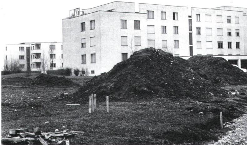
Abb. 2: Die Siedlung wurde auf freiem Feld errichtet und schloss an einen bestehenden Wohnkomplex an. Im Gelände lagerte der Aushub, der später für die Bodenmodellierung der Umgebungsgestaltung verwendet werden sollte. Foto: 1972.

Der Aushub wurde für die Gestaltung einer leicht hügeligen Topografie verwendet (vgl. Abb. 8, S. 79).