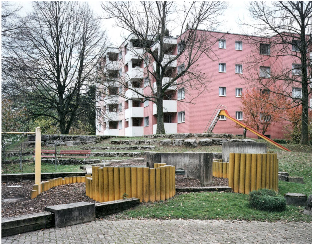
Abb. 7: Spielplatz im Aussenraum der Wohnsiedlung in Niederhasli vor der Renovierung 2009.

kleine Gartenplätze, die sie selbst gestalten können; die übrigen Wohnungen haben Balkone. Solche Privatbereiche mit einer Fläche von 10 bis 15 Quadratmetern waren damals in Siedlungen mit mehrstöckigen Wohnblocks ungewöhnlich. Individuelle Gartensitzplätze mit Kleingärten waren eher in Einfamilienhaussiedlungen, den sogenannten Teppichsiedlungen, verbreitet. Privatgärten in einer Wohnsiedlung waren in den Sechzigerjahren noch die Ausnahme.