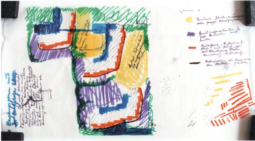
Abb. 3: Dieter Kienast, Blatt 1, Skizze zur Umgebung Überbauung Lindenstrasse. Flächen- und Funktionsverteilung mit Legende. Wie alle folgenden Blätter nicht datiert, entstanden Februar/März 1972.