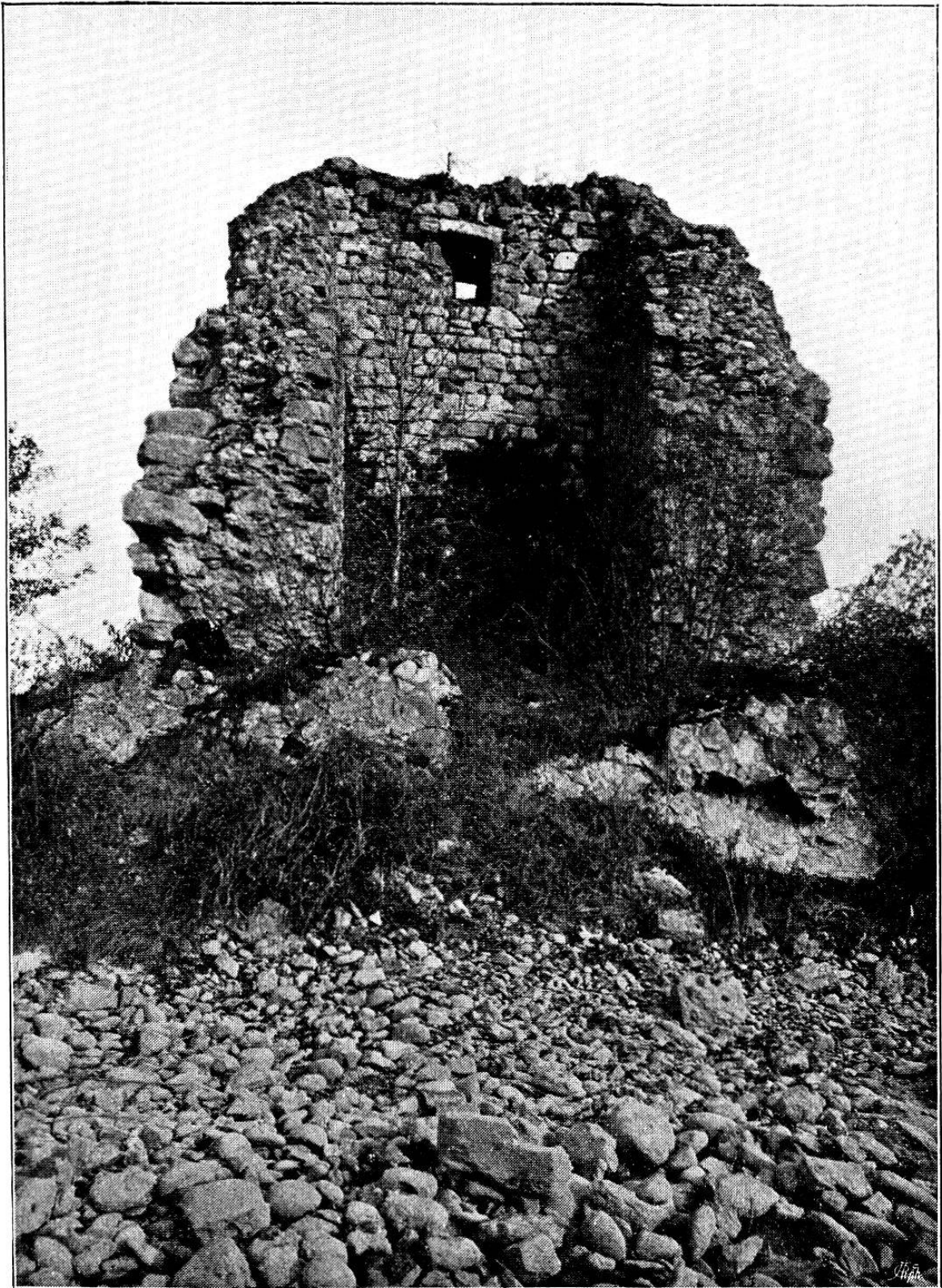
Freudenau von der Aare aus.