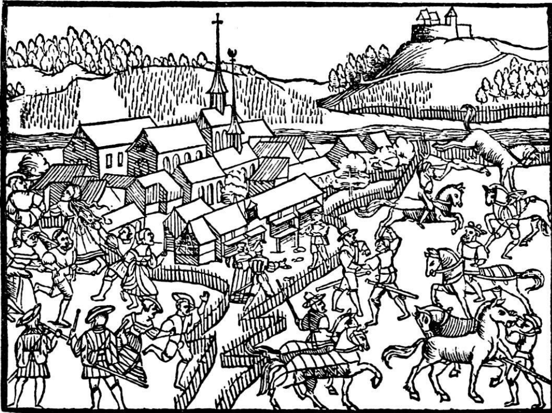
Zurzach nach Stumpf (1548).

Angeichts der ganzen wirtschaftlichen Bedeutung der Zurzacher Messen wird man sich nun sicher fragen, wie es denn eigentlich in Zurzach selbst aussah, wie das Wirtschaftsleben des Ortes beschaffen war? Man wird sich dazu jedoch besonders fragen, wieso angesichts eines der-