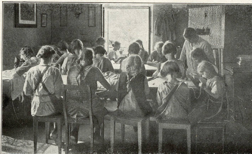
Im Arbeitszimmer der Mädchen, das viel zu klein ist

Unsere Anstaltsschule kann sich mit Normal-schulen nicht mehr messen. Es fehlt die Gedächtnisbildung der Neueintretenden, mangelt an gesundem Ehrgeiz, gebricht am psychischen Vermögen. Wohl leistet die glückliche Gruppe der bloß im Verhalten Geschädigten in der Schule so viel wie Normalschüler; aber ihre Zahl ist eben zu