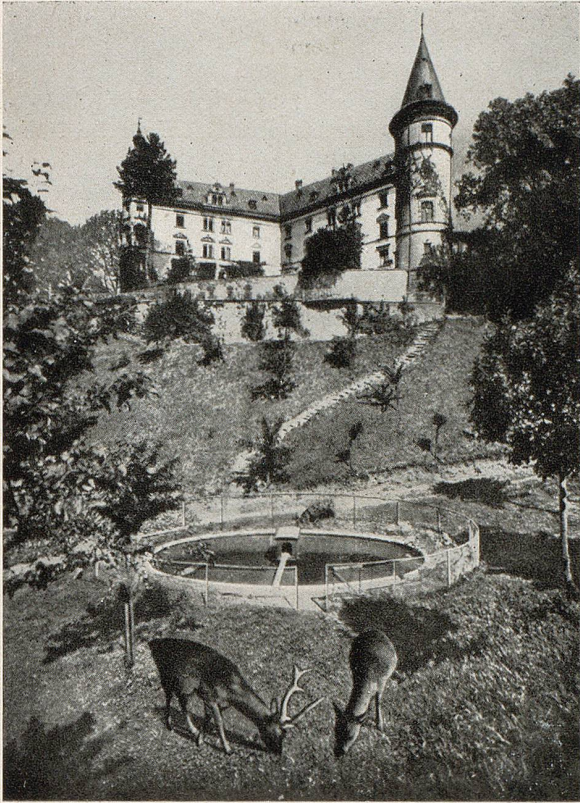
Kuranstalt Schloss Steinegg.

über Aufschluss und wendet sich darum dem geräumigen Dorfwirtshaus im Unterdorf zu, dessen Taufname «zur Sonne» das Charakteristikum des Odems ist, der durch seine gastlichen Räume weht. Durch breite, niedrige Fenster flitzen die letzten Abendstrahlen um die warme Holztäfelung und den heimeligen Kachelofen, dessen Nischen wohl von allerlei Einfällen des Tages zu erzählen wüsten. Schalkig grinsen die grauen Ecklein in die heimelige Wirtsstube, in der sich der freundliche Gastgeber rasch zu mir setzt und sich mit mir vertraulich abgibt. Er ist Hüttwilens echtes Dorfkind, kennt dessen Vergangenheit nicht minder als die Gegenwart, und wenn er mir aus dessen, wenn auch armen Geschichte erzählt, wird sein Herz warm wie das des Jünglings, der in sich die erste Liebe spürt. Und er setzt mir einen perlenden Schoppen von seinem eigenen Hausgewächs vor, das immer noch Zeugnis ablegen muss vom einstigen Ruhm der Hüttwiler Rebenhänge, die noch vor Menschengedenken über 200 Jucharten umspannten, heute aber auf den hundertsten Teil zusammengeschrumpft sind und sich nur noch der Gunst des Sonnenwirts erfreuen. Der Gast aber, der bei ihm Einkehr hält, weiss ihm Dank für seine Anhänglichkeit an anerkannte, einstens führende Tradition. Hier in diesem Dorfwirtshaus mit seiner alten Natur ist man gegen alle Verfolgung der Stadt, gegen ihre muffige Luft, gegen ihre schwüle Abenteuerlust gefeit;