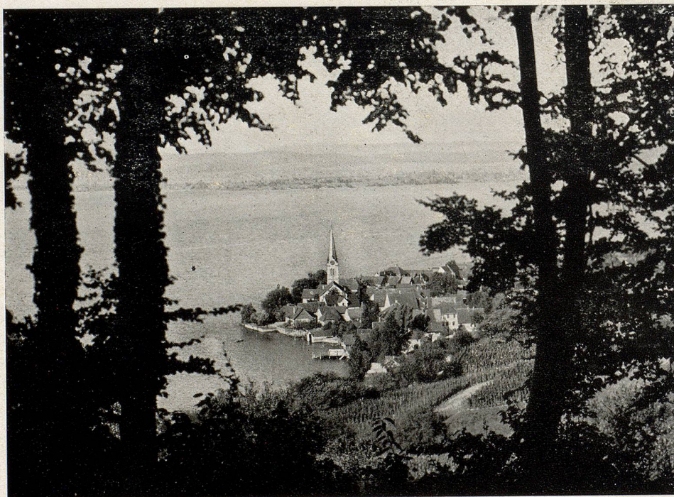
Das idyllische Berlingen.

Es weist heute schon den Charakter der Zwiefältigkeit auf, ist zur Hälfte das alte freundliche Nest geblieben, halb aber ist auf