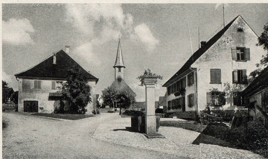
Kirchplatz von Hüttwilen.

Ein Herbsttag, der mich ins gastliche Hüttwilertälchen führte, hat mir unverwischbare Eindrücke eingegraben. Klar, von allem Sommerdunst der Ferne abgerückt, lag die kleine, stille Welt um das scharf in Ober- und Unterdorf zergliederte Hüttwilen. Der verbleichende Sonneglast eines warmen Septembertages senkte