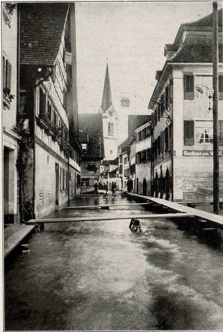
Berlingen in Wassernot.

In Berlingen wohnt ein derber Volksschlag. Sorgsam hütet er heute noch die Sitten der Väter. Aber gerade die Liebe zum Altväterischen macht ihn sympathisch und lässt manch harten Auswuchs am Stamme dieses naturwahren Baumes übersehen. Mann und Frau, Jüngling und Tochter teilen sich in diese Urwüchsigkeit. Sie bilden als Ganzes «etwas für sich». Da hat der Lippenstift noch keine Heimstatt und nur die der Natur abgelassene Bodenständigkeit herrscht. Der «Hof der Hortense» auf dem nahen Arenenberg hatte keinen Einfluss auf die Sitten der Berlinger ausgeübt, und darum ist's im Verkehr mit den Leuten oft, als wäre man für einen Augenblick in die gute alte Zeit zurückversetzt und wären grosse Zeitepochen zurück überschlagen, zurück in die Tage der Napoleonisten, da sie sich am Untersee heimisch fühlten und in deren Kreis Napoleon III. seinen Putsch vorbereitete. Nirgends wird den modernen Neuerungen ein kritischerer Empfang bereitet als hier. Der Kampf um den Erwerb aus der fruchtbaren Scholle, aus des Sees reichen Schätzen ist der Leute angeborener Pflichtkreis, in den hinein nur wenige gelegentliche Dorffeste die Sonnenfülle über eine einsame Oase streuen. Ja, diese Dorffeste! Sie bedeuten dem Völklein mehr als die nationalen Feiertage, und es hatte die Antwort jenes Schülers auf die Frage, welches