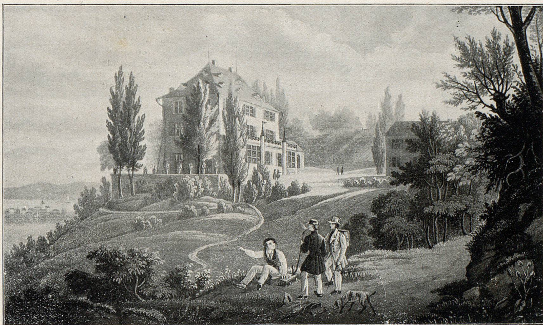
Schloss Arenenberg (ca. 1830).