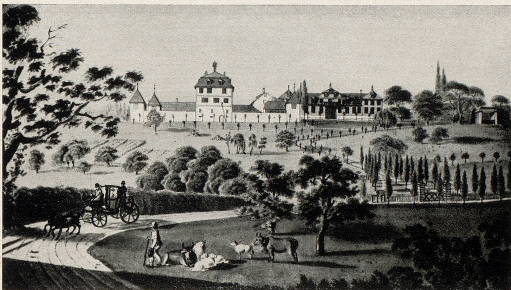
Schloss Wolfsberg (ca. 1830) nach einem zeitgenössischen Aquarell im Schloss Wolfsberg.