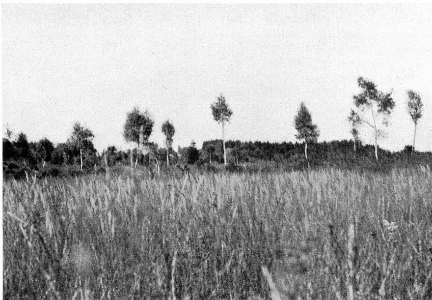
Im Vordergrunde Flachmoor, im Hintergrunde Hochmoor

Wird das Flachmoor sich selbst überlassen, das heißt werden die Riedgräser nicht als Streue geschnitten, so häufen sich die verkohlenden Pflanzenteile. Der Einfluß des kalkhaltigen Grundwassers nimmt mehr und mehr ab. Die Neutralisation der gebildeten Säuren wird zurückgedrängt; der Boden