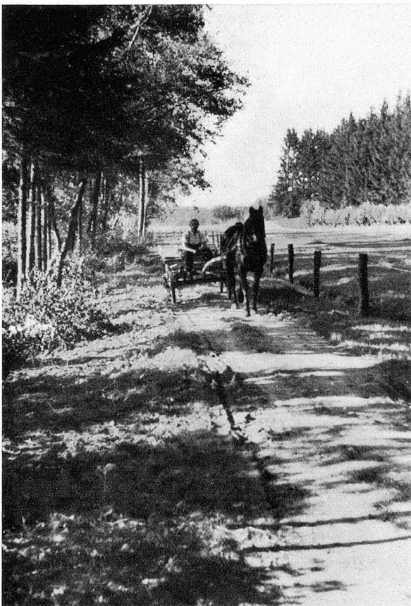
Einfahrt ins Moor von Norden