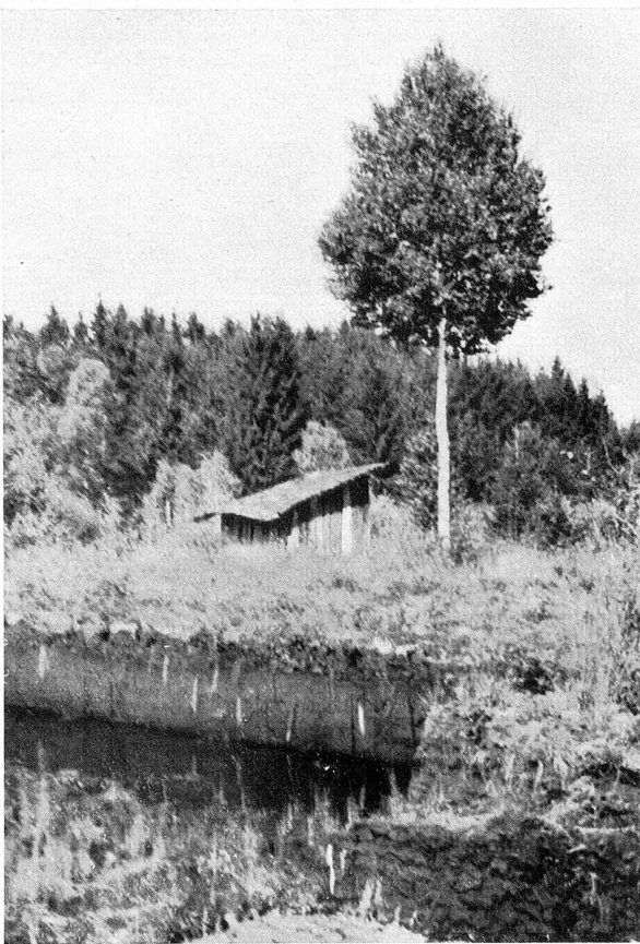
Ein verträumter Winkel

Über die Entstehung des Moores bestehen zwei verschiedene Auffassungen. Neuweiler 1 kam auf Grund von Torfuntersuchungen zur Ansicht, daß nach dem Rückzug des Rheingletschers sich ein Wald auf der Grundmoräne ansiedelte. «Ein Moor hatte die Fähigkeit, in denselben einzudringen und seine Versumpfung herbeizuführen.» Fräulein Josephy 2 hingegen glaubt, daß nach der Gletscherzeit ein See liegen blieb, der allmählich verlandete. Auf der Verlandungsdecke baute sich im weitern Verlaufe das Moor auf. Beide Arten der Moorbildung sind erwiesen; für das Hudelmoos hat wohl die erste Auffassung auf Grund von Tatsachen, die nicht weiter erörtert werden können, größere Berechtigung.