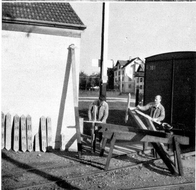
Oben: Eine Wanderkommission auf der Wegbegehung Unten: Die Wegweiser werden montiert

Franken und die Thurgauische Verkehrsvereinigung 3000 Franken. Von den 72 thurgauischen Munizipalgemeinden haben bis heute 53 Gemeinden die Vereinbarung über die Bestimmung und Markierung der Wanderwege sowie über die Finanzierung der Aktion unterzeichnet. Nur zwei Gemeinden (Stettfurt und Illighausen) glauben, abseits stehen zu dürfen.