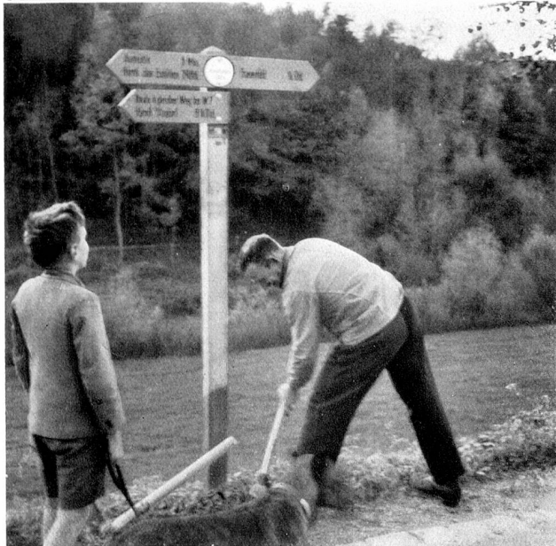
Oben: Die Wanderkommission markiert den Weg mit den Rhomben Unten: Die Wegweiser werden montiert

die Arbeit im Gelände aufgenommen und im Frühling 1937 konnten die ersten Wanderwege markiert werden. Gestützt auf das generelle Projekt wird Weg um Weg begangen. Die Kommission wird bei der Wegbestimmung beraten durch Delegationen der Gemeindebehörden und durch Wanderkundige. Bei der Wegbestimmung gilt als Grundsatz, daß der Wanderweg wo immer möglich die Autostraßen meidet. Öffentliche Fuß- und Flurwege, Gemeindesträßchen mit schwachem Fuhrwerkverkehr eignen sich am besten zum Wanderweg. Durch die bisher durchgeführten Wegbegehungen ist schon mancher vergessene Pfad, aber auch halb- und ganzverwachsene Fußwege sind neu erschlossen worden. Bei der Wegbegehung werden die Aufnahmen gemacht für den Standort der Wegzeichen; ferner werden die Karten nachgeführt. Im Sekretariat der Thurgauischen Verkehrsvereinigung werden die im Gelände