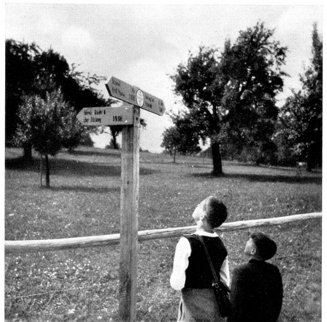
Junge Wanderer orientieren sich

Wenn im kommenden Frühling die eichenen Pfähle aufgestellt und die gelben Wegweisertafeln montiert sind, dann kann das Wandern beginnen. Aus dem Wanderbuch und der Karte können beliebige Routen gewählt und zusammengestellt werden. Der Wanderer wird auf sachliche Art und Weise in alle Details eingeweiht. Auf der gelb gestrichenen und schwarz beschrifteten Wegweisertafel ist oben das Nahziel (Standort des nächsten Wegweisers) und unten das Fernziel angegeben. Die Entfernung ist in Wegstunden vermerkt (Marschleistung eines Mannes mit einem zehnjährigen Knaben). Im weißen Kreis in der Mitte der Wegweisertafel ist der Standort und die Höhenquote