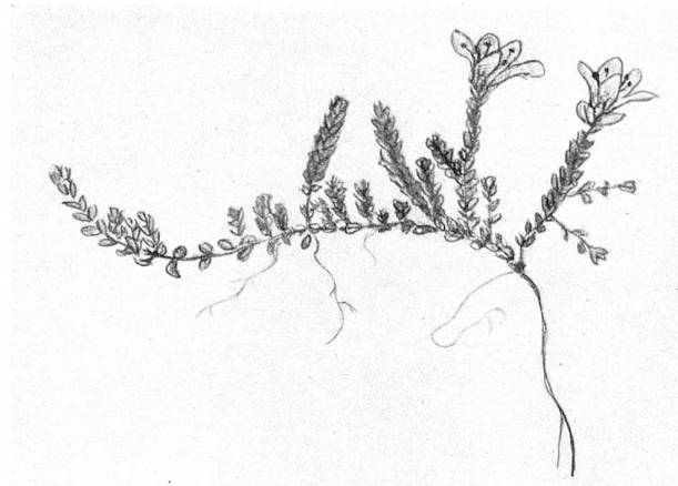
Saxifraga oppositifolia L. var. amphibia Sündermann Gegenblättriger Steinbrech. \frac{2}{3}

Samen zu reifen, ihre Art weiter zu verbreiten. Wie schnell welkt solch ein Strauß im Wasserglas, wenn er nicht schon auf dem Heimweg verdorrte. — Im Gegensatz zu diesem raschen Welken ist unauswisch-