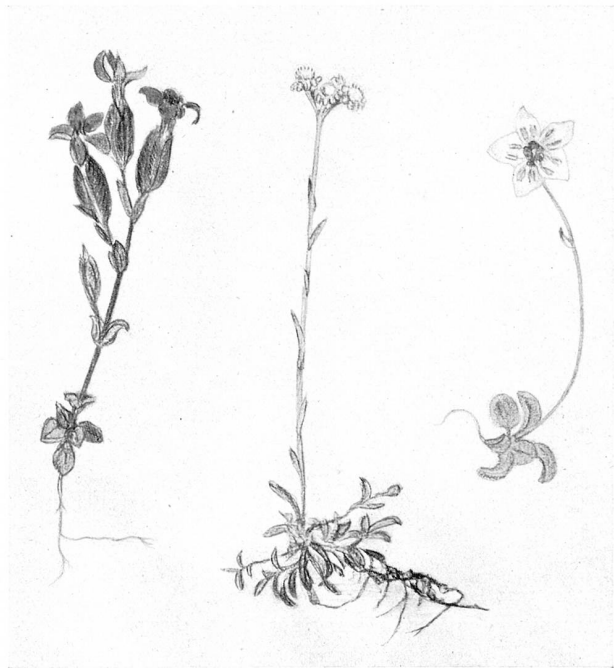
Antennaria dioeca (L.) Gärtner Katzenpfötchen 1/2

mehreren Sommern monatelang in einem Zelt auf dem Oberaargletscher, um den Bau und das verborgene Schaffen des Gletschers, sein Vor- und Zurückgehen, die Moränenbildung zu ergründen. Auch