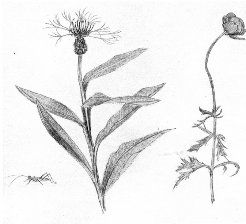
Centaurea montana L. Bergflockenblume \frac{1}{2}

Gerade die Thur, die mitten durch unsern Kanton strömt, bringt uns Thurgauern auch noch eine Hand