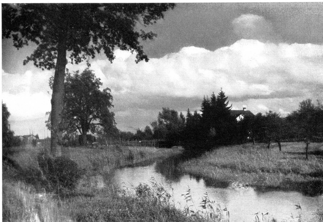
Die Aach bei Salmsach

All diese Straßen, außer der Hauptstraße mit ihrem regen Verkehr, sind in der Sommerszeit nicht allzu belebt. Wer nicht draußen auf den Äckern, in Wiese oder in Wald zu tun hat, verweilt am liebsten drunten am See, wo ein schöner, flacher Strandplatz mit ausgedehnter Badegelegenheit zur Erquickung einlädt. Während sich die Jungmannschaft wacker im nassen Elemente tummelt oder auf der Strand-