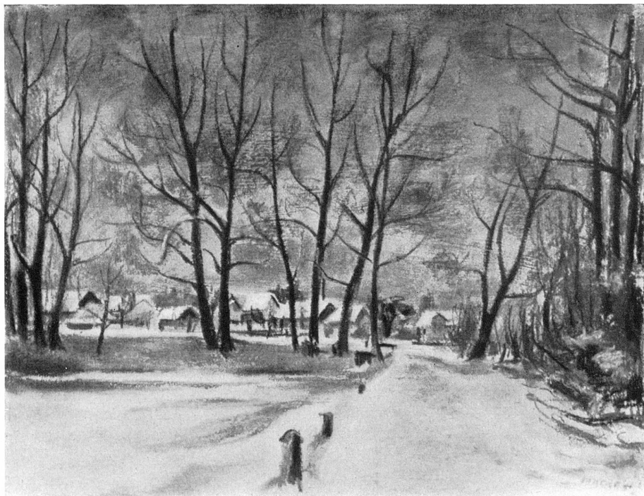
Winter am Weiher. Pastell