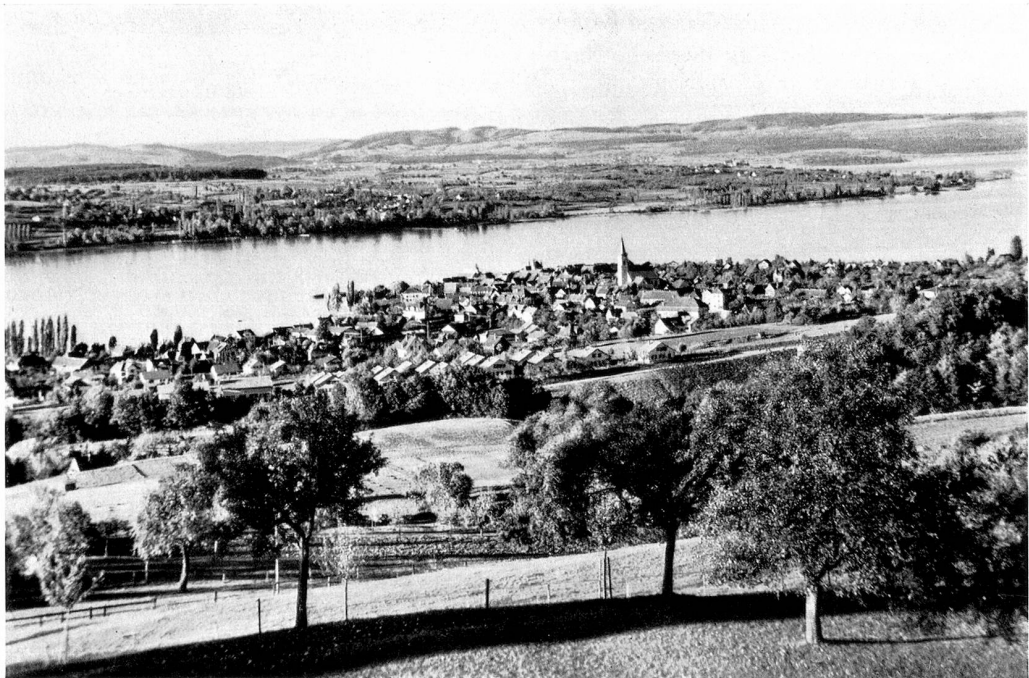
Gesamtansicht von Steckborn

Ist das nun das Bild von Steckborn? Ein rundes, schönes Bild, wie ich es zeichnen wollte? Kaum! Ich müßte eines Malers Farben haben, um einen Sonnenuntergang zu beschreiben oder des Sees Bläue, wenn sich darin die alten Türme von Steckborn spiegeln. Das Schönste und Liebste über die kleine Stadt wäre dann aber noch nicht ausgesagt. Es liegt in seiner Seele verborgen und nur wer ihr immer wieder in der Stille begegnet, wird sie verstehen. Aber das genügt schon, wenn sie nur alle Menschen zu Freunden hat, die Heimat zu ihr sagen dürfen.