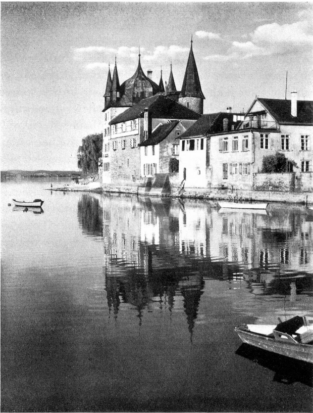
Das Schloß mit Museum von der Seeseite

Wenn Dichter ihre Heimat preisen, geraten sie leicht in den Verdacht, ihr Schönheiten zuzuschreiben, die ein Fremder an ihr nie entdecken kann. Der Lokalpatriotismus verleitet manchmal zu kleinen Übertreibungen, die gut gemeint sind und niemandem schaden.