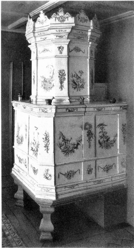
Düringer Ofen von 1791 im Haus der Apotheke

legendäre, große Geschichte: Bauern stoßen mit Pflug und Hacke immer wieder auf die Fundamente zerfallener Burgen und wer am Abhang ein Haus baut, stört die Ruhe tausendjähriger Grabstätten.