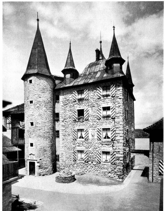
Der Turmhof

Wer eine Stadt mit so eigenem Gesichte und Gehaben kennen lernen will, muß um ihre Geschichte wissen. Nur dann wird er sie verstehen und lieben können, weil die Ereignisse vergangener Zeiten ihren Menschen und ihren Bauten das Gepräge gaben. Die Legende erzählt, Steckborn sei in ganz frühen Jahrhunderten groß und stolz vom See her an den Hang gebaut gewesen. Das ist wohl ein Märchen, aber ein schönes. Es leben darin mächtige Herren auf getürmten Burgen. Ihre schönen Frauen saßen in den Kemenaten oder ergingen sich auf den Zinnen, wenn sommers die Kornfelder der deutschen Höri reiften oder im Herbst die Trauben an den Hügeln blau wurden. Es gibt Zeugen für diese