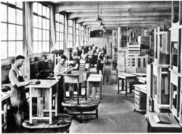
Teilansicht der Möbelfabrikation: Zusammenbau und Beizen

aus den kleinen Anfängen eine gutgehende Fabrik, in der rund 70 Mann ihre Beschäftigung fanden. Unter der Bezeichnung «A»-Maschinen kamen die ersten Gegauf-Hohlsaum-Nähmaschinen in den Handel und fanden allgemein höchste Anerkennung.