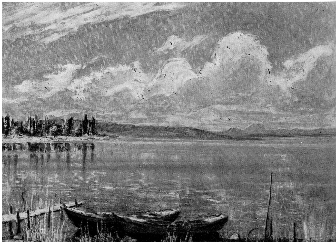
Die Bucht von Ermatingen Öl 1950