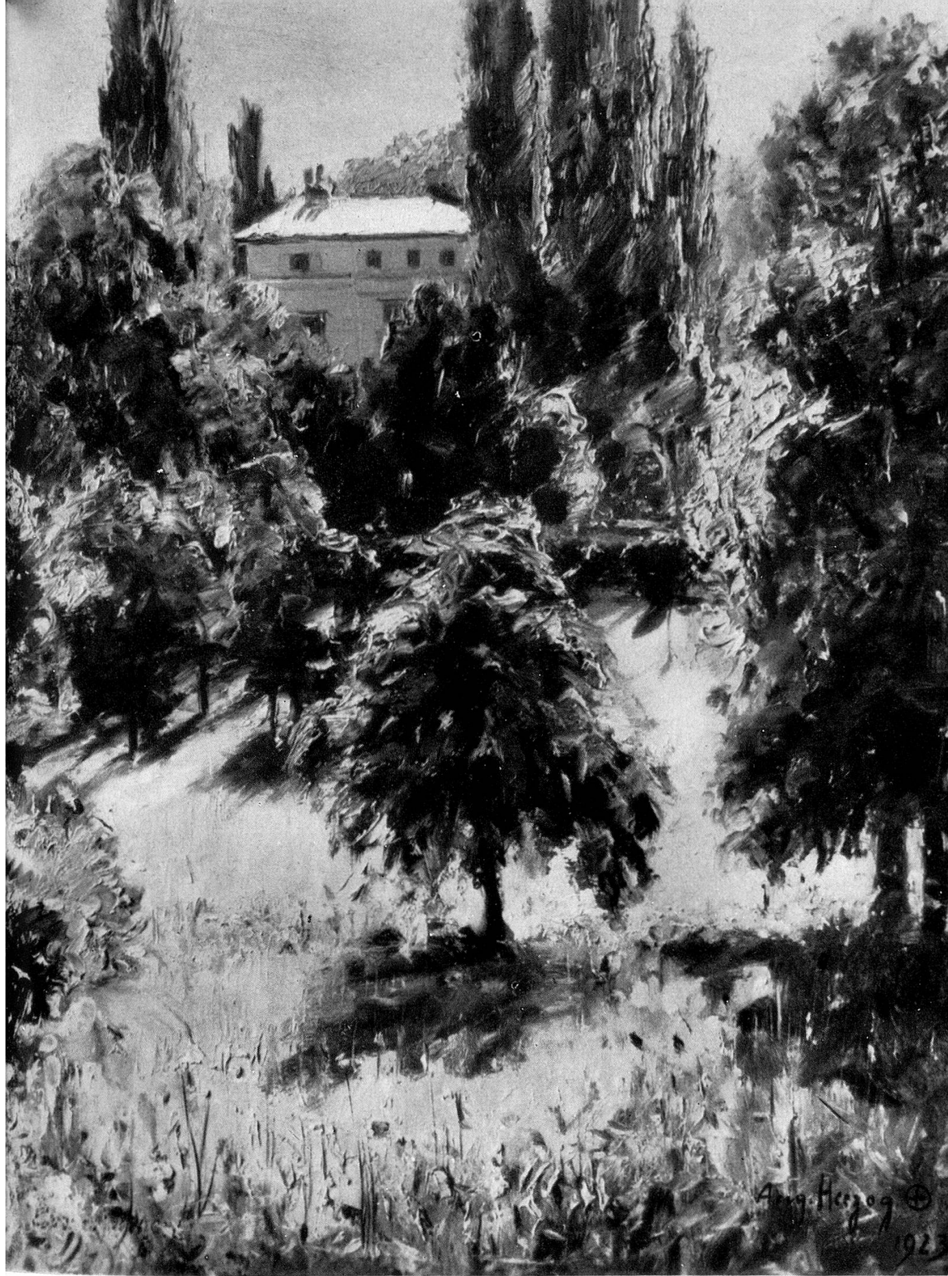
Gartenbild Öl 1923