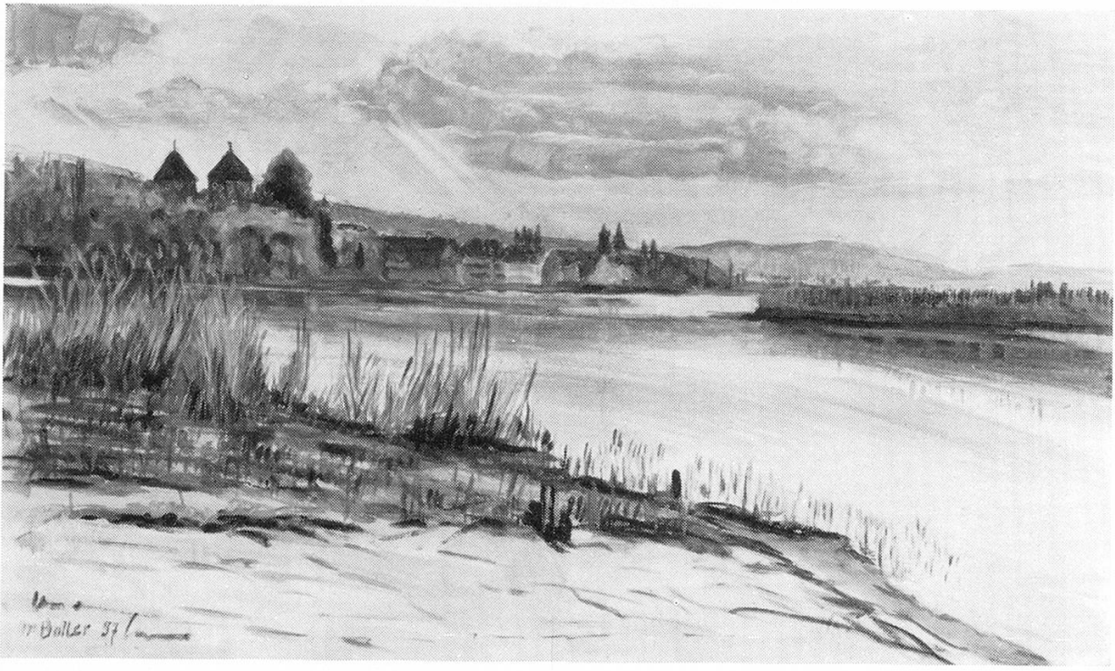
Rhein bei Gottlieben