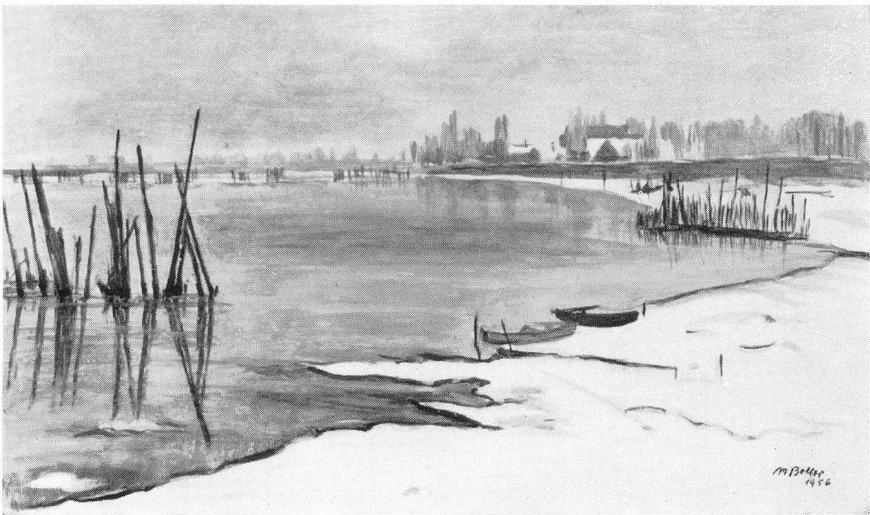
Winter bei Gottlieben