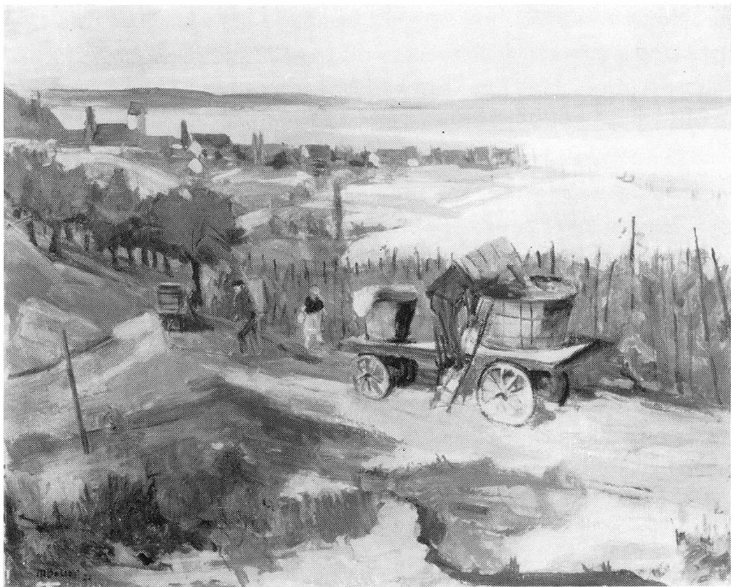
«Wimmet» in Ermatingen