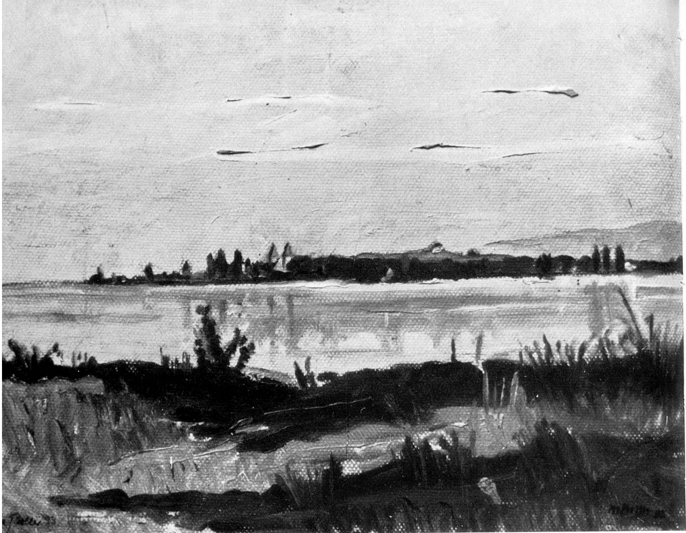
Ausblick von der Mettnau auf Reichenau