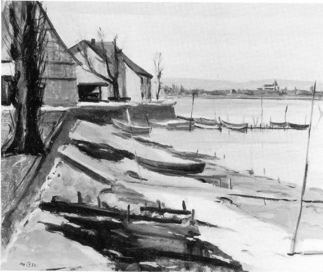
Märztag in Ermatingen