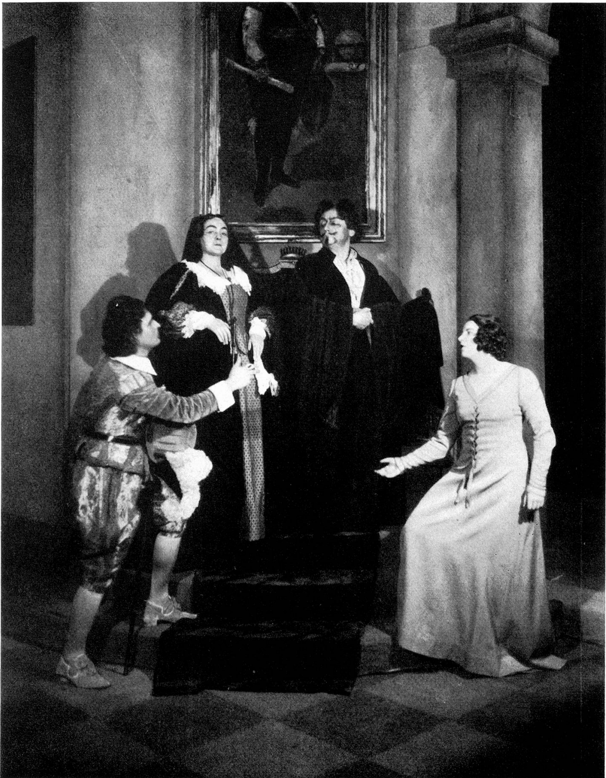
Letzter Aufzug der Oper Don Ranudo, aufgeführt am 3. Oktober 1930 durch die Sächsische Staatsoper in Dresden Gonzalo, der Geliebte Marias tritt, seiner Mohrenverkleidung entledigt, vor Don Ranudo und Olympia