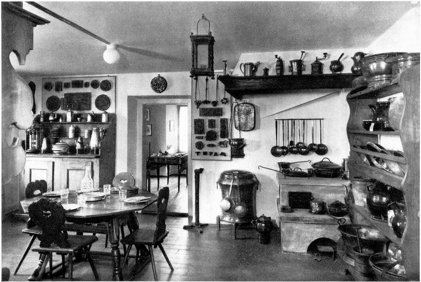
Raum 3: Alte Küche