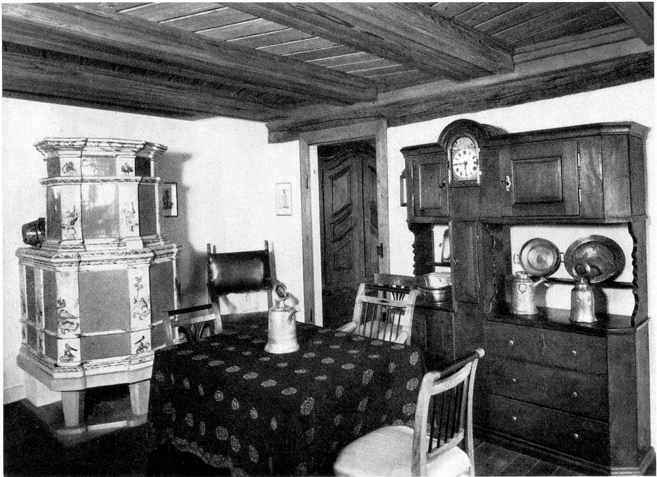
Raum 5: Bürgerliches Zimmer