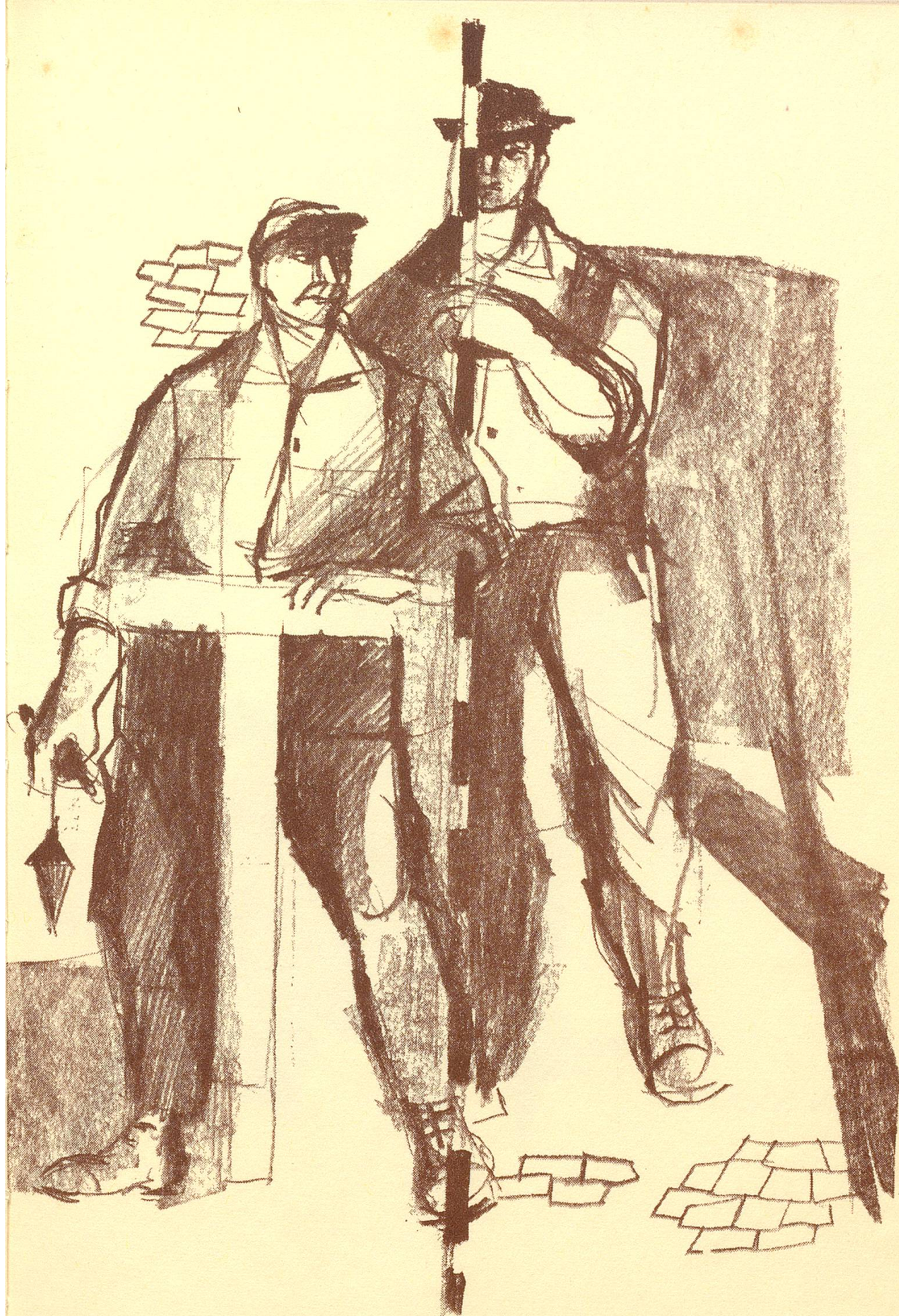
Cellere Frauenfeld baut Straßen