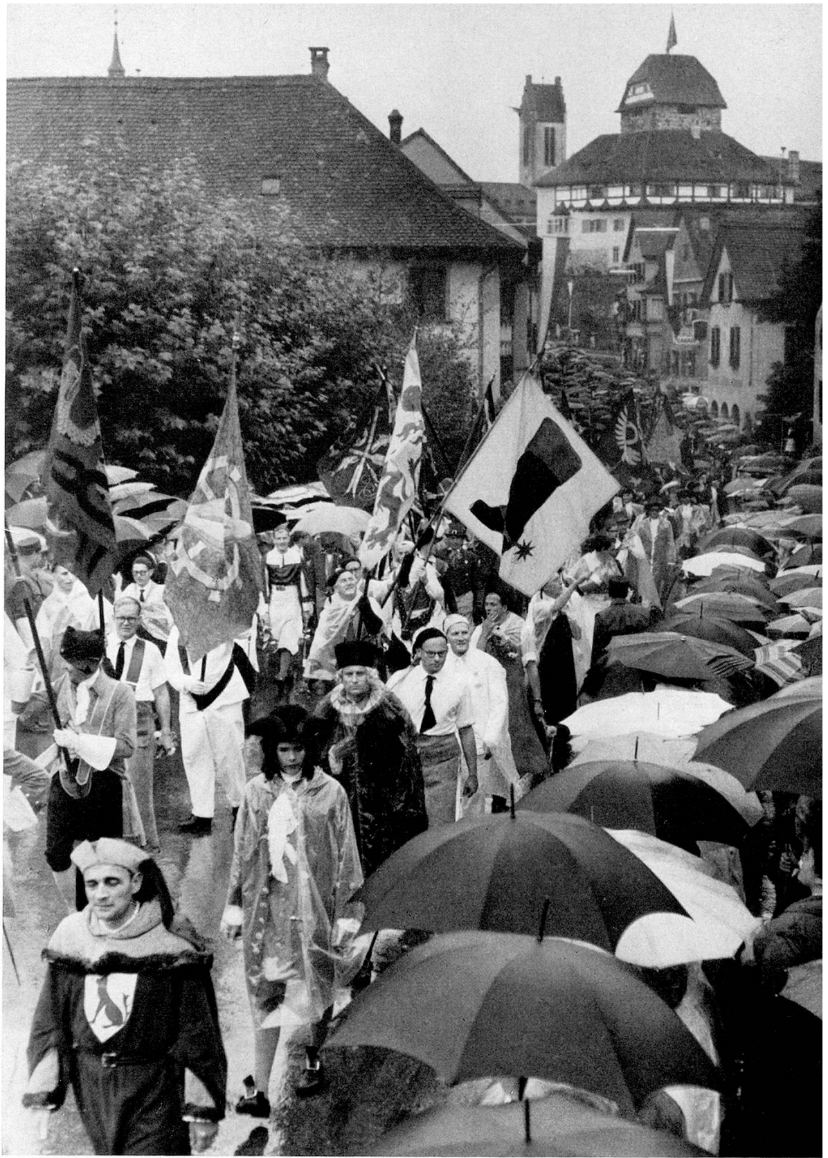
Die Zürcher Zünfte