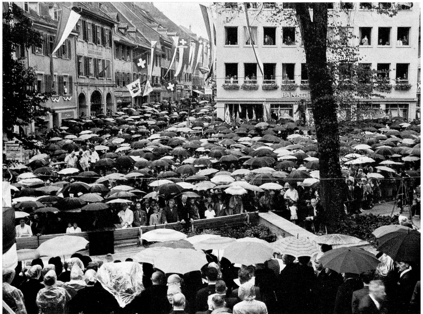
Das Volk unter Schirmen