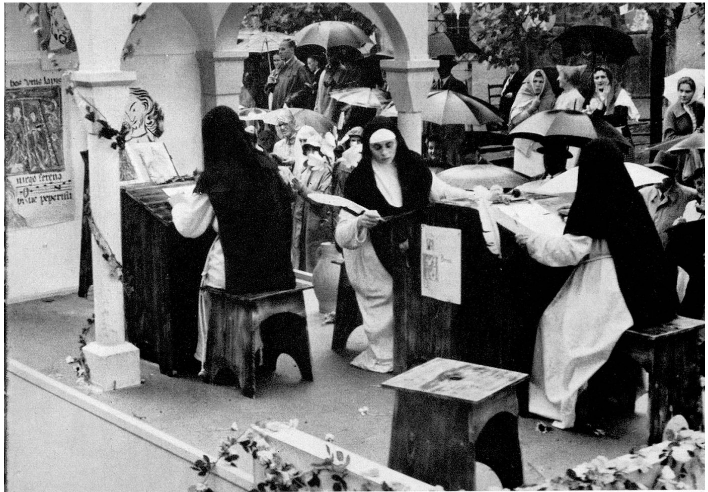
Die Dominikanerinnen von St. Katharinental