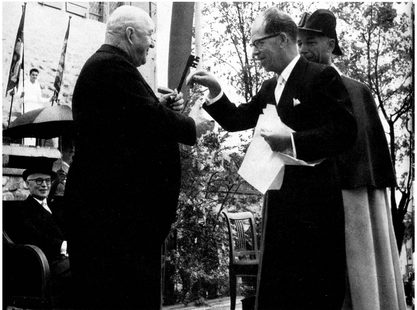
Übergabe des Schlüssels zum Schloß