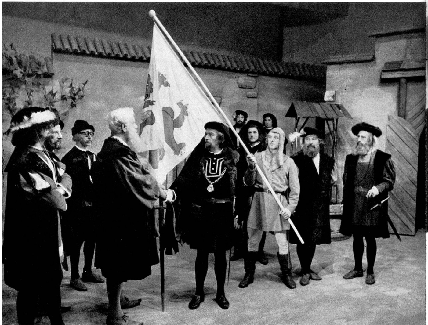
Der Bürgermeister von Zürich begrüßt den Schultheißen von Frauenfeld