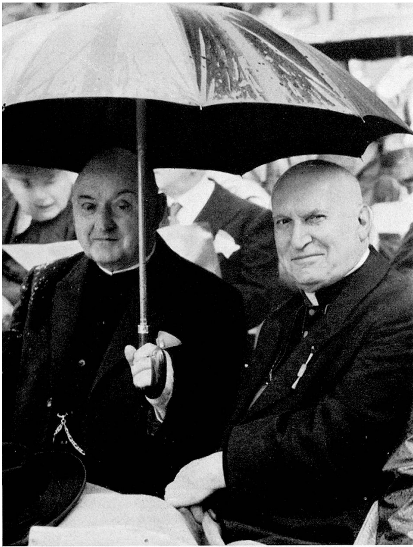
Bischof von Streng und Dekan Haag