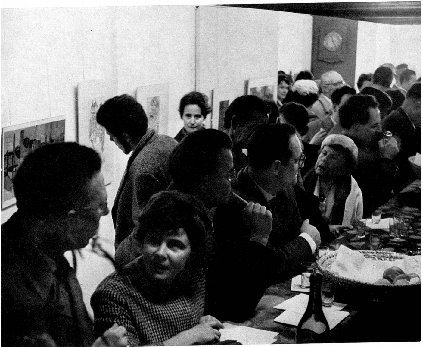
Nach der Vernissage im Gampiroß