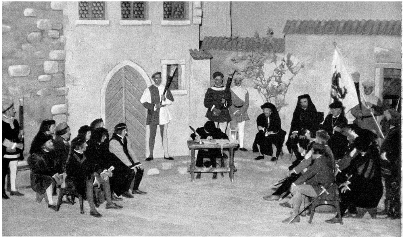
Verhandlungen der Stadtväter von Frauenfeld mit den Boten der sieben Orte