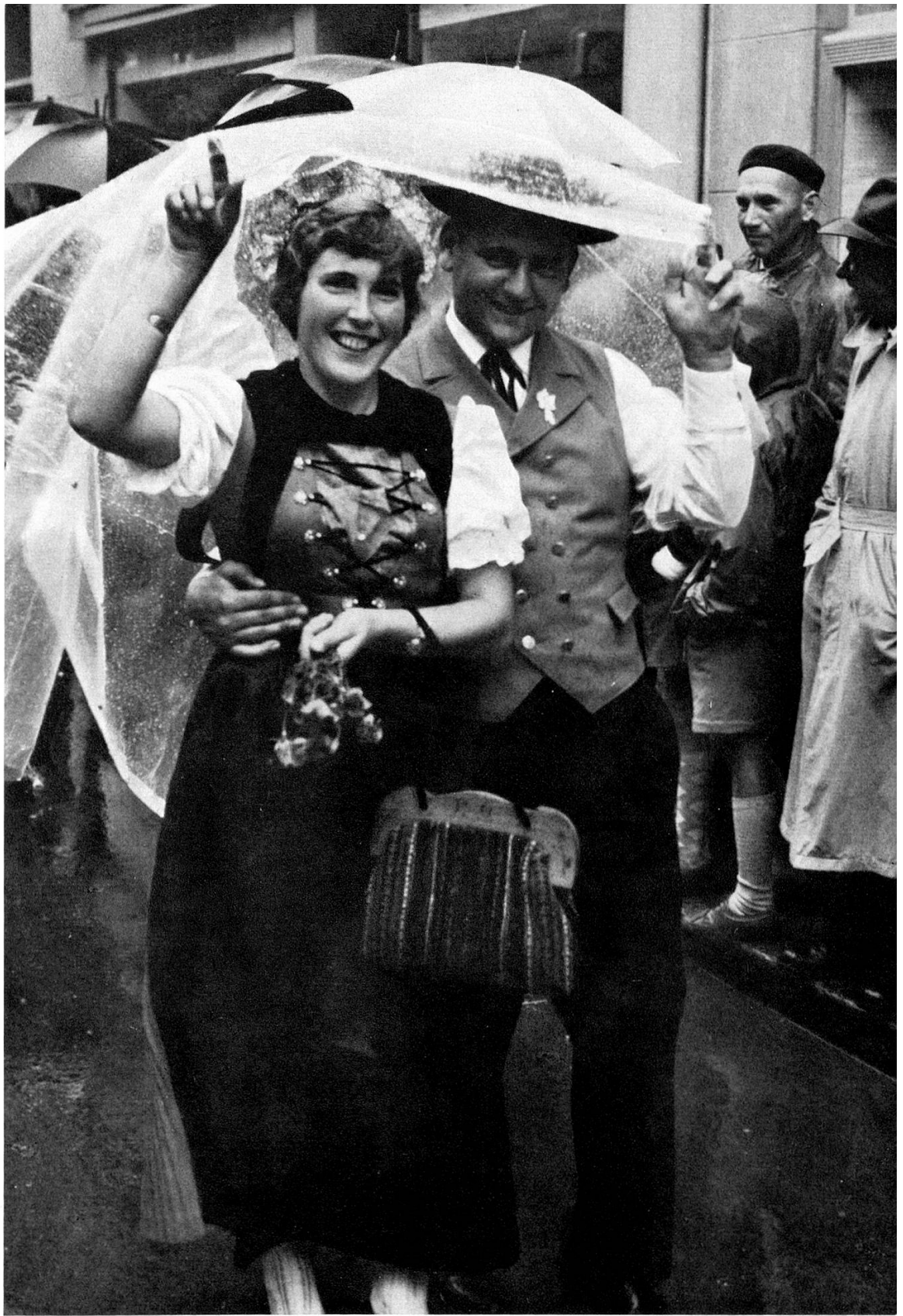
Ein Trachtenpaar aus Düdingen im deutschfreiburgischen Sensebezirk