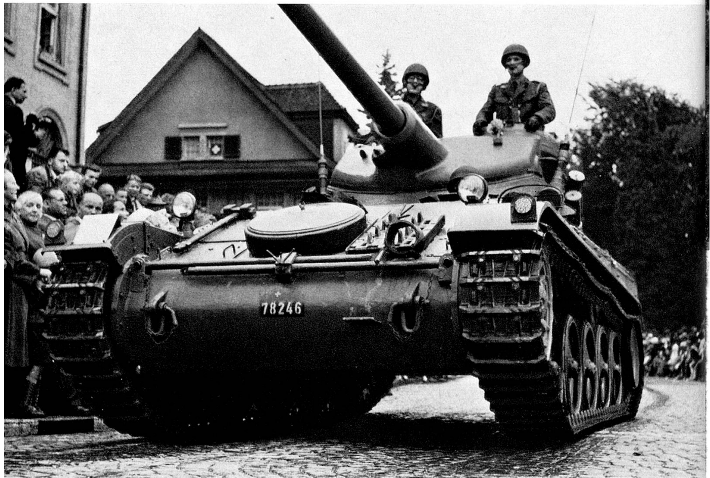
Die Panzer von heute