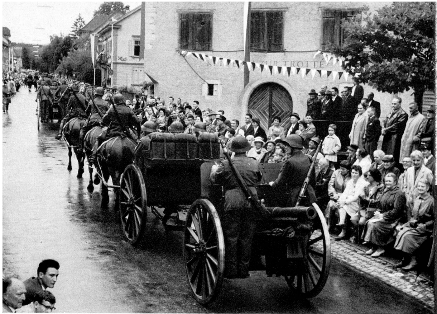
Feldartillerie im zweiten Weltkrieg