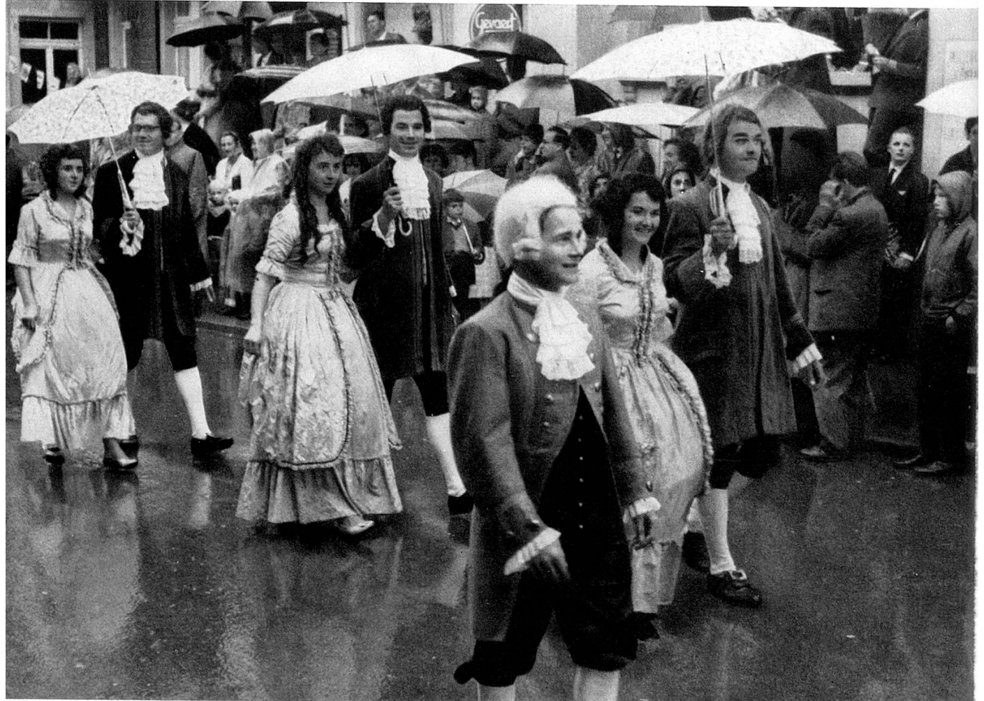
Das Gefolge aus Bischofszell