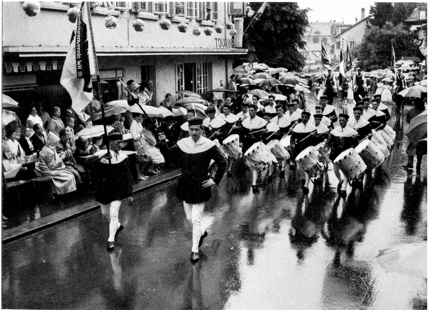
Der Festzug beginnt