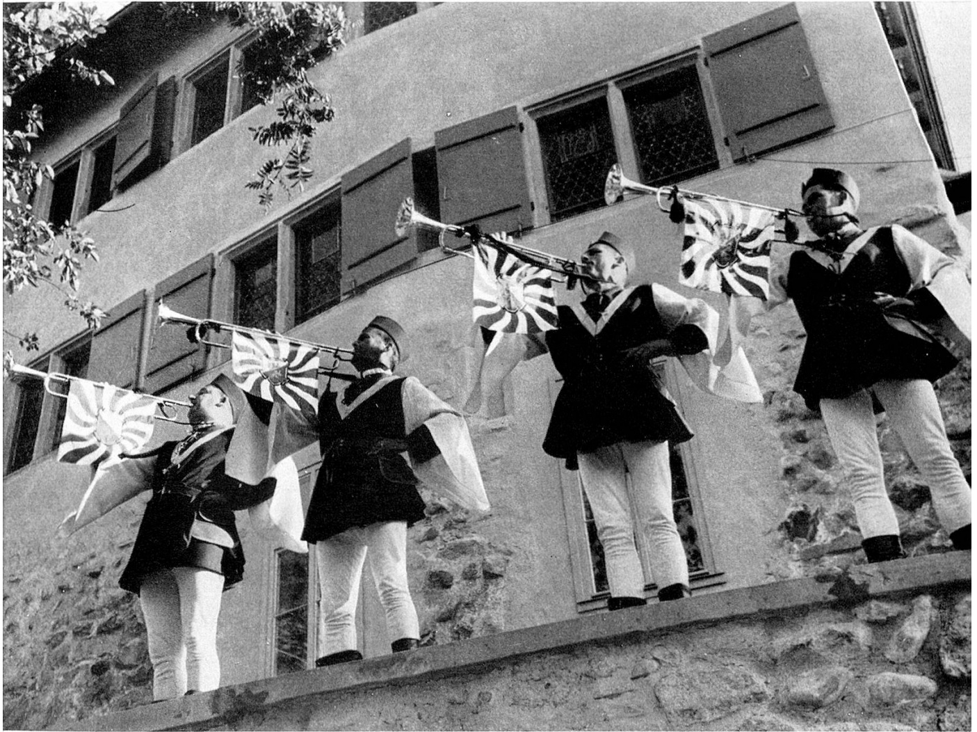
Mit Fanfaren wird das Fest eröffnet