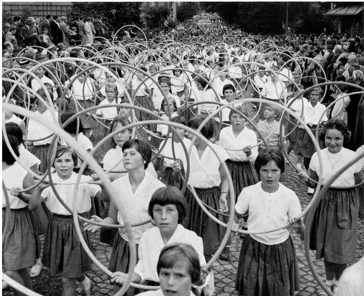
Kindergruppe mit Reifen