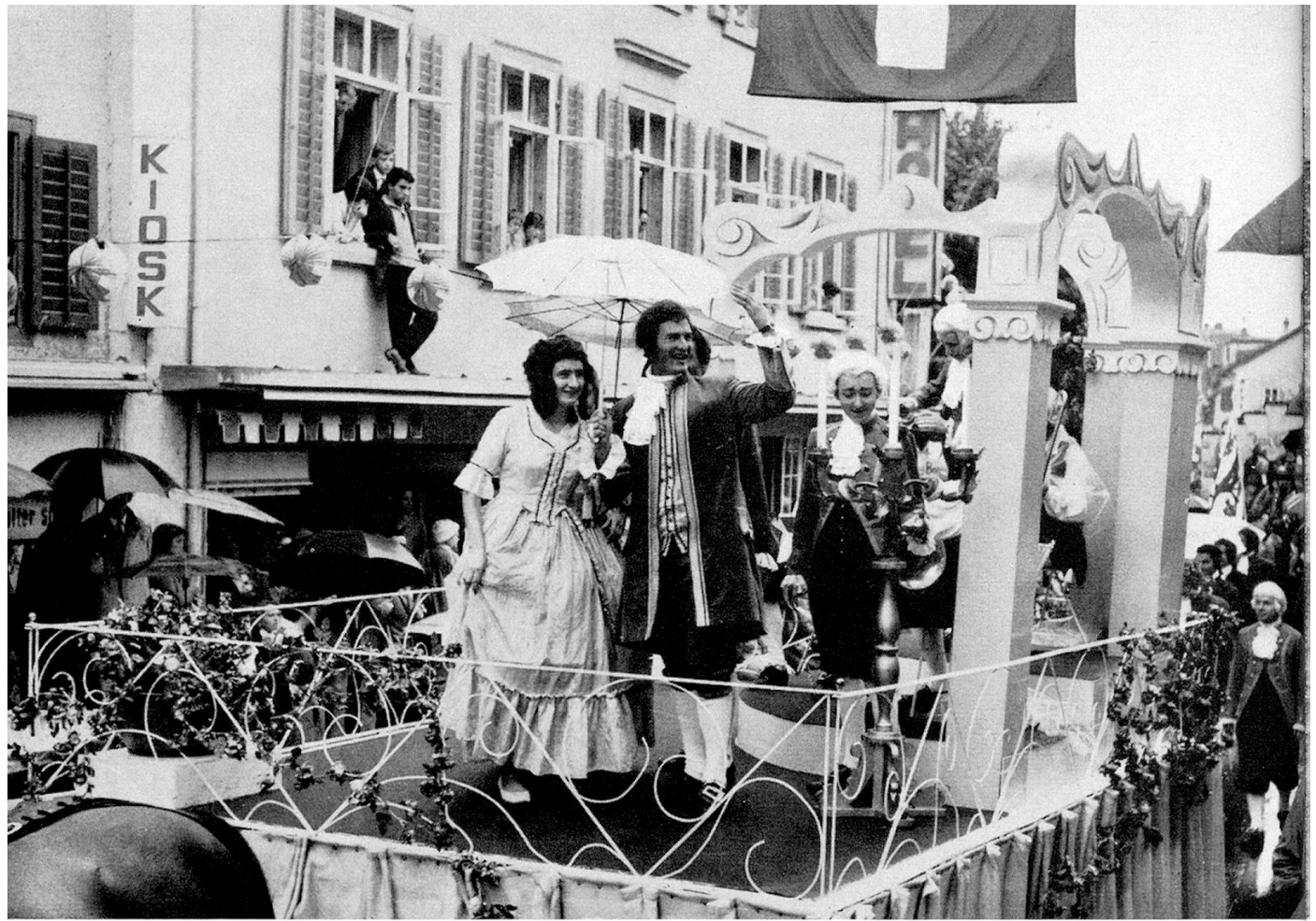
Das Bischofszeller «Collegium musicum»