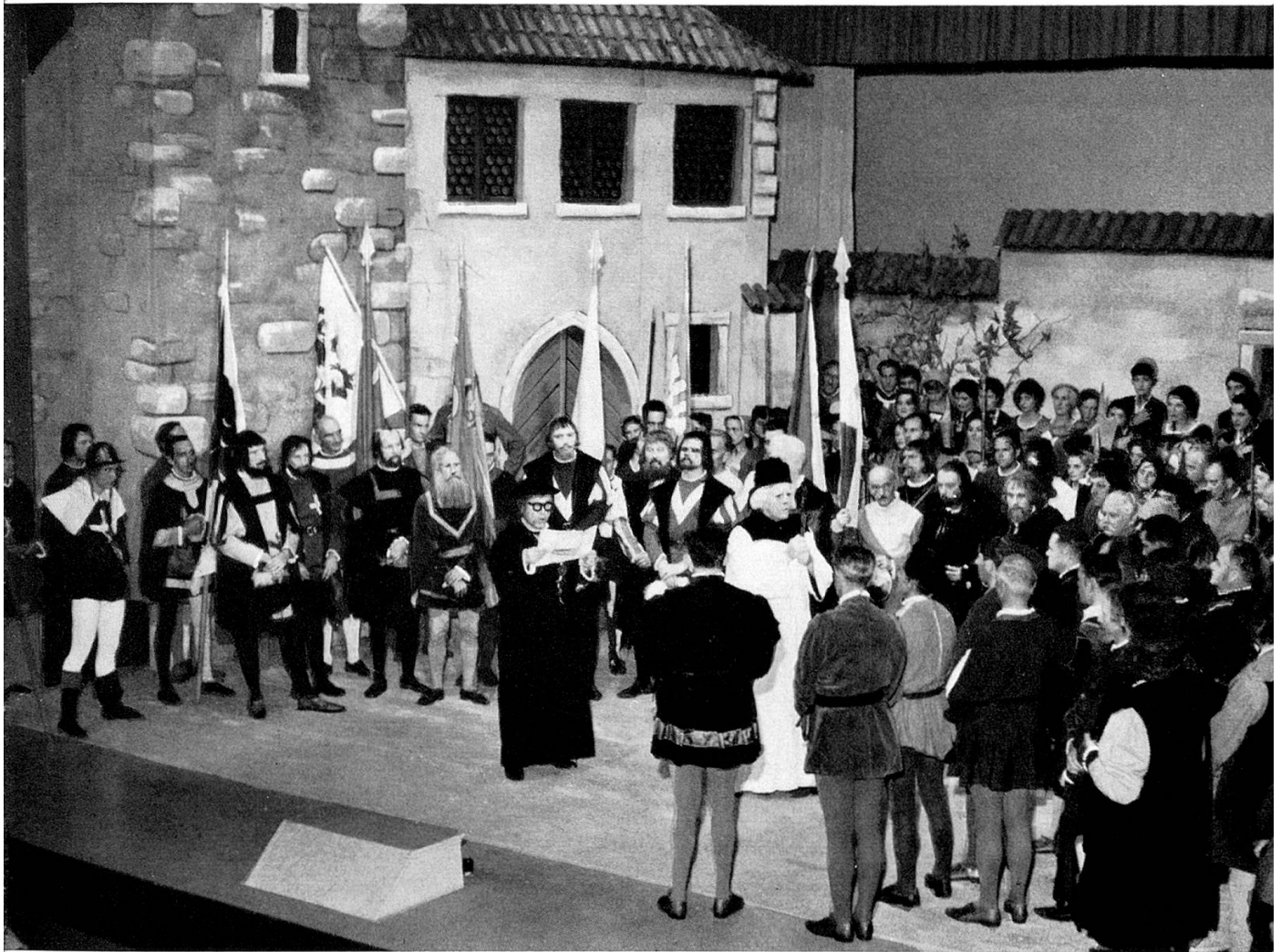
Schwur der thurgauischen Gerichtsherren