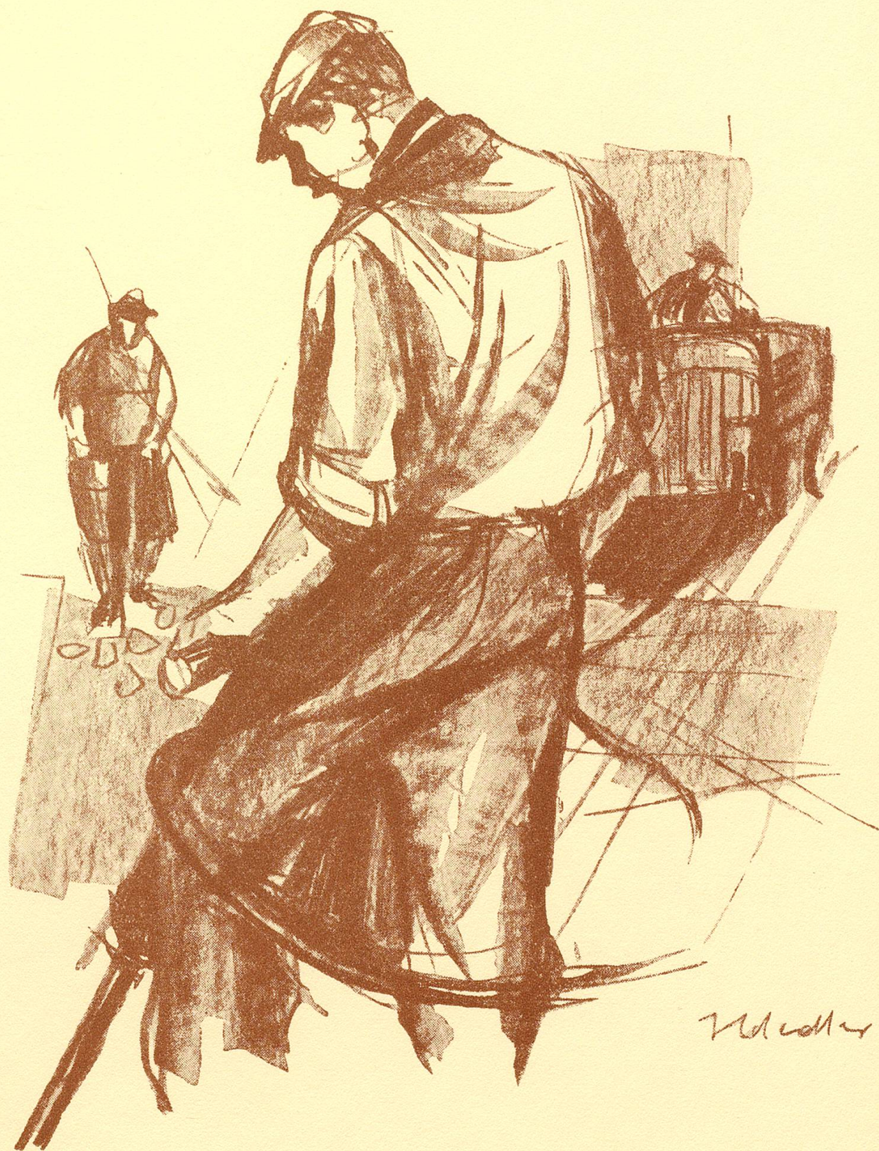
Egolf AG, Straßen- und Tiefbau, Weinfeldern