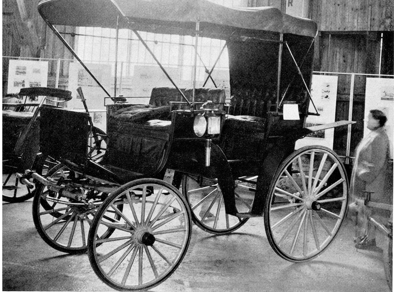
Jagdwagen im Hintergrund vis-à-vis