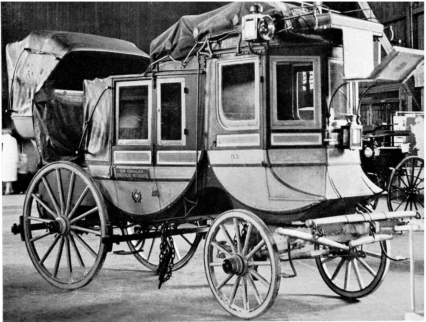
Coupé Landauer mit Bankette, achtplätzig, fünfspännig