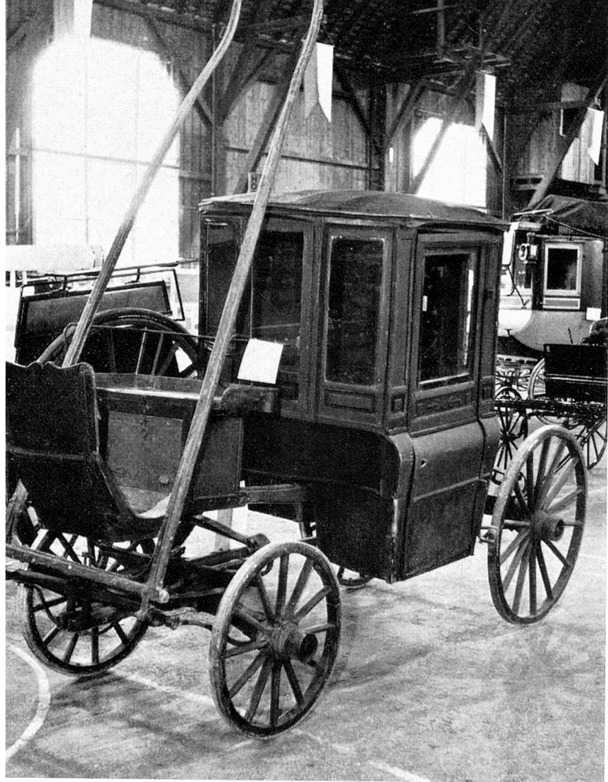
Char à Côté