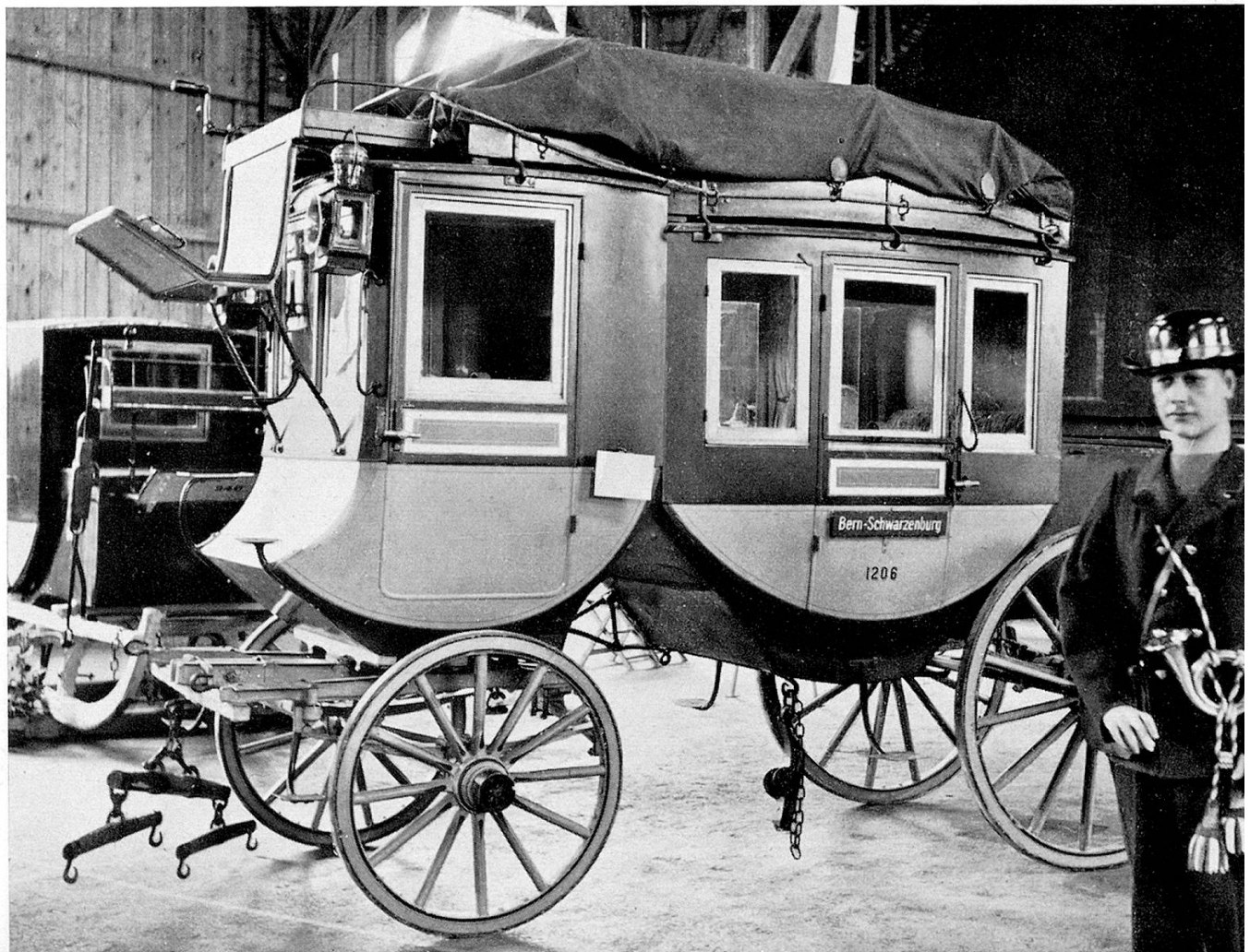
Post – Coupé-Berline, sechsplätzig