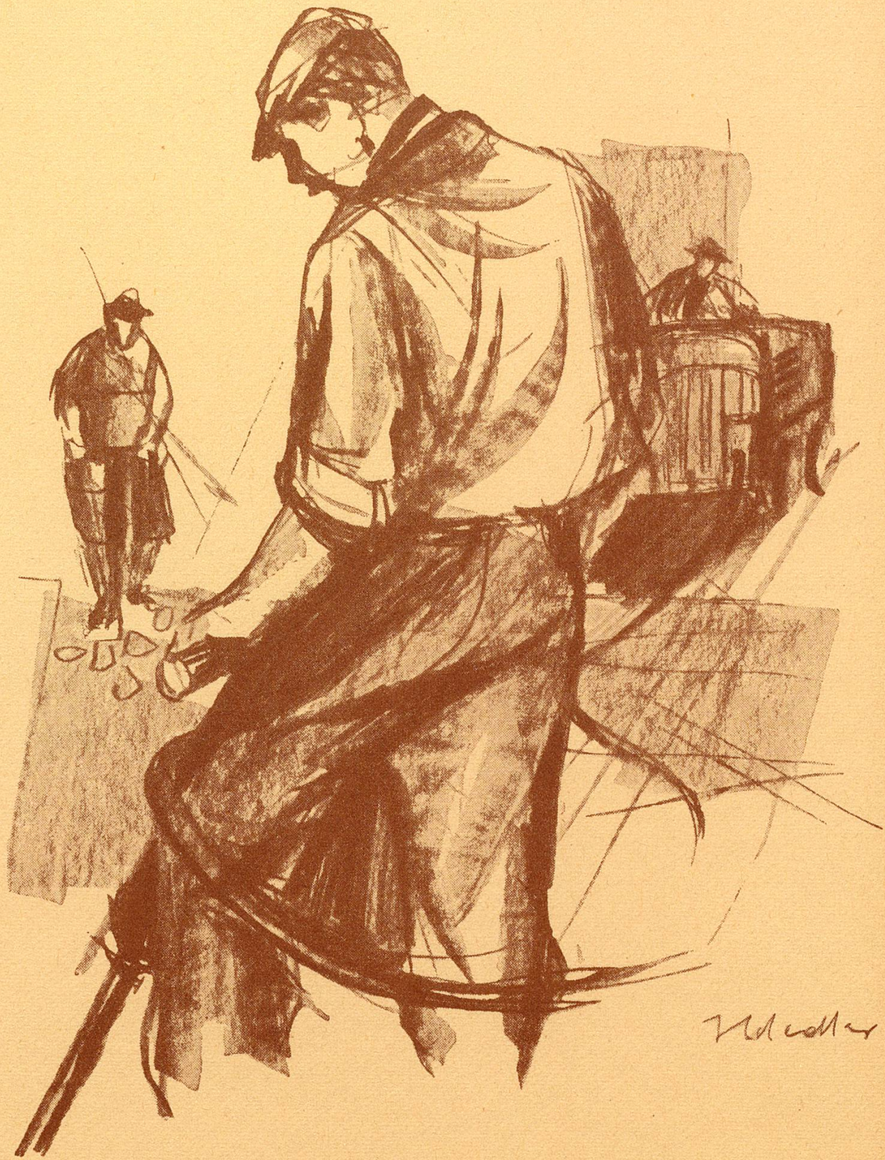
Egolf AG, Straßen- und Tiefbau, Weinfelden