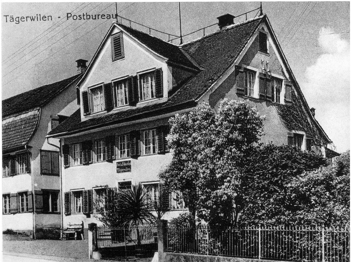
Tägerwilen. Alte Post, früher «Freihof», das Absteigequartier der Pferdepst Konstanz–Frauenfeld–Zürich. Hier wohnte Charles Sealsfield.