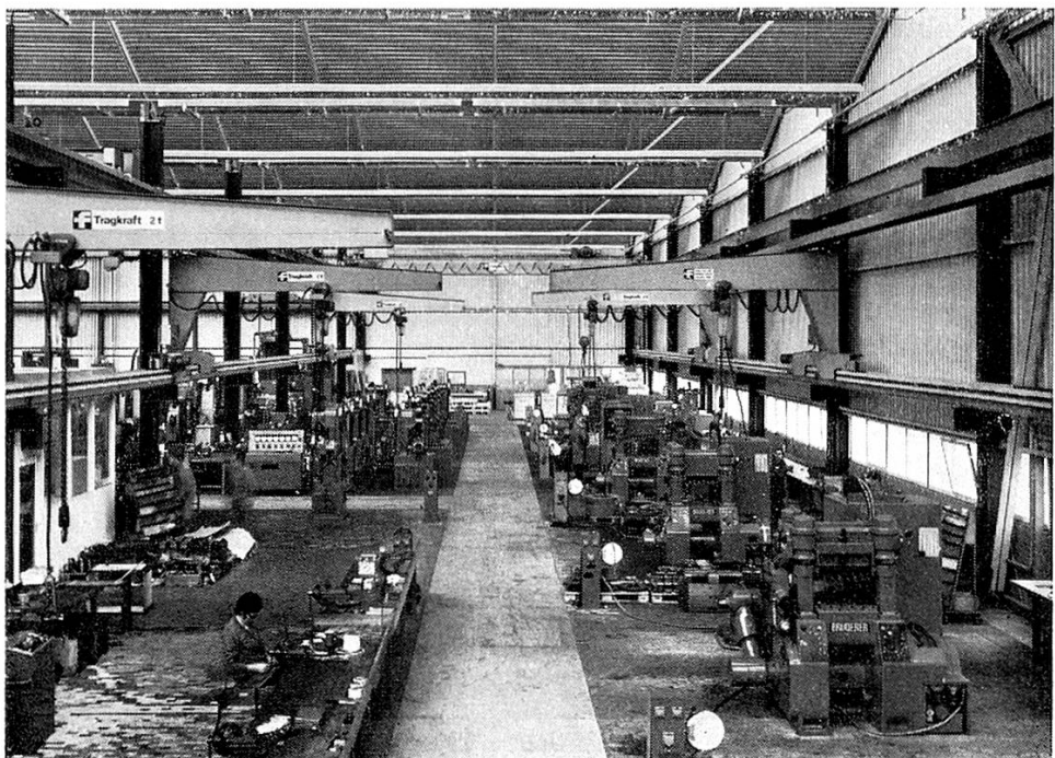
Blick in eine Werkhalle.