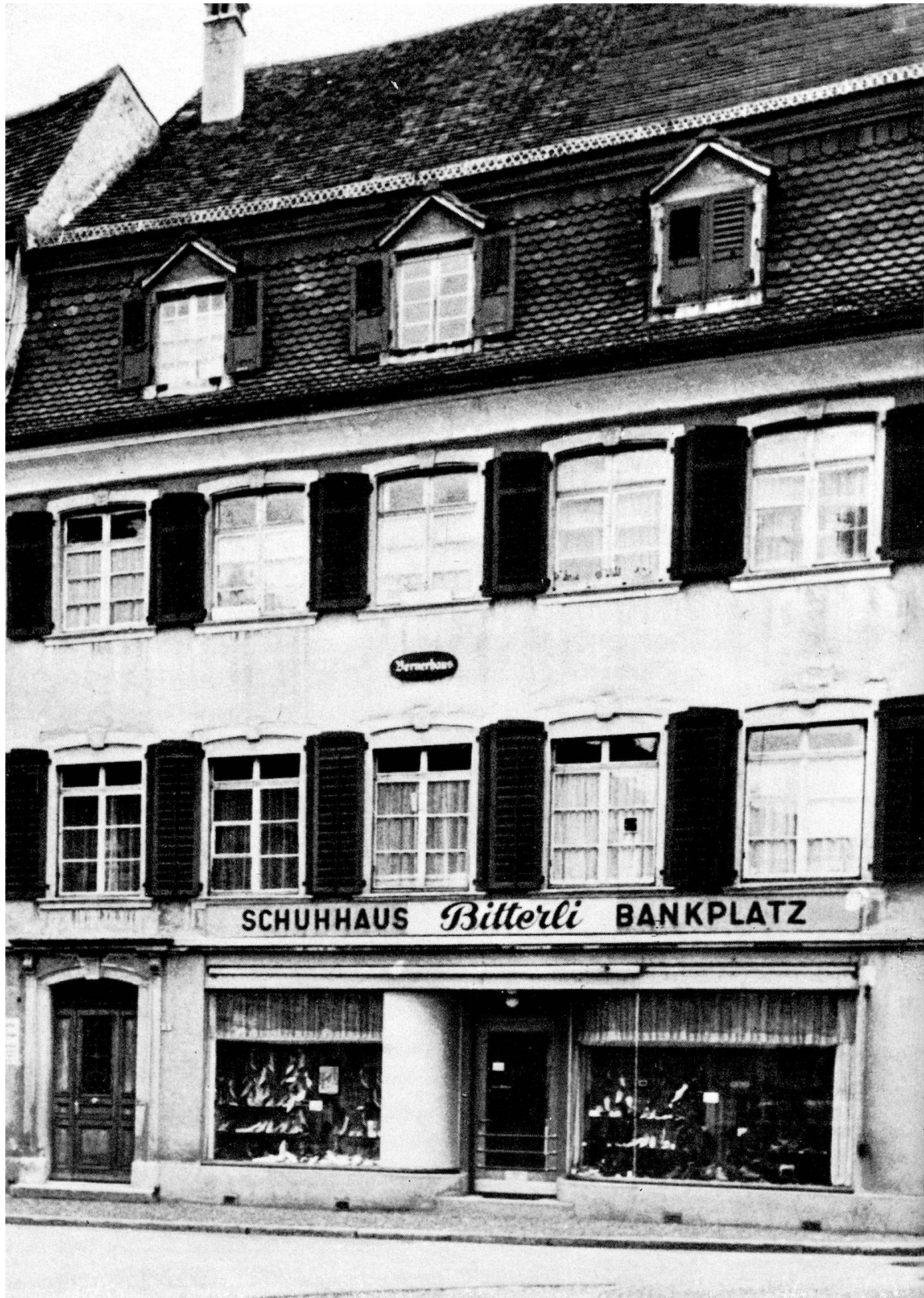
Frauenfeld, das Bernerhaus «Zur Gedult». 1771 als Haus für die bernischen Tagsatzungsgesandten gebaut und nach Vorschlägen des Johannes Bernhard von Sinner ausgestaltet. Die Restaurierung von 1965 erlöste es vom Glasstuhl, auf den es 1933 beim Umbau des Ladengeschosses gesetzt