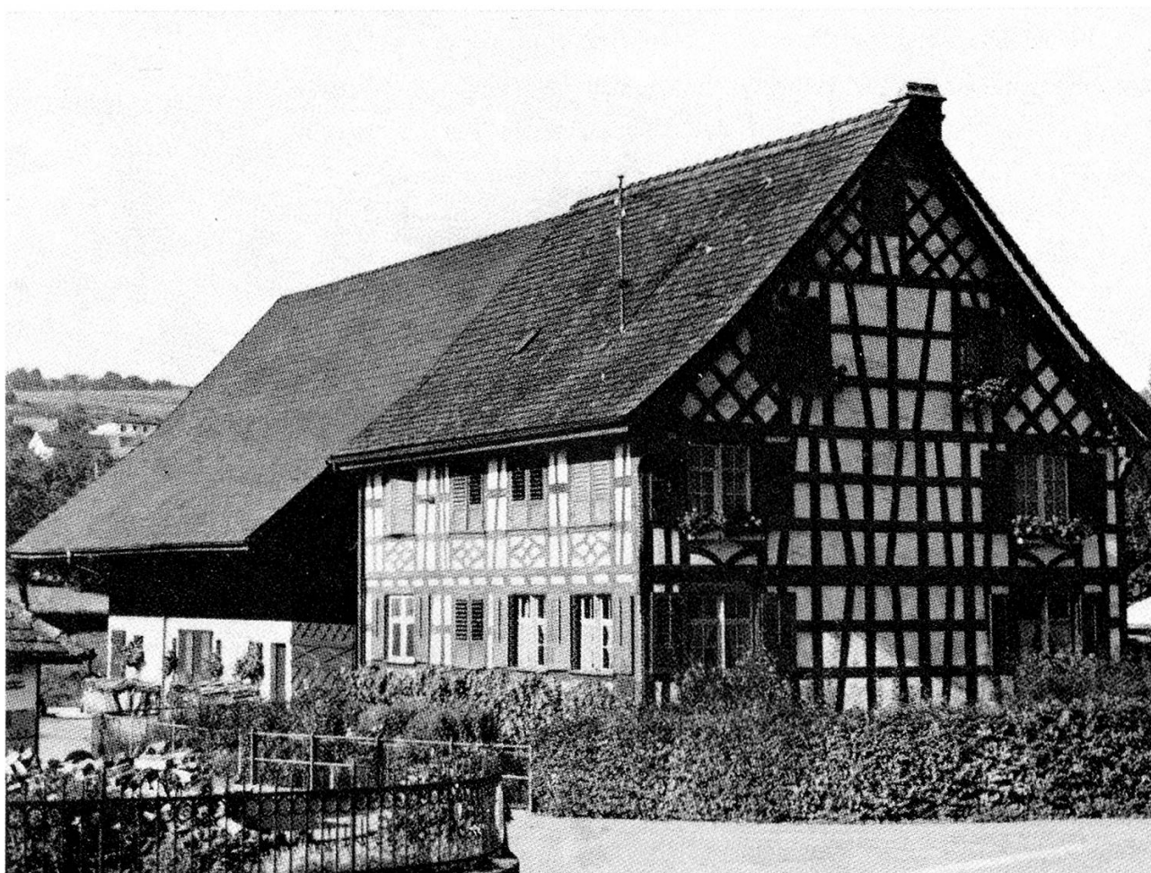
Das Geburtshaus Hermann Müllers in Tägerwilen, an dem zum 100. Geburtstag Müllers eine Gedenktafel angebracht wurde.

In unermüdlicher Arbeit und mit beschränkten technischen Hilfsmitteln suchte der geborene Forscher die Geheimnisse des Pflan-