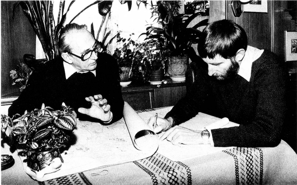
Dr. Nyffenegger (rechts) im Gespräch mit einem Ortskundigen

statt. Auf dem Stubentisch breite ich einen Vermessungsplan 1:5000 aus und orientiere ihn nach dem Himmelsrichtungen. Nach Möglichkeit benütze ich einen Plan mit dem Bestand vor der jüngsten Güterzusammenlegung. Während sich der Gewährsmann auf dem Plan orientiert, frage ich nach den Namen der Nachbargemeinden. Die mundartliche Form eines Ortsnamens ist in den Nachbargemeinden oft besser überliefert als am Ort selber. «Ammerschwiil» oder «Gaachlinge» wird man in der Umgebung häufiger hören als in Amriswil oder Gachnang, wo man die amtliche Schreibweise täglich liest und schreibt.