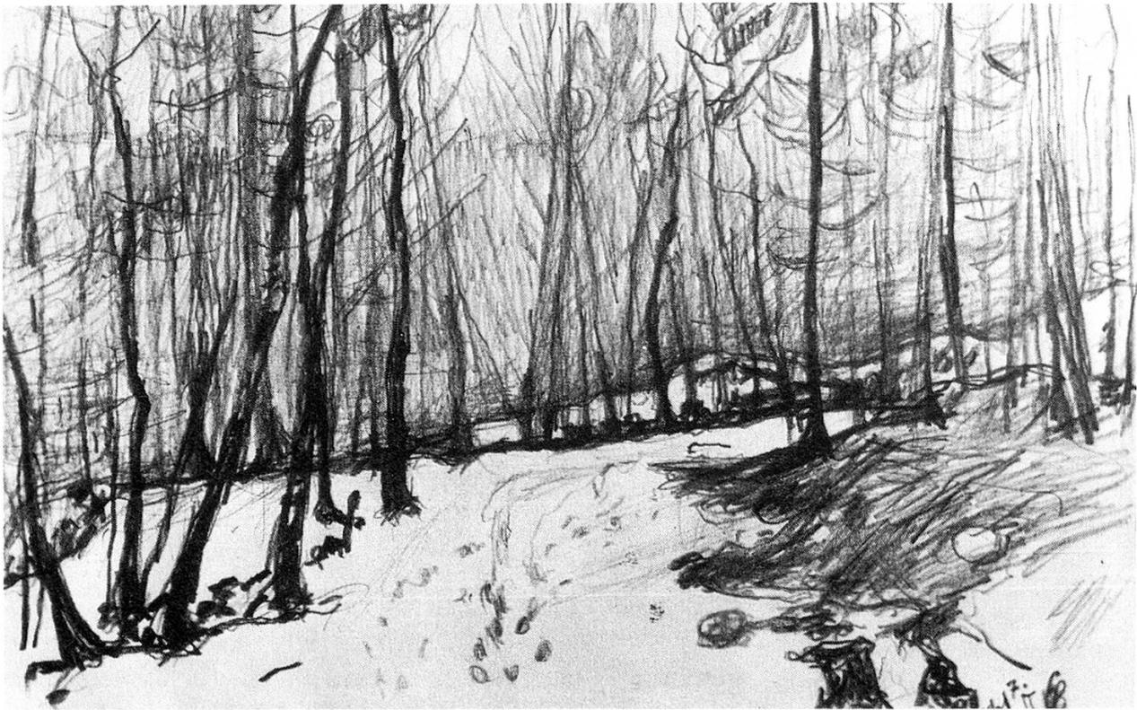
Winterwald, Bleistift, 1968.

troffene Meister des Aquarells in der europäischen Malerei spricht vom «angesammelten heimlichen Schatz des Herzens, offenbart durch das Werk und die neue Kreatur, die einer in seinem Herzen schöpft in der Gestalt eines Dings», und er betont, «daß ein Künstler in geringen Dingen mehr erzeugen könne, denn mancher in seinem großen Werk.»