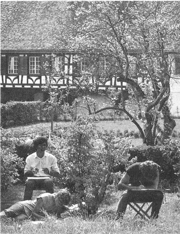
Ittingen bietet Jugendlichen Anregung, Betätigung und Herberge.