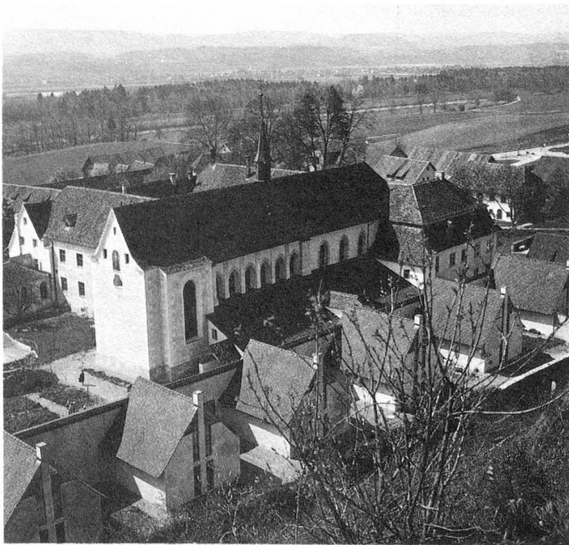
Die Kartause fügt sich harmonisch in die weichen Linien der Thurlandschaft ein.

Ittingen arbeitet bekanntlich nicht durchgehend. Über die Wochenenden schließt das Hotel praktisch seine Türen, weil die Kurse normalerweise vom Montag bis Freitag stattfinden. Dazu kommen drei Wochen Betriebsferien.