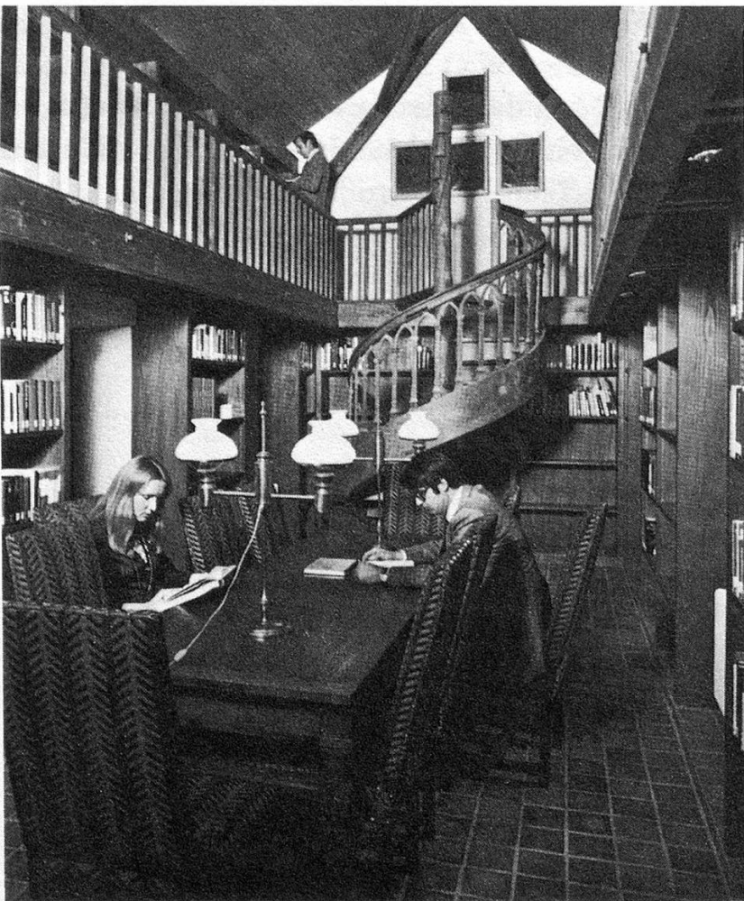
In der Kapelle auf dem Wolfsberg steht den Kursteilnehmern eine romantische Bibliothek zur Verfügung.