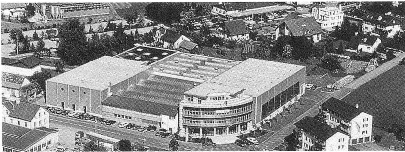
Lista Degersheim AG