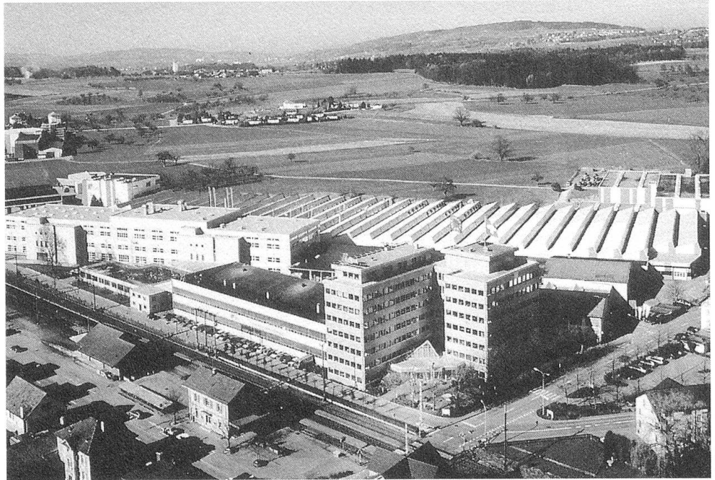
Lista Kunststofftechnik AG, Dozwil