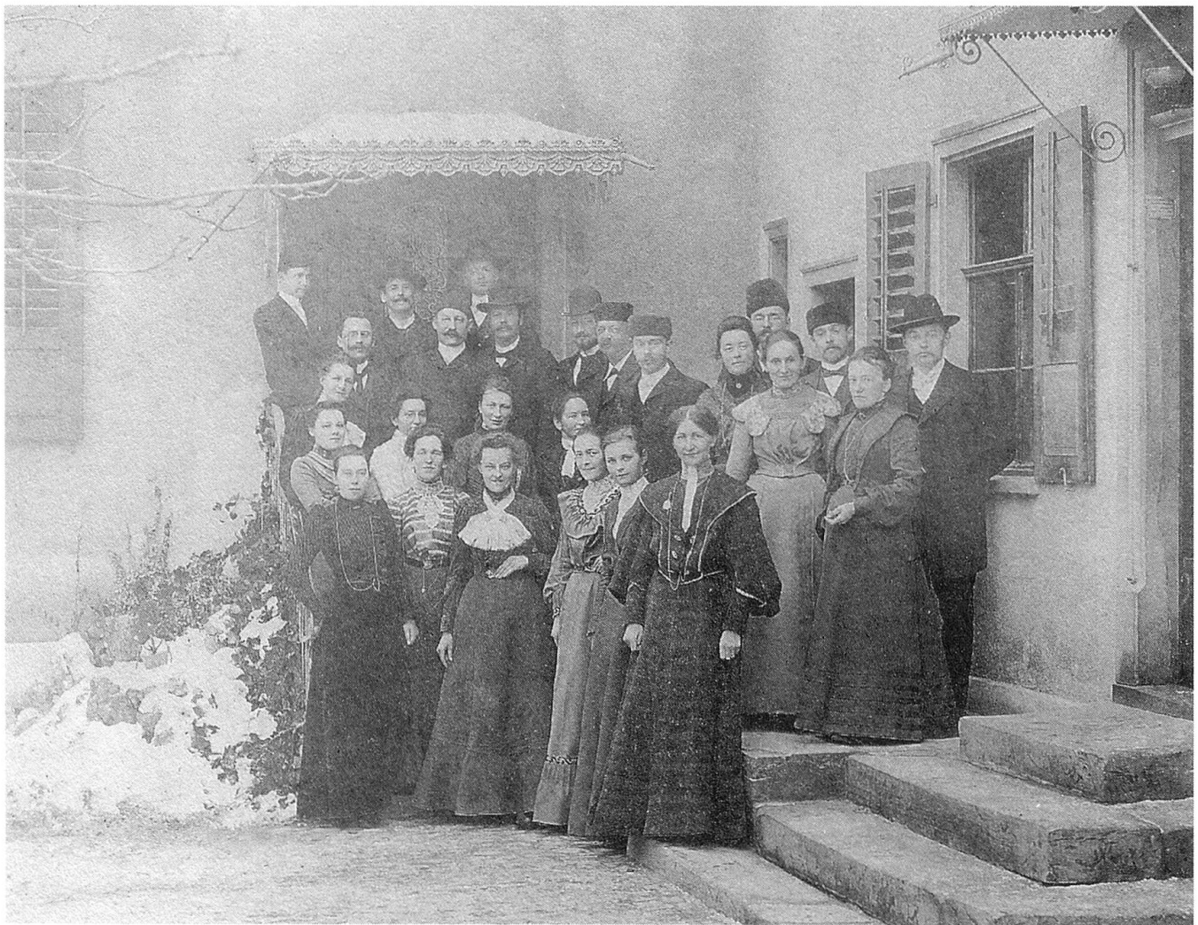
Schlittenpartie nach Altnau

Nach diesem Exkurs nun aber zurück ins letzte Jahrhundert. Die Vortragsthemen waren immer noch bunt gemischt, wenn auch ab und zu ein Rezitator engagiert wurde, was aber jedesmal der Vereinskasse ein empfindliches Defizit bescherte. Vorschläge zum Gemeinwohl waren mannigfaltig, und manches wurde auch in die Tat umgesetzt, so zum