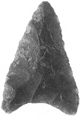
Pfeilspitze aus Silex aus der Zeit der ersten Bauern im Thurgau um 4000 v.Chr. aus Tägerwilen-Unterführung ARA-Strasse.