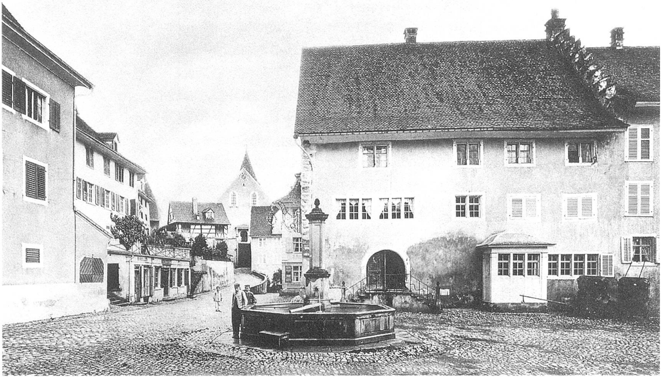
Aufnahme um 1890: im Hintergrund die 1902 abgebrochene Grubenmann-Kirche. Am rechten Bildrand die 3 Fenster übereinander (wie auf dem Bild von 1840).