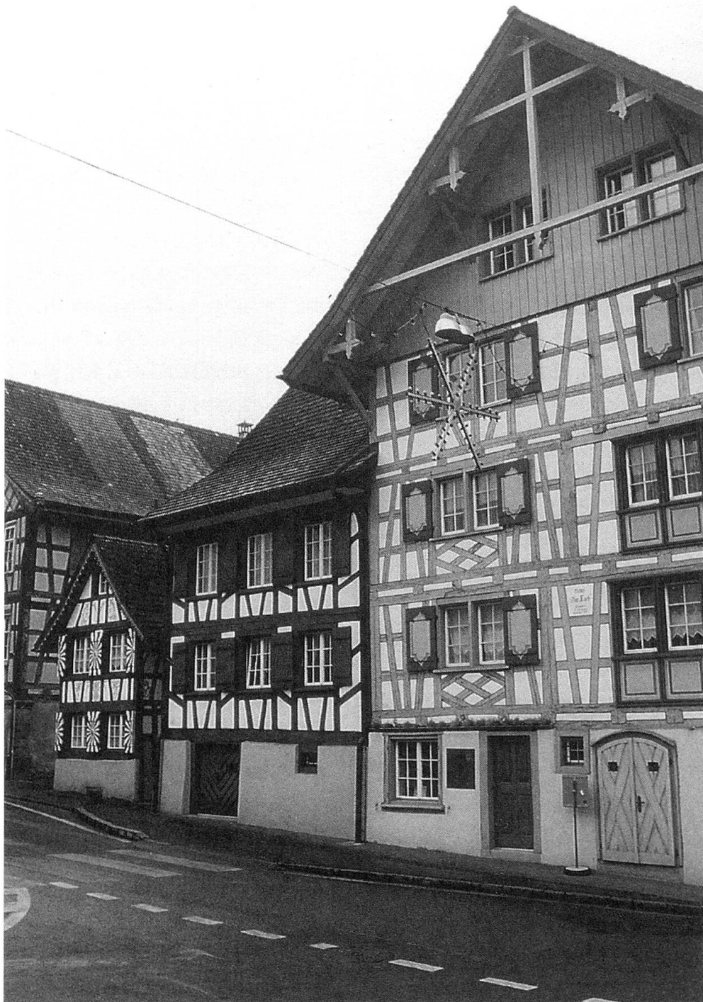
Malerhaus, Kellerhaus, Farb