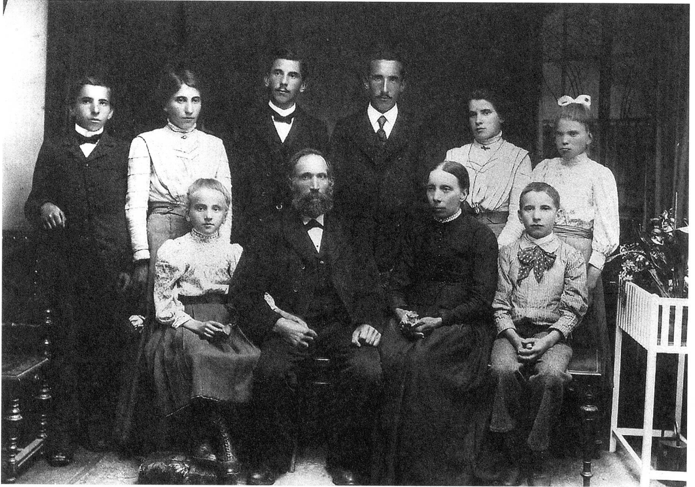
Ein Bild aus alten Tagen: 2. von rechts. Meine Mutter als Braut.