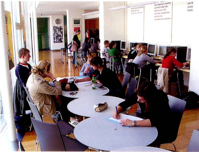
Foyer der PHTG mit PC-Arbeitsplätzen