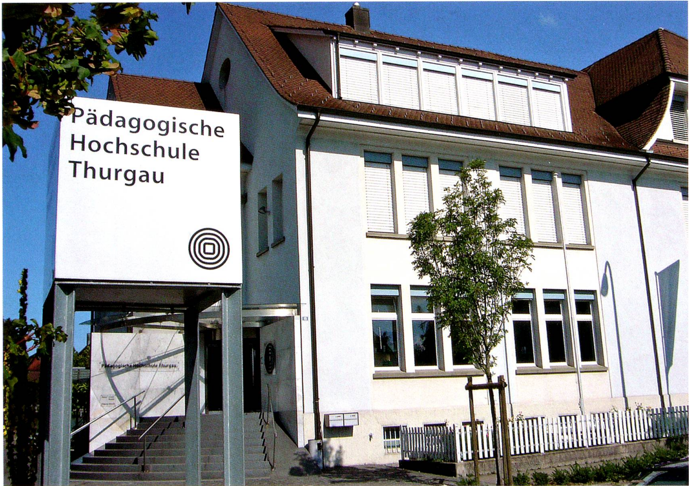
PHTG-Hauptgebäude, Nationalstrasse 19, in Kreuzlingen, noch bis Sommer 2008.

zum Rednerpult, das umgeben ist von sommerlichem Blumenschmuck. «Alles lernen ist einen Pfifferling wert, wenn die Freude dabei verloren geht», ist das Motto seiner Begrüssung, zitiert nach Heinrich Pestalozzi. Interessant, wie unterschiedlich Vorbildung und persönlicher Hintergrund der frisch Diplomierten sind, die jüngste ist noch keine 21 Jahre alt, die älteste bald 50. Zwei Frauen bringen ihre Kinder mit, die während ihrer Ausbildung geboren wurden. Zwölf angehende Lehrkräfte kommen nicht aus dem Thurgau, drei aus Süddeutschland. Und was auffällt: Nur zwanzig Männer nehmen aus der Hand ihrer Mentorin oder ihres Mentors das Diplom samt Blumenstrauss entgegen. Rund zwei Drittel der frisch diplomierten Primarlehrkräfte besuchten vor der Pädagogischen Hochschule die Pädagogische Maturitätsschule Kreuzlingen (PMS, vormals Seminar) und konnten auf Grund der dort integrierten beruflichen Grundausbildung direkt ins zweite Jahr der dreijährigen Ausbildung an der PHTG eintreten. Was also im Vorfeld der PHTG v.a. ausserhalb des Kantons eher skeptisch gesehen wurde, be-