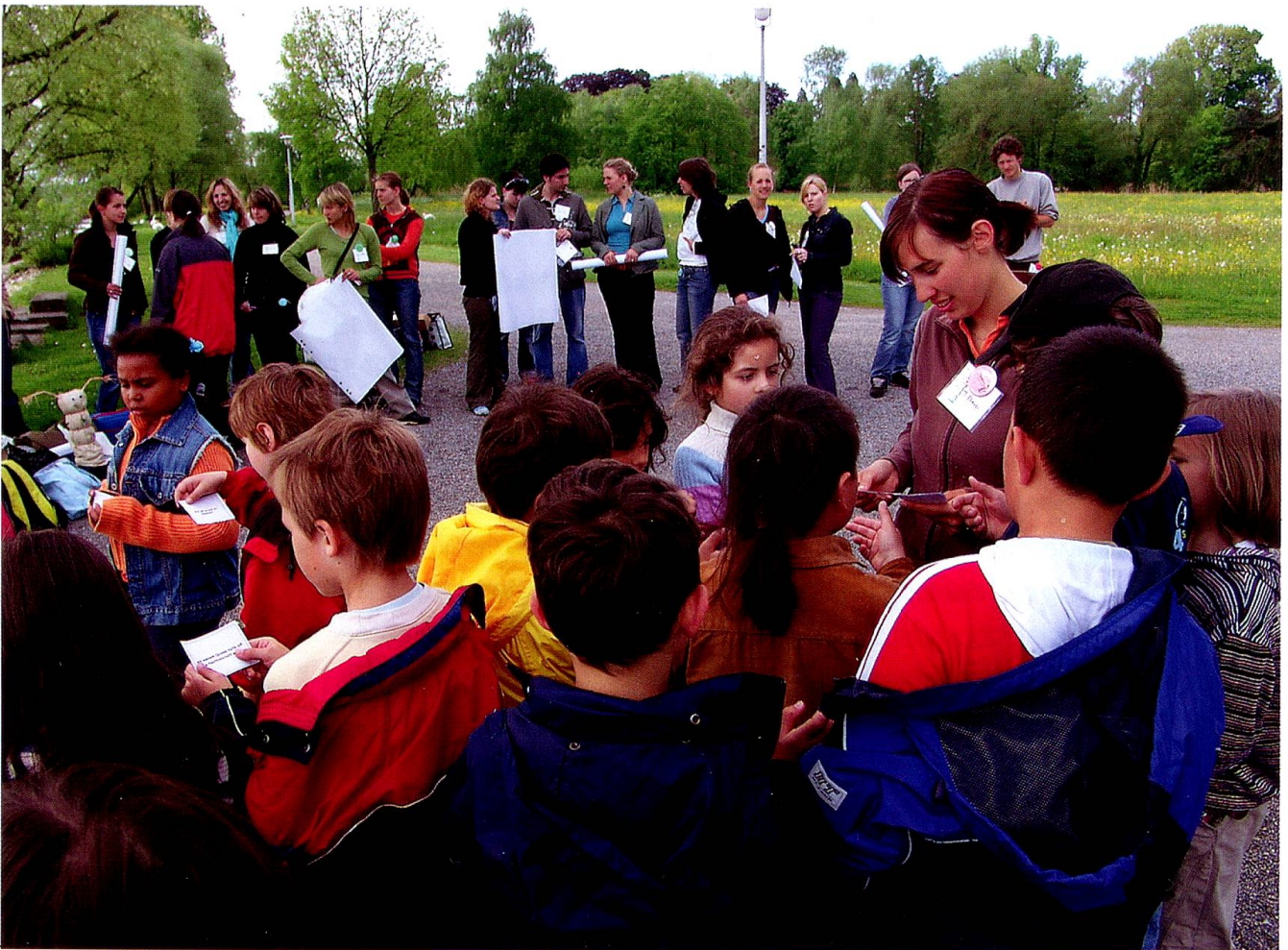
Studierende bei der praktischen Arbeit während einer Lehrveranstaltung (Seeschulzimmer)