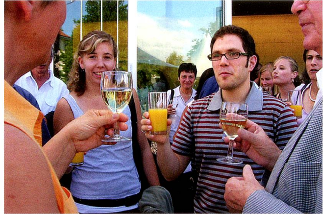
Zweite Diplomfeier 7. Juli 2007: es ist geschafft!

ritätsschule und Kantonsschule Neubauten für die Lehrerbildung errichtet, die vom Sommer 2008 an etappenweise bezogen werden. Auch dazu hat das das Thurgauer Stimmvolk im Februar 2006 Ja gesagt, als es der entsprechenden Vorlage deutlich zustimmte 6 .