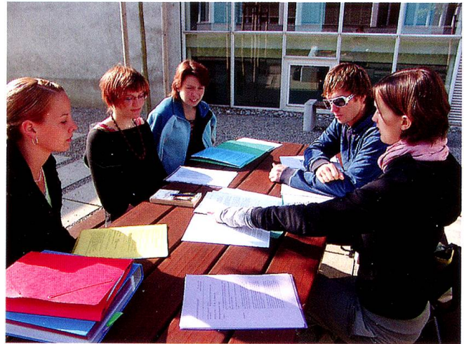
Berufseinsteigende während der Weiterbildung im 2. Berufsjahr