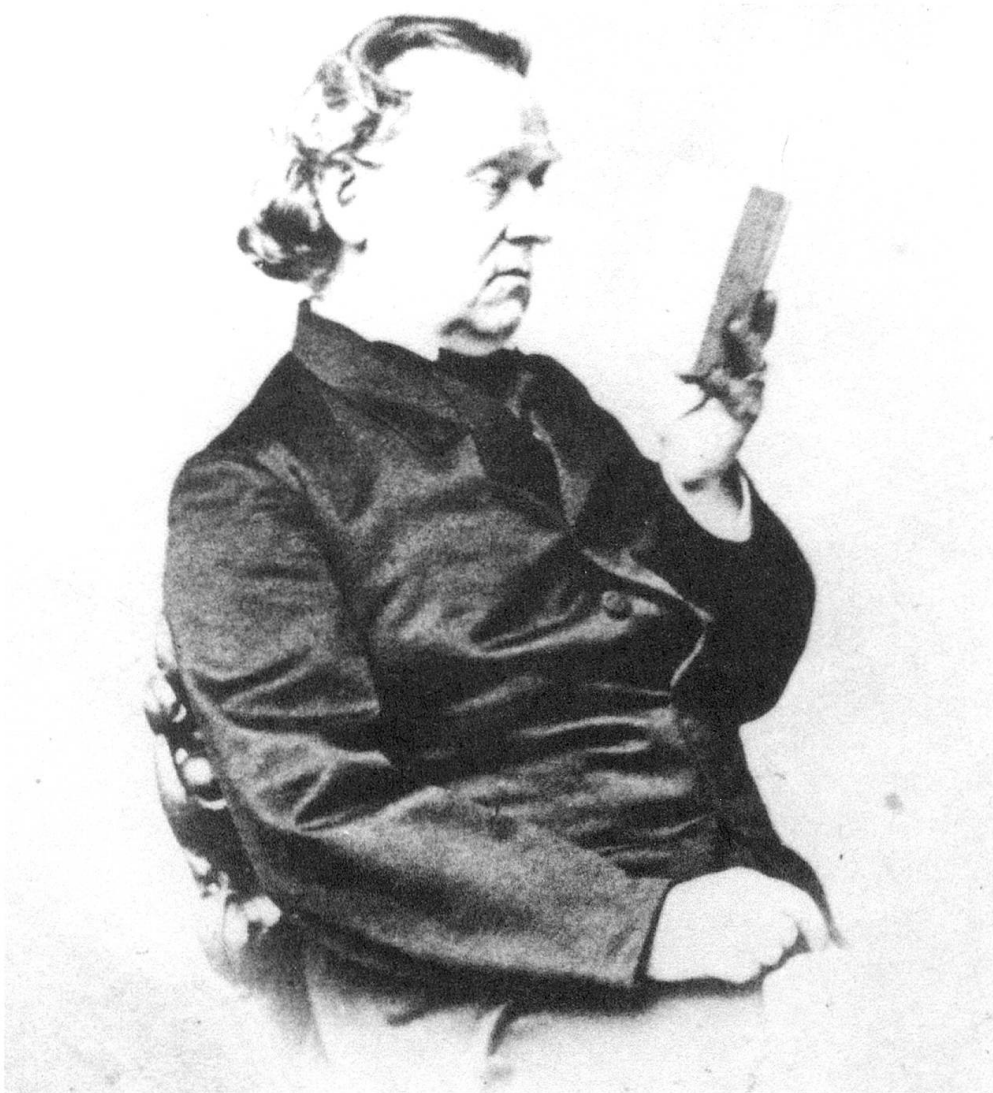
Eduard Mörike um 1864. Auf dieser Auf- nahme fühlte sich Mörike authentisch wiedergegeben.