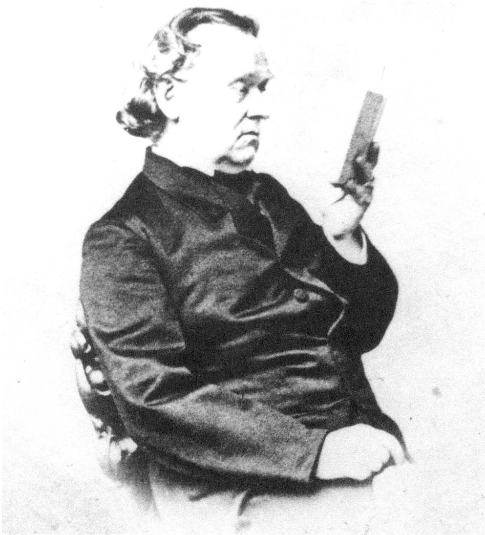
Eduard Mörike um 1864. Auf dieser Auf- nahme fühlte sich Mörike authentisch wiedergegeben.