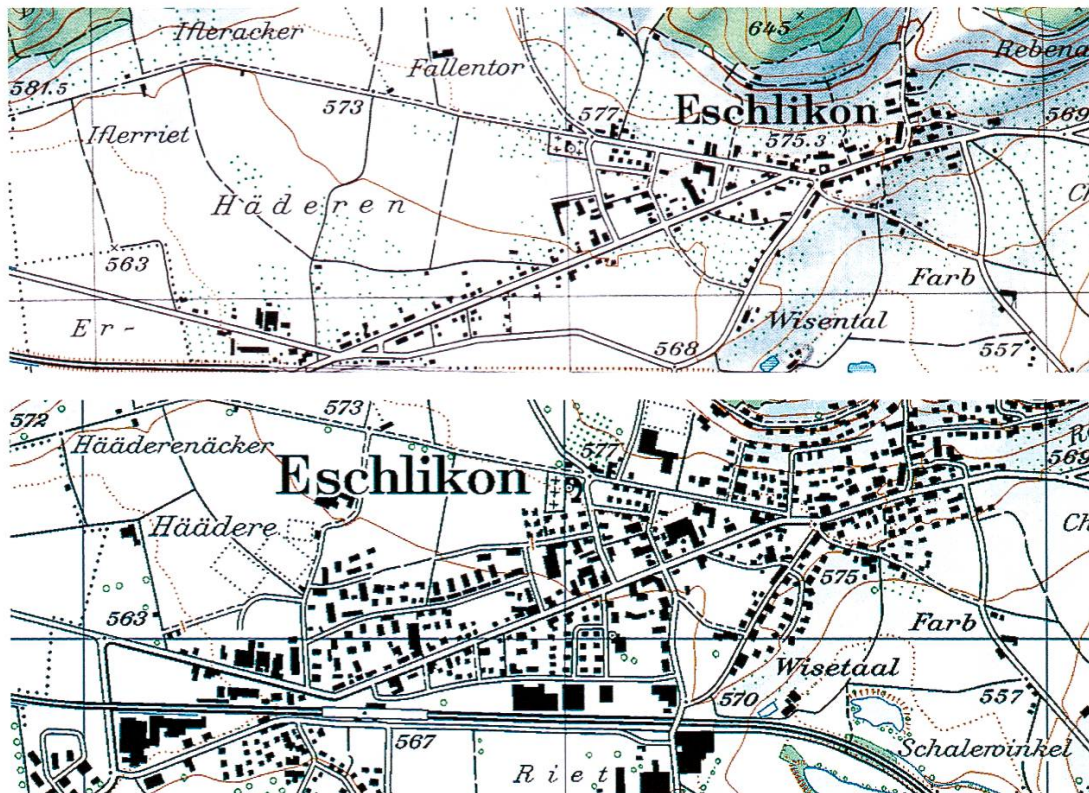
Abbildung 2: Ausschnitte Landeskarte 1956 und 2004

Neben drei Leitlinien, die sich mit der Zentrenstruktur, dem ländlichen Raum und den ausserkantonalen Beziehungen befassen, sind zu einzelnen Bereichen zusätzliche Ziele mit Begründungen formuliert. Von den sechs Zielen im Bereich Umwelt betrifft eines direkt den Boden: «Die natürlichen Böden sind möglichst zu erhalten.» Die Begründungen dazu lauten wie folgt: «Überbauung und Versiegelung sind irreversible Eingriffe in die natürlichen Böden; sie müssen deshalb minimiert werden. In ähnlichem Sinne sind die Bodensubstanz und der horizontmässige Aufbau der Böden zu erhalten. Verschiedene Böden in und um das Siedlungsgebiet sind zum Teil stark mit Schadstoffen belastet, sodass sich dort Massnahmen aufdrängen.»