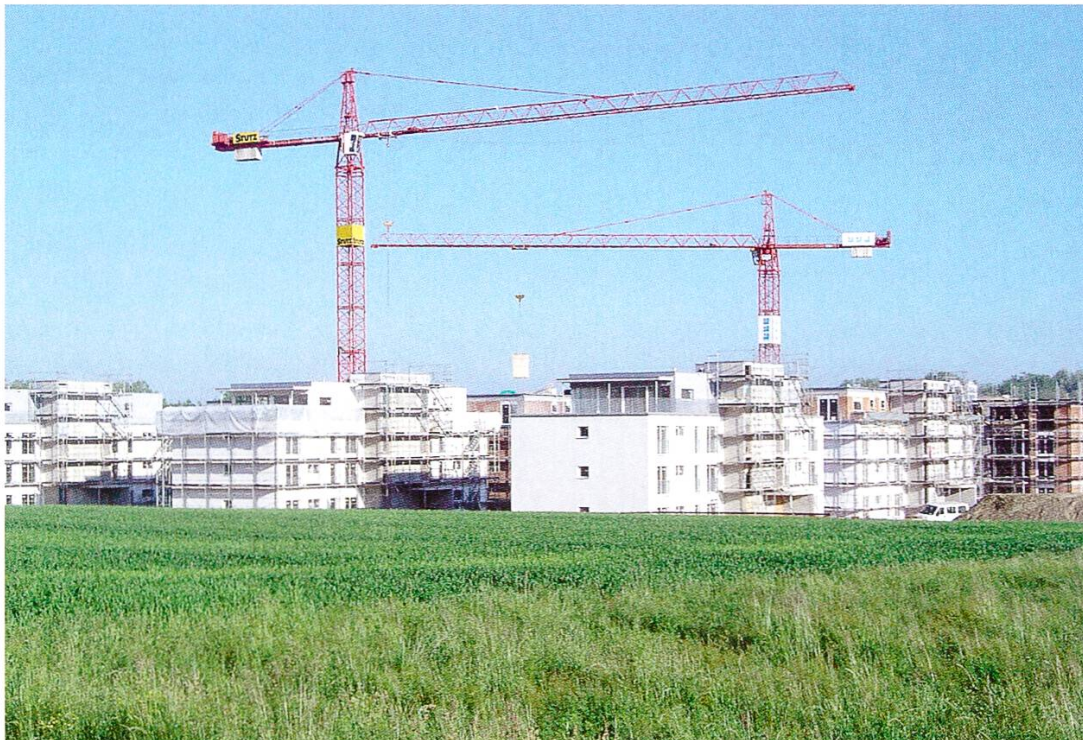
Abbildung 1: Überbauung Frauenfeld Ost (Aufnahme 7.6.2006)

Die heutigen Ansprüche an unseren Raum – an den Boden – sind vielfältig. In den vergangenen Jahrzehnten hat sich der Wettstreit zwischen konkurrierenden Nutzungen stetig verschärft. Land wird für Boden erhaltende Nutzungen wie die Land- und Forstwirtschaft, den Naturschutz oder für Freiflächen und für Erholung benötigt oder beansprucht. Boden verändernde Nutzungen verwenden den Boden als Baugrund; auf dem Boden entstehen Bauten und Anlagen für Wohnen, Arbeiten, Verkehr, Ver- und Entsorgung, Freizeit usw. Allen Nutzungen gemeinsam ist, dass entsprechender Boden dafür nicht unbeschränkt verfügbar ist. Wie mit dem unvermehrten Gut Boden umgegangen werden soll, ist daher eine zentrale Frage in der Raumplanung.