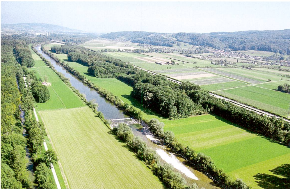
Abbildung 2: Flugbild Thur kanalisiert, August 2008, Höhe Pfyn, Blickrichtung flussaufwärts.

Durch die 1. Thurkorrektur, welche nach langer Vorbereitung 1874 begonnen und 1893 abgeschlossen wurde, ist der Lauf der Thur einförmig geworden. Die Breiten- und Tiefenunterschiede sind sehr gering, Seitenarme fehlen und Laufwindungen sind selten und minimal ( Baumann & Enz 2007 ). Die Vorländer sind 50 bis 150 m breit und werden heute meist intensiv landwirtschaftlich genutzt ( Abbildung 2 ).