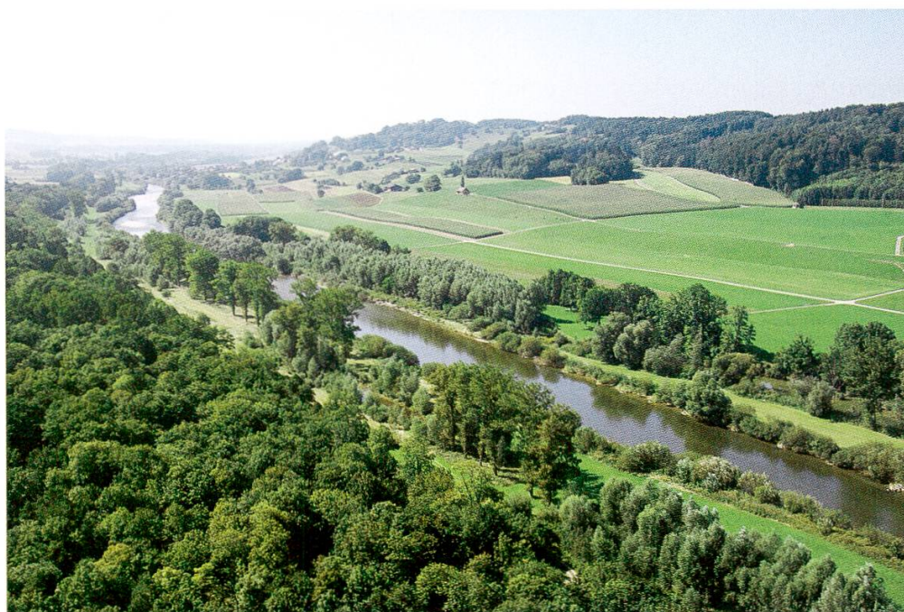
Abbildung 3: Flugbild Thur, aufgewerteter Flussraum, August 2008, Lokalität Biberäuli (rechtes Thurufer, Höhe Kartause Ittingen), Blickrichtung flussabwärts (Foto: Chr. Herrmann, BHATeam AG, Frauenfeld).

Der Fluss, d.h. das Mittelgerinne, hat mit Aufweitungen mehr Raum bekommen, was die Dynamik des Flussbettes stark belebt hat. Das kiesige Sohlenmaterial ist auf dem renaturierten Flussabschnitt im Gegensatz zu vorher wieder locker gelagert und bildet Kiesbänke, die sich mit den Hochwässern verändern ( Abbildung 3 und 4 ).