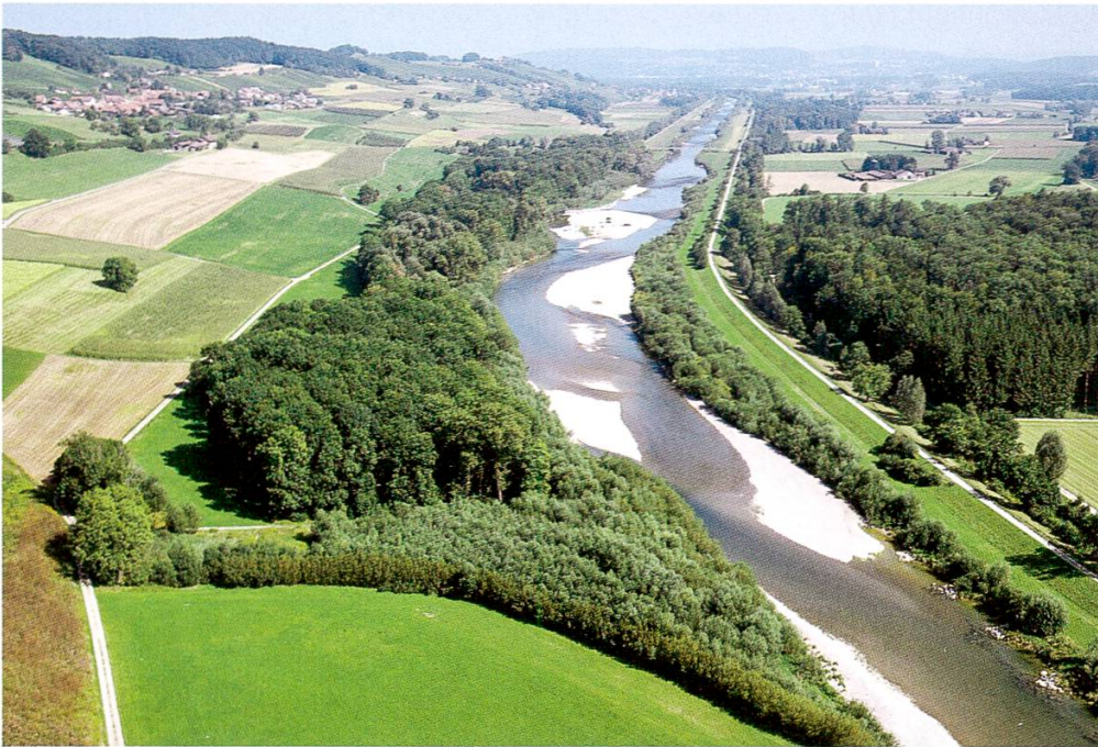
Abbildung 4: Flugbild Thur, aufgewerteter Flussraum, August 2008, Lokalität Grosse Aufweitung von Niederneunforn-Altikon, Blickrichtung flussaufwärts.

Wenn ein Fluss mehr Raum bekommt, der über seine sichtbare Wasserfläche hinausgeht, so kann er seine vielfältigen Funktionen besser erfüllen. Ausreichend Platz ermöglicht den schadlosen Abfluss von Wasser und Geschiebe und wirkt ausgleichend bei Hochwasser. Die Flusssohle und die Uferbereiche verbinden Lebensräume und Landschaftsteile. Bei genügender Ausdehnung erhöht das standorttypisch bewachsene Ufer und Umland die Selbstreinigungskraft des Flusses und hilft Schad- und Nährstoffe abzubauen. Dies ist eine wichtige Voraussetzung zur Sicherung der Grundwasserqualität.