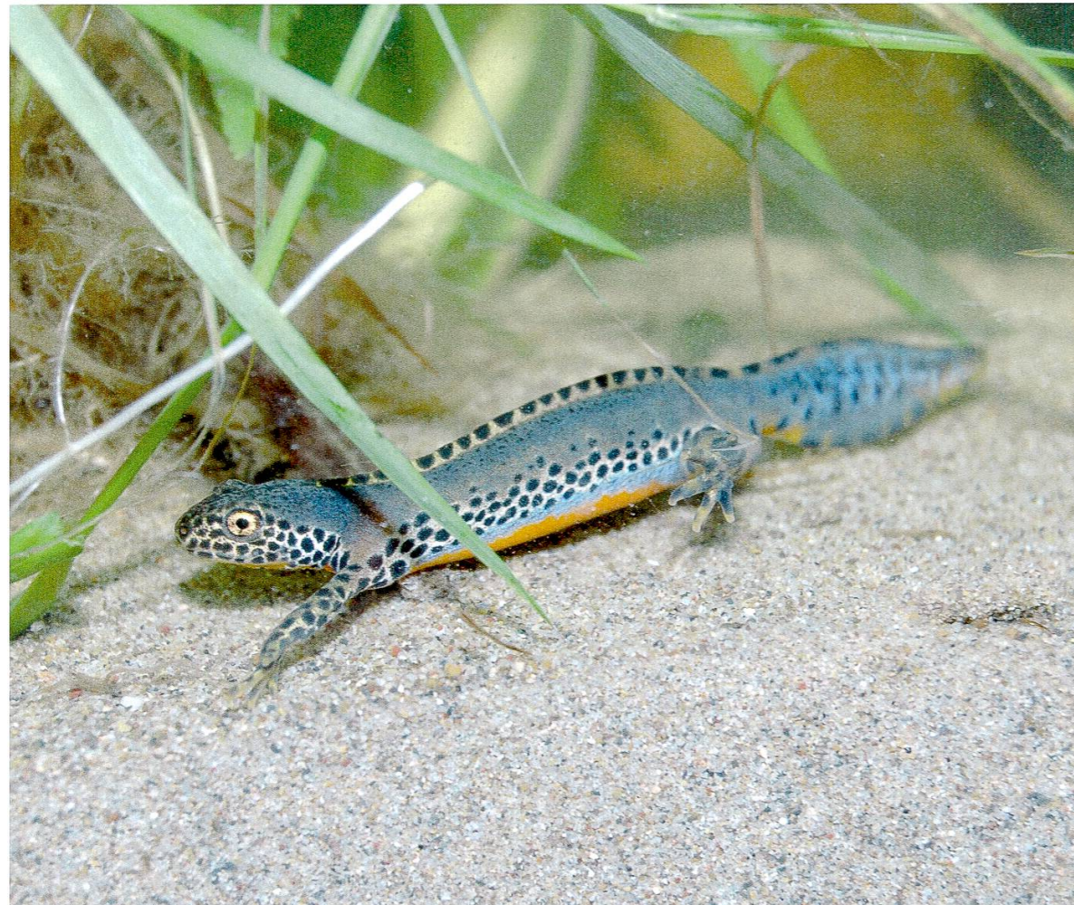
Abbildung 2: Bergmolch.

Vom Teichmolch konnten im Seebachtal bisher nur Einzeltiere beobachtet werden, dafür in vier verschiedenen Gebieten. Für diese unauffällige Art sind aber geringe Beobachtungszahlen nicht ungewöhnlich. Umfangreiche Abfischungen von Gewässern haben immer wieder gezeigt, dass die Populationen viel grösser sind als vermutet ( Laufer et al. 2007 ). Während der landlebenden Phase ab Mitte Juni werden die Verstecke über längere Zeiträume genutzt und meist nur kleinräumige Wanderungen unternommen. Die Ausbreitungswanderungen erfolgen vor allem durch die Jungtiere. Diese Tatsache legt auch beim Teichmolch die Annahme nahe, dass die Art zuvor noch vereinzelt im Gebiet vorhanden war. Wie im Gebiet In Langen Teilen kommt der Teichmolch häufig in Gesellschaft mit dem Kammmolch vor.