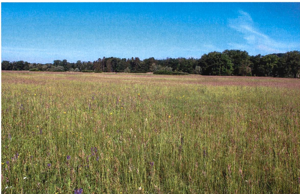
Abbildung 5: Blick über die heute regenerierte Trespenwiese im Untersuchungsgebiet O. Foto: Martin Götsch, 26. Mai 2020.

Im Untersuchungsgebiet O ( Abbildung 5 ) wurden 2020 abwechslungsreiche Bereiche mit niedriger und etwas höherer Vegetation vorgefunden und insgesamt 55 Arten erfasst. Auch mehrere typische Vertreter eines Halbtrockenrasens waren wieder häufiger anzutreffen bzw. konnten neu kartiert werden: u. a. das Mittlere Zittergras ( Briza media ), das Echte Labkraut ( Galium verum ), der Feld-Thymian ( Thymus serpyllum ) oder der Wiesen-Salbei ( Salvia pratensis ).