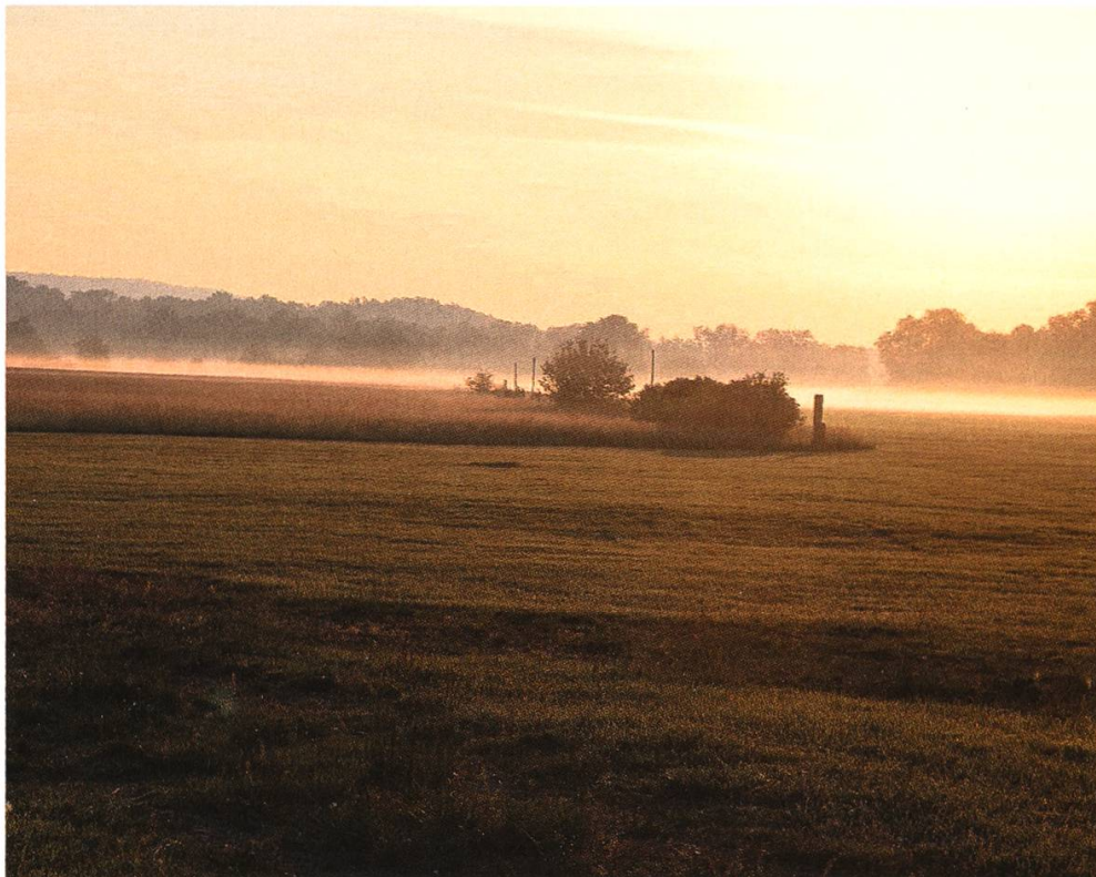
Abbildung 3: Untersuchungsbereich I – Blick über die, in früheren Jahren teilweise gemähten, Trespenwiesen. Foto: Martin Götsch, 21. Mai 2020.