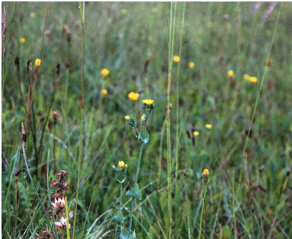
Abbildung 2: Im Untersuchungsbereich I konnte eine schöne Anzahl des Durchwachsenen Bitterlings ( Blackstonia perfoliata ) kartiert werden. Foto: Martin Götsch, 13. Juni 2020.