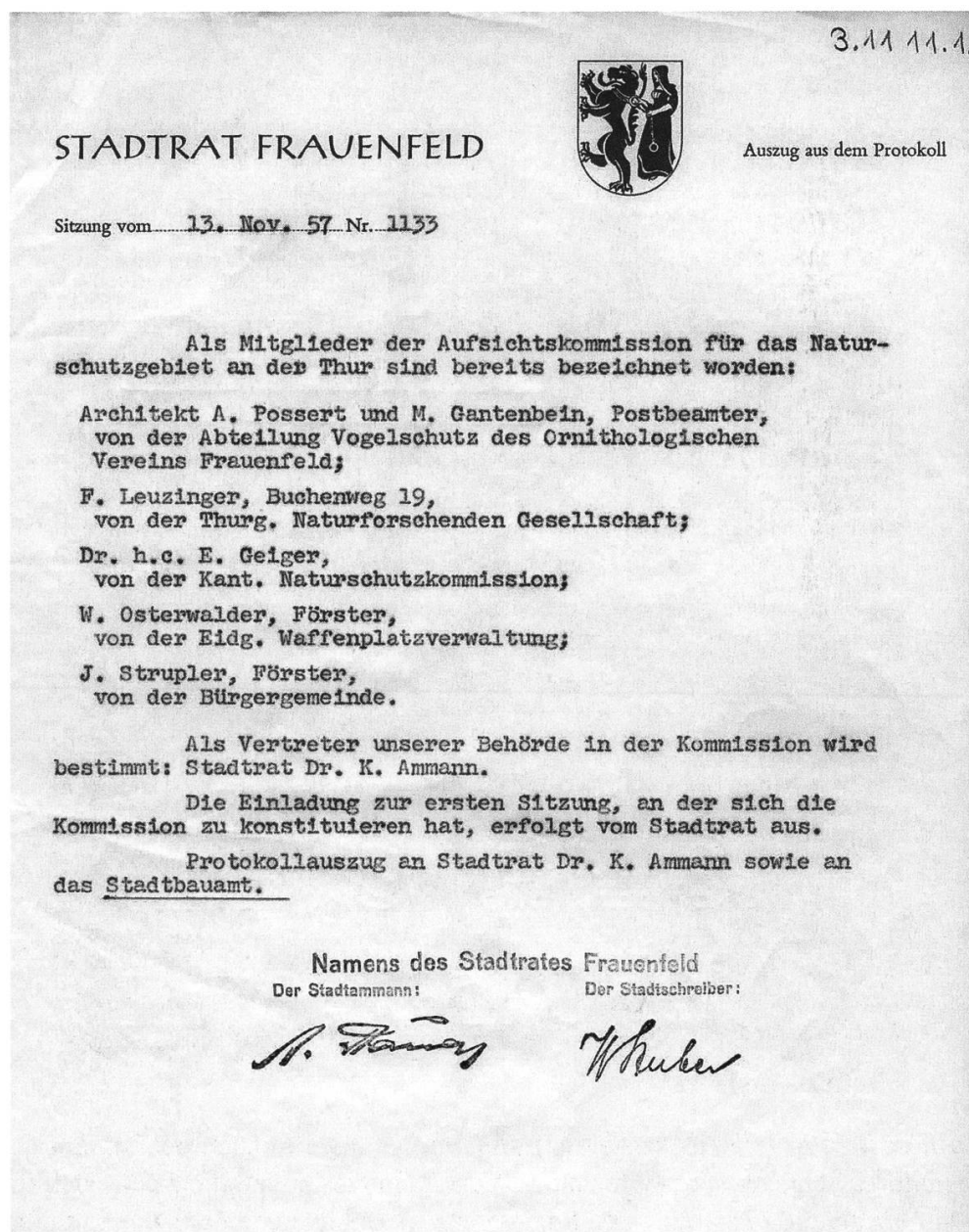
Abbildung 3: Verzeichnis der Mitglieder der Aufsichtskommission im Jahr 1957.