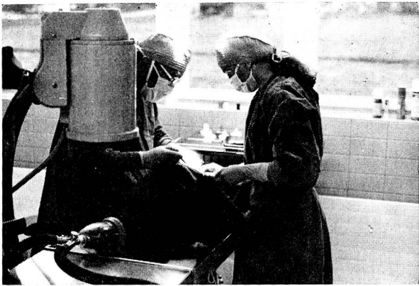
Bauchoperation beim Hund.

friedenstellend auf dem Hof des Tierbesitzers selbst ausgeführt werden können. Wenn ohne Gefahr für das Tier eine Klinik aufgesucht werden kann, dann sind die Verhältnisse natürlich als ideal zu bezeichnen. Andererseits soll sich ja auch der Praktiker die nötige Routine aufrecht erhalten und sich durch Uebung in der Methode vervollkommen können. Spezialfälle wie komplizierte Knochenbrüche im Bereich der Extremitäten oder auch der Kopfgegend (vor allem Unterkiefer) gehören aber in die Hand des dafür speziell geschulten und mit dem nötigen Instrumentarium vertrauten «Spezialisten». Denn es ist heute in sehr vielen Fällen möglich, gerade wertvolle Zuchttiere durch moderne Chirurgie vor der vorzeitigen Verwertung zu bewahren und ihren genetischen Wert weiterhin voll auszunützen. Dass dies aber nur in einer Klinik geschehen kann, das dürfte jedermann klar sein. So betrachtet bekommen Tierklinik und Tierheim in Nesslau auch für den dem Tier eher nüchtern und rechnerisch begegnenden Landwirt eine unüberschätzbare Bedeutung, zumal sie ein wirklicher Fachmann leitet, der nebenbei noch eine grossräumige kurative Praxis betreut.