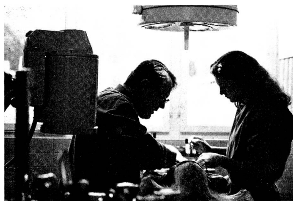
Klinikleiter und Assistentin.

Als Tierarzt werde ich immer wieder mit der Frage konfrontiert, ob nun eine Tierklinik in einem Tal wie dem Toggenburg, das tierärztlich gut versorgt wird,