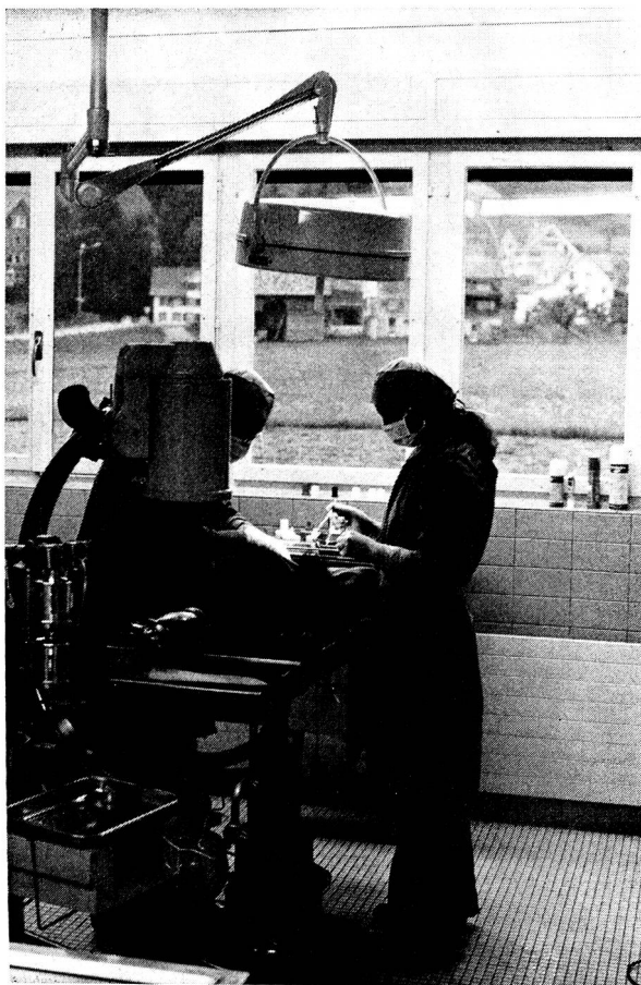
Moderne Apparaturen ermöglichen auch schwierige Eingriffe.

trotzdem ihre Berechtigung hätte. Eine Frage, die ich heute positiv beantworten möchte. Vor allem auch deshalb, weil durch die enge Verkoppelung mit dem Tierheim, eine maximale Betreuung der zur Pflege anvertrauten «Feriengäste» garantiert wird. Nachteile ergeben sich natürlich gerade auf Grund des regen Tierverkehrs durch diese «Feriengäste» auch.