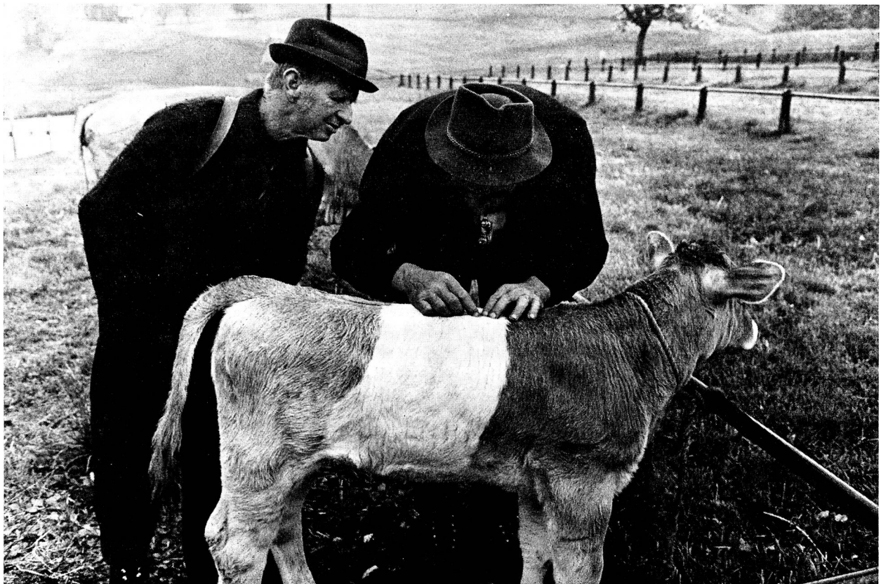
Das Kalb hat Läuse.

nicht sehr leicht verdiente Geld halt nur mit Bedacht und fast ein wenig ungerne wieder ausgegeben wird, mag ja gewiss schon stimmen, aber wenn einigermaßen schönes Wetter herrscht am Markttag, so dass eine Menge Marktbesucher anwesend sind, können die Verkäufer doch ihre Geschäfte machen.