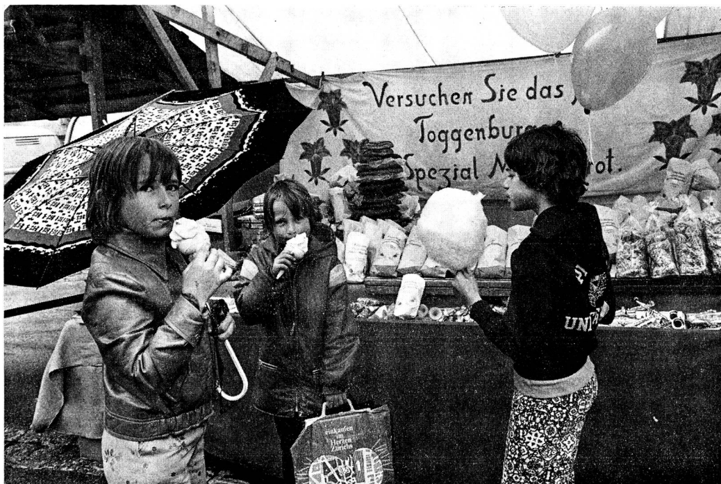
«En Chrom für Gofe.»

men recht gerne wieder in ihre alte Heimat und an den Sidwalder-Markt, wo sie wieder für ein paar Stunden mit ihren alten Freunden und Bekannten zusammentreffen können. Wer so Gespräche zwischen hier ansässigen und ehemaligen Toggenburgern mitanhört, kann feststellen, dass oft mit Wehmut davon Kenntnis genommen wird, dass dieser oder jener nicht mehr gut zweig oder gar gestorben sei. Insbesondere als das Telefon noch nicht so verbreitet war wie heute, war es oft der Fall, dass gerade am Markttag solche Meldungen weiter geboten wurden. Im Sidwald ist der Warenmarktplatz unterhalb des Gasthauses zum Ochsen, während der Viehmarkt oberhalb desselben stattfindet, und es gehört sich, dass man auch auf dem Viehmarkt versucht, eine Szene aufzuschnappen. Bei besseren Leuten hat das Wort «Kuhhandel» so etwas wie eine Anspielung auf unsaubere Geschäfte an sich. Dieses scheint mir im Hinblick auf einen wirklichen Kuhhandel auf dem Markt in Sidwald fast eine Herabwürdigung zu sein. Die Markttiere selber scheinen sich am Markt mei-