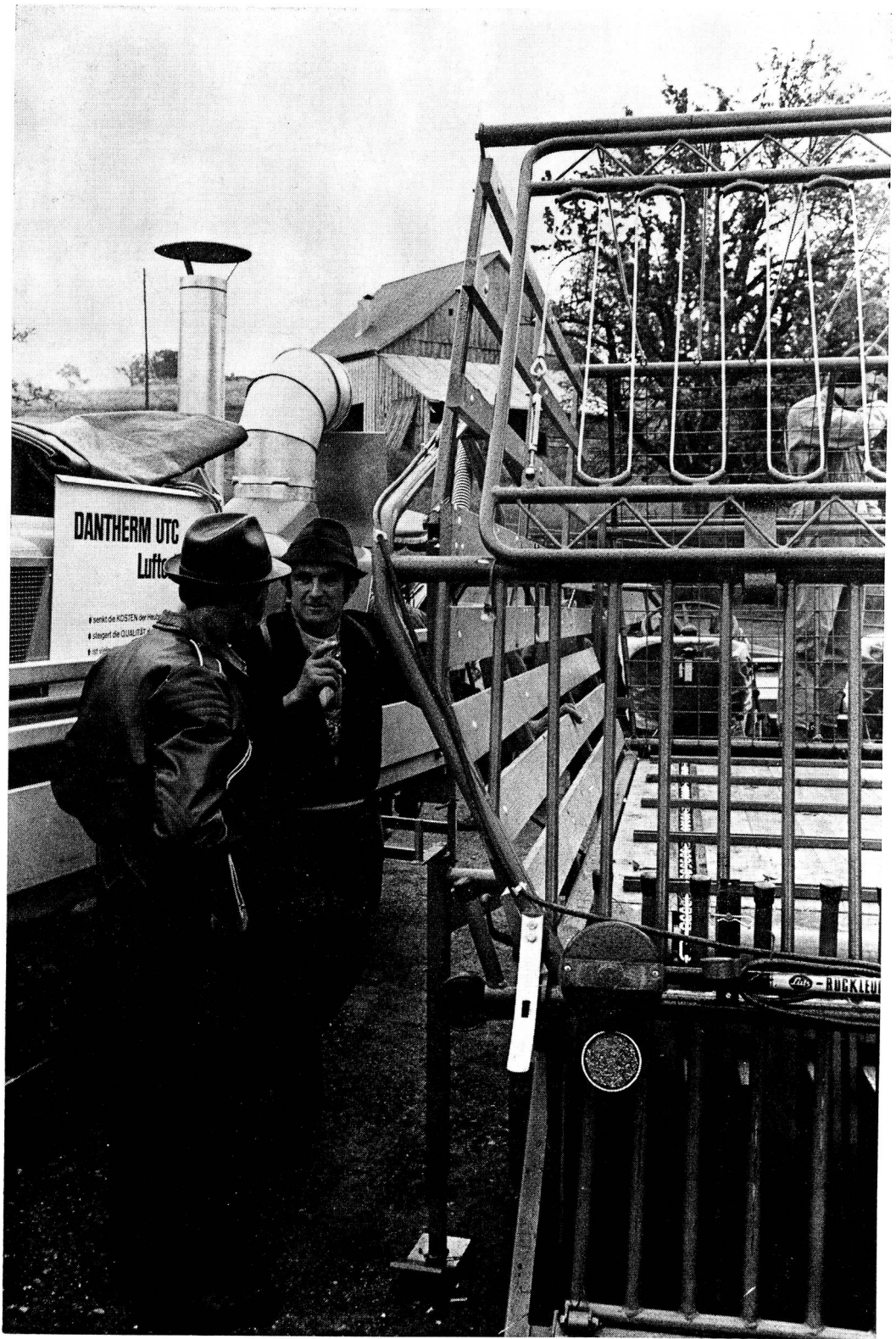
Die Technik mit ihren Neuerungen hat sich eingebürgert.