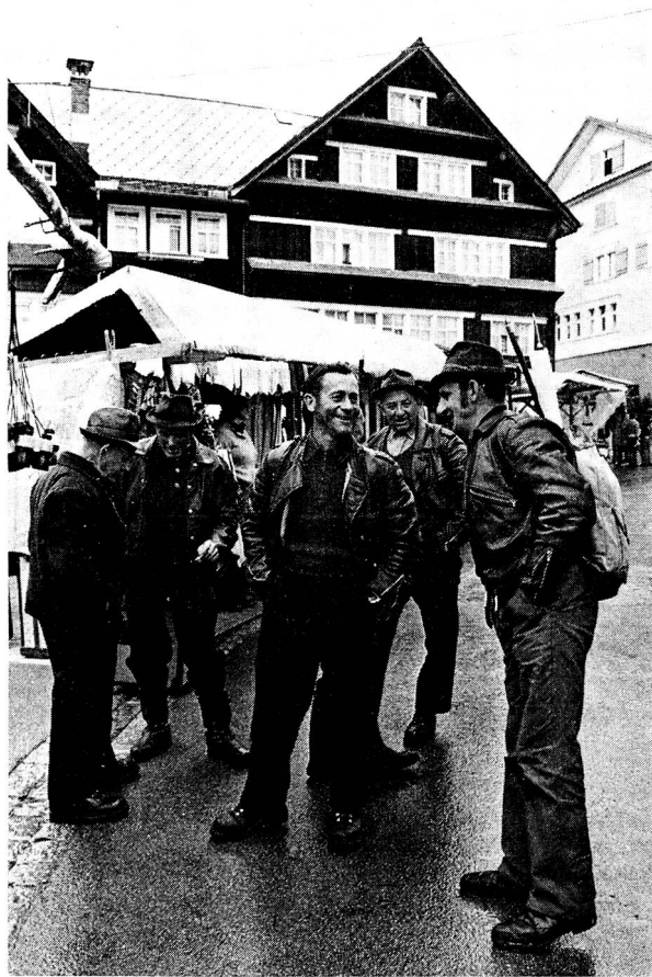
Man trifft sich zu einem Schwatz . . .