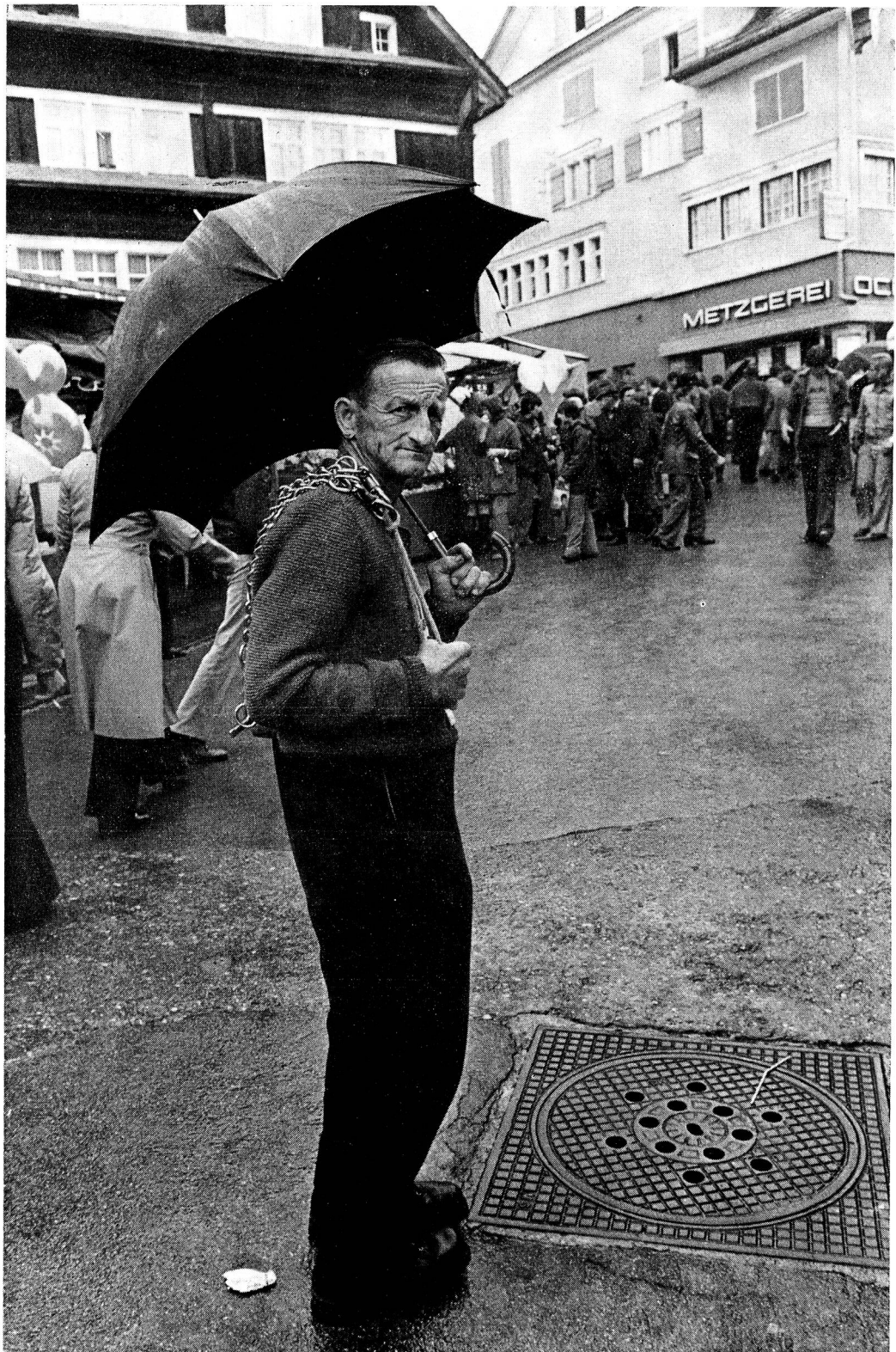
Der Toggenburger soll bedächtigt sein.