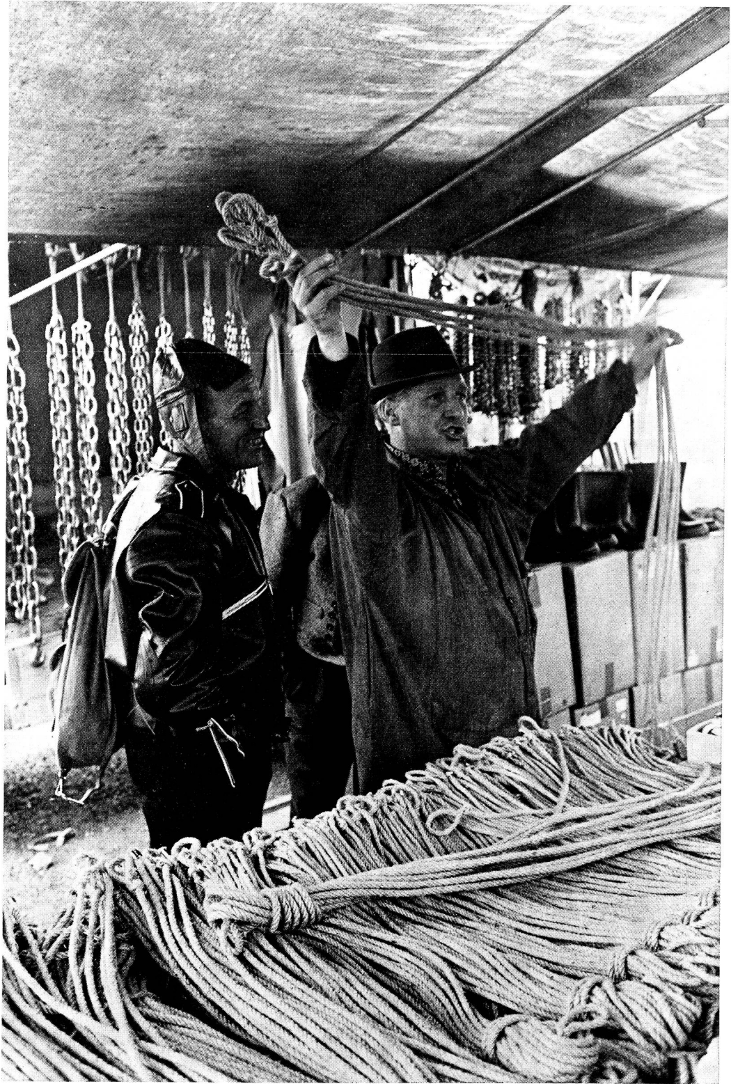
Der «billige Jakob».