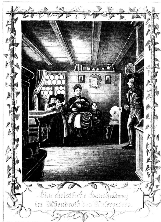
Eine christliche Familie im Abendrot des Unservaters

Mit Fragen kommt jeder nach Rom. Achte den Nachbarn, doch reiss den Zaun nicht ein. Vor der Tat hol dir Rat. Nach der Tat weiss auch der Dümme Rat. Wer den Wolf schont, gefährdet die Schafe. Lieber wenig und gut wissen, als ein Haufen halbes Wissen. Man soll nicht jauchzen, bevor man über dem Graben ist. Der ist ein tapferer Mann, der seinen Zorn bemeistern kann. Wer alt werden will, der lebe danach. Lieber ein Unkraut stehen lassen als die ganze Saat ausreissen. Wenn du kaufst, was du nicht brauchst, musst du bald verkaufen, was du brauchst. Trink und iss, Gott nie vergiss! Jeder muss sich nach seiner Decke strecken. Halte Mass in Speis und Trank, so wirst du alt und selten krank. Wie du in den Wald rufst, so hallt es zurück. Wer den Kern will, muss die Schale aufbeissen. Geh mit den Worten so sparsam um wie mit dem Geld. Wer schimpft, verliert. Doppelt betet, wer seine Pflicht erfüllt. Man biegt das Bäumchen, solange es jung ist. Fallen ist keine Schande, aber man soll wieder aufstehen. Wer gut sattelt, reitet gut.