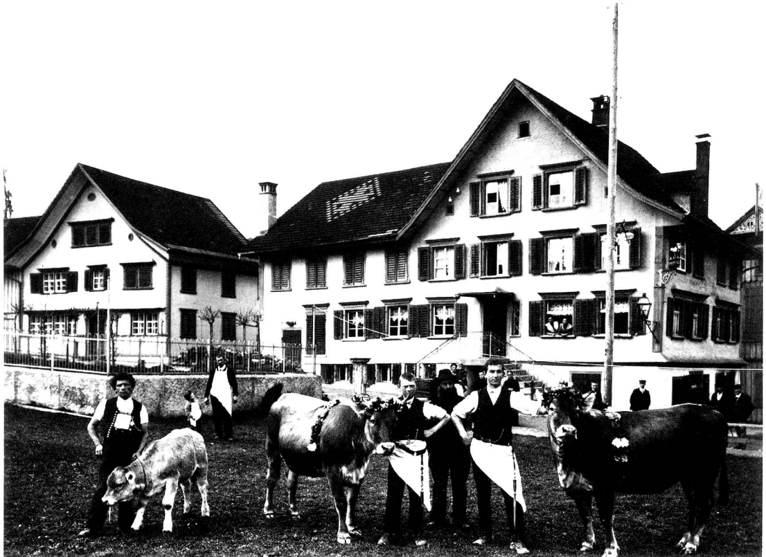
Wirtschaft und Metzgerei zum «Ochsen», Dietfurt um ca. 1910

Auf dem Bilde sind mit Kränzen um den Leib und die Hörner gezierte Rinder zu sehen. Es handelt sich um einen alten Brauch, welcher früher in der ganzen Ostschweiz heimisch war. Die schönsten Schlachttiere wurden bis kurz vor Ostern behalten, dann vom Verkäufer vor der Ablieferung mit bunten Kränzen geschmückt. Die Metzgerburschen führten diese gekränzte Tiere vor der Schlachtung durch's Dorf. Hernach wurden die Metzgerburschen und der Lieferant mit einem üppigen Mahl, das mit viel Wein begossen wurde, bewirtet. Auch viele andere Leute des Dorfes nahmen oft an diesem «Feste» teil. – Der Brauch wurde in Dietfurt bis ca. 1940, als die Fleischrationierung einsetzte, durchgeführt.