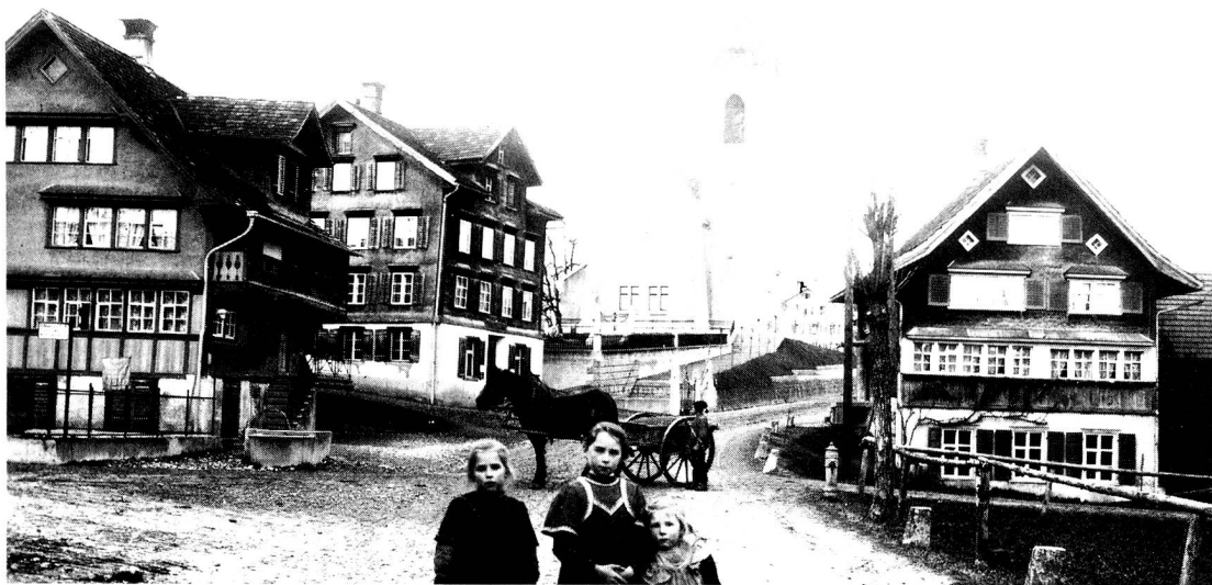
Dietfurt, im Bächli, um 1910

Ebnöter für einen Wassermotor musste wegen Wassermangels abgelehnt werden. Die Tobelackerquelle wurde dem Reservoir zugeleitet.