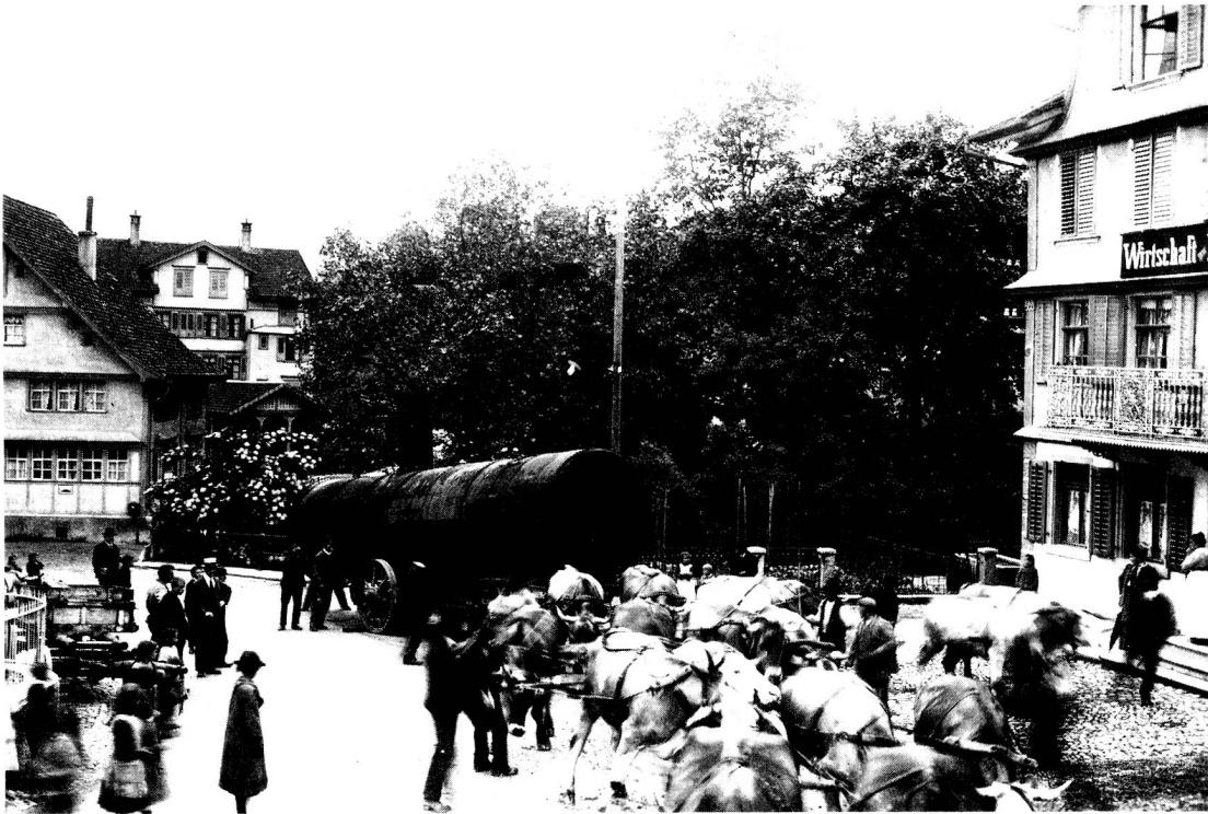
Ein aussergewöhnlicher Transport durch das Dorf Dietfurt