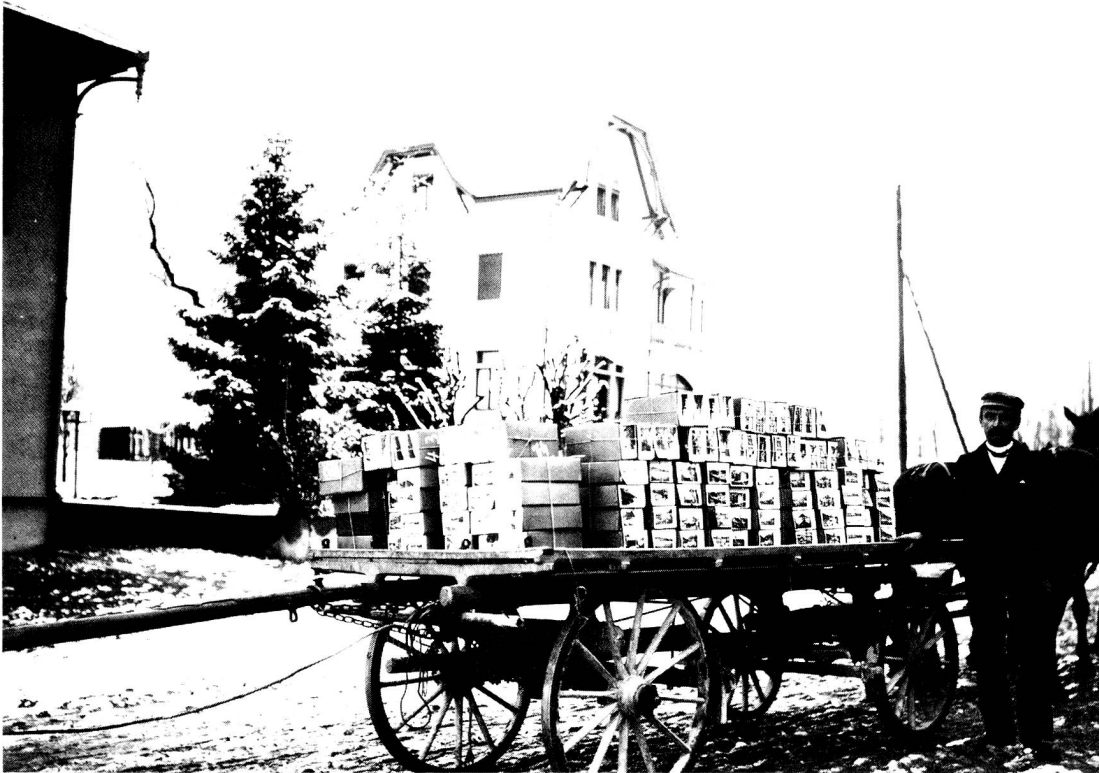
Alfred Lichtensteiger, Karten-Verlag, beim Abliefern einer Sendung auf dem Bahnhof Dietfurt.