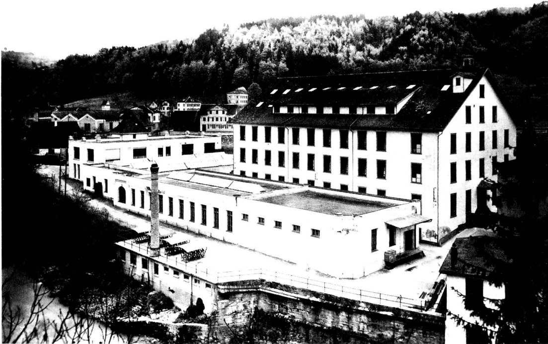
Spinnerei und Weberei Dietfurt AG