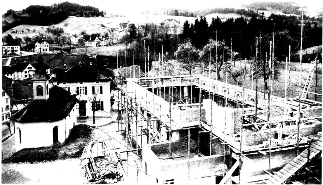
Bau der Kapelle, Einweihung 1933. Daneben die alte Kapelle.