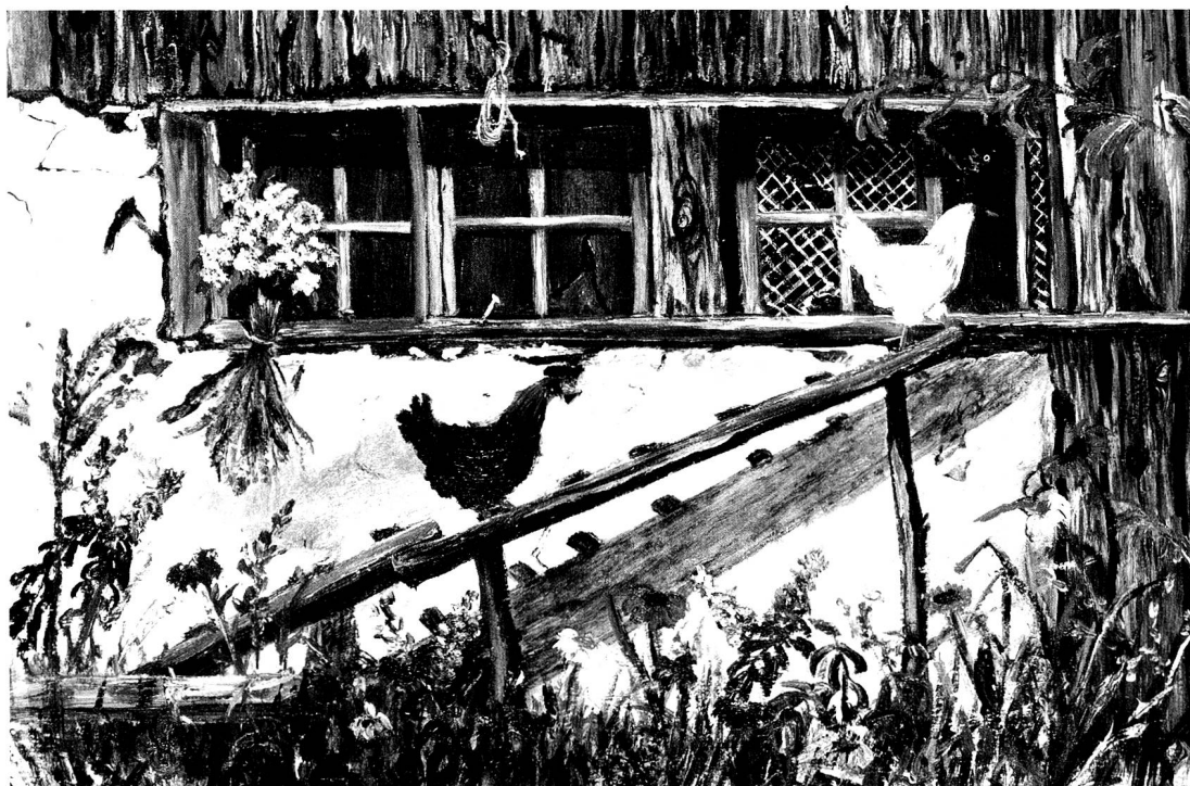
Stilleben, Oel, 13 x 18 cm.

Umgebung der Stadt, aber noch mehr in der Heimat ihrer Grosseltern im Bernbiet, die Schönheiten der Natur und das gesunde Bauernleben. Sie genoss die Blueschzeit, die summen- den Bienen, das Vieh auf der Weide, die Hühner im Hof, die Zeit der Reife und Ernte. Sie freute sich an üppigen Gärten, an duftenden Wiesen, aber auch an der Stille des Winters.