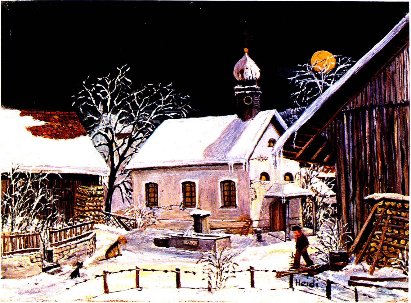
St.Laurentius-Kapelle, Bazenheid, Oel, 13x18 cm.