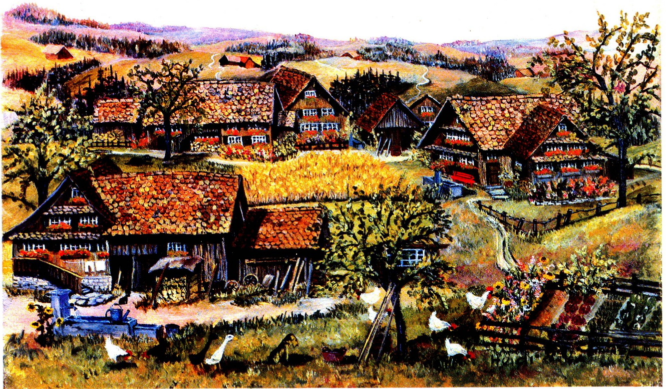
Sommeridyll, Oel, 18 x 24 cm.