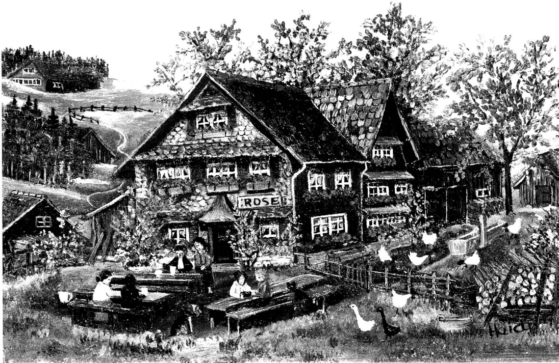
Gartenwirtschaft in Appenzell, Oel, 13 x 18 cm.

Jugend. Seither hat es – wenn man das von jedem Weiler und Hof sagen könnte – kaum etwas von seinem ursprünglichen Charakter eingebüsst.