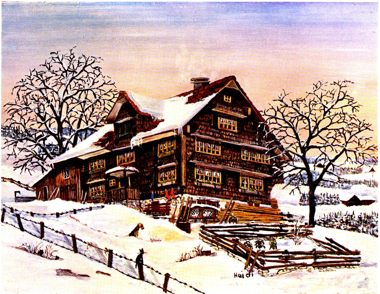
Haus bei Husegg bei Nesslerau, Oel, 18x24 cm.