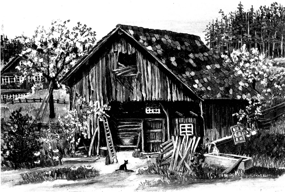
Stall bei Lutenwil, Oel, 13 x 18 cm.

rendes dabei ist, so lässt es die Künstlerin einfach weg.