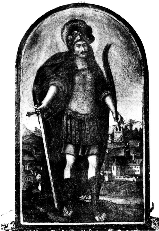
Kloster Wattwil, Oelbild des hl. Leander, kurz nach 1650. Rechts älteste Darstellung des Klosters und der Burg Iberg.