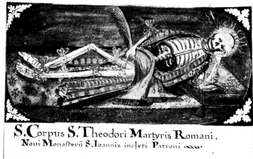
Neu St. Johann, ehemalige Klosterkirche. Katakombenheiliger Theodor im rechten Seitenaltar, barock gefasst 1687. Zeichnung von Pater Ambros Epp, 1773, in Hierogazophylacium.

Ganz durch Zufall entdeckte man in Rom bei Strassenarbeiten an einem Maientag des Jahres