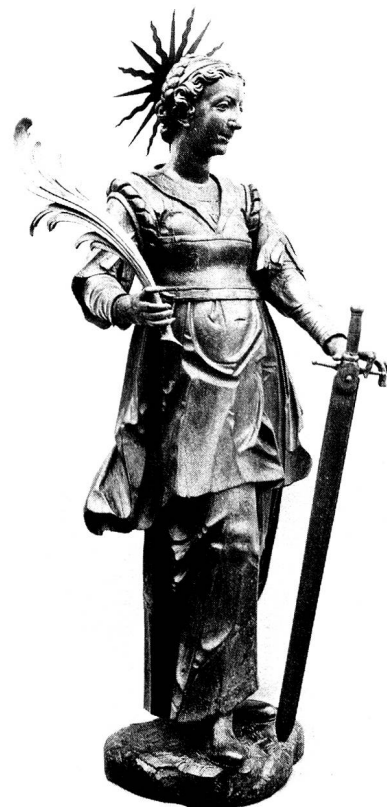
Hl. Theodora, Bildwerk in der Klosterkirche Magdenau, Ende 17. Jahrhundert, wohl von Jakob Hunger aus Rapperswil.