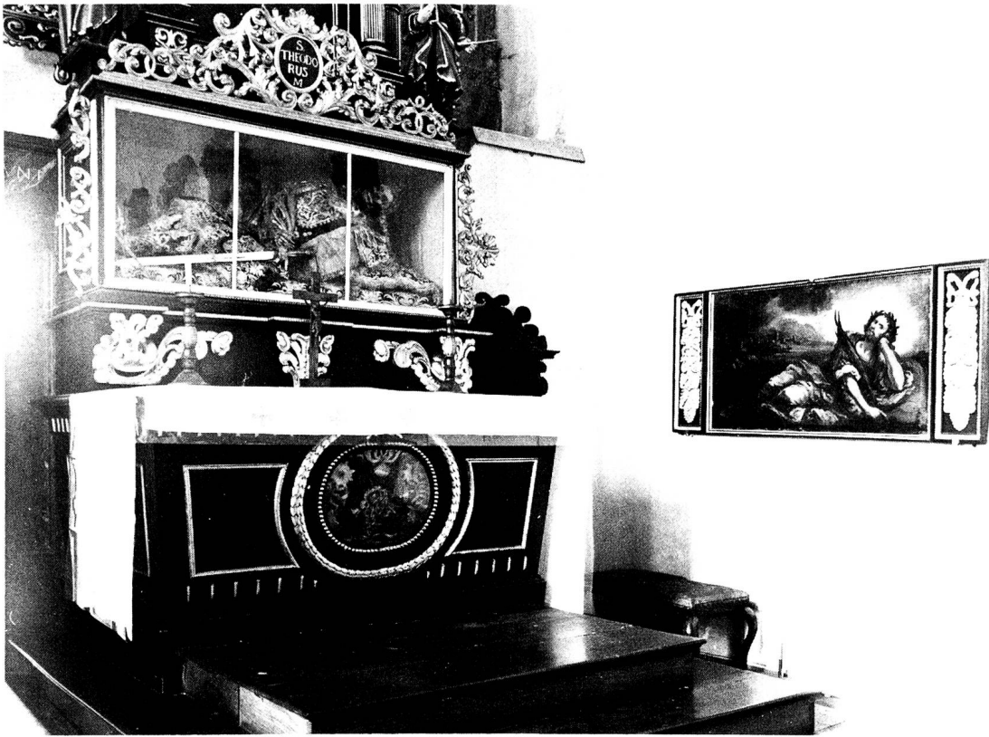
Neu St. Johann, südlicher Seitenaltar. Über der Mensa Schrein des Katakombenheiligen Theodor, von Rom überführt 1647, neu gefasst 1685 von den Schwestern im Kloster Maria der Engel in Wattwil. Rechts an der Wand bemaltes Deckelbrett des Sarkophags.

mochte die kritische Forschung den Irrtum dieser Annahmen nachzuweisen.