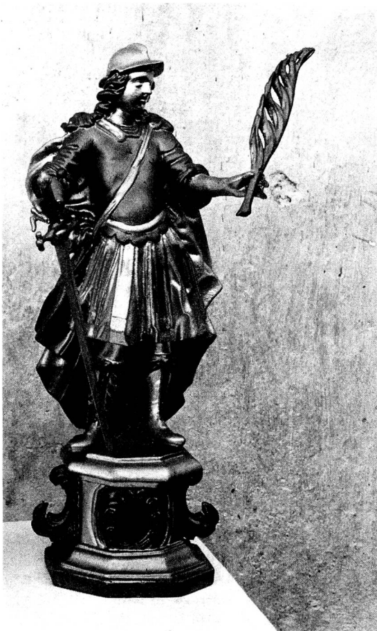
Kloster Wattwil, Statuette des hl. Leander. Anfangs 18. Jahrhundert, in römischer Militärtracht.

Altäre eingelassen sind. Doch wurden die Römischen Märtyrer nicht von allem Anfang an auf diese Weise gefasst. Bis ungefähr um 1680 war vielmehr die sogenannte «phrygische Art» üblich, d.h. die Gebeine wurden damals nicht in eine Körperform gebracht, sondern geometrisch-ornamental im Gehäuse ausgelegt. Manchmal hat man für den Schädel noch ein eigenes Reliquiar herstellen lassen.