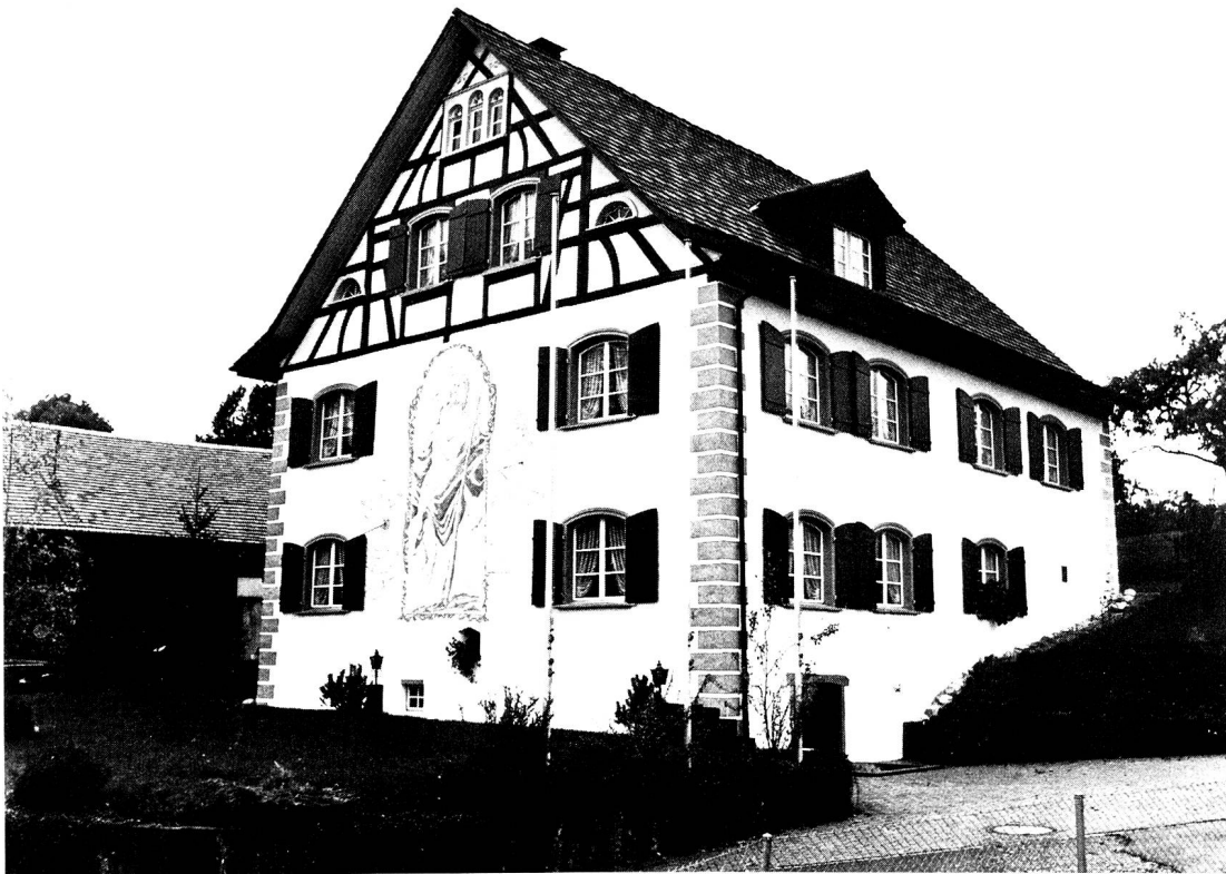
Christophorus-Haus in Bazenheid.